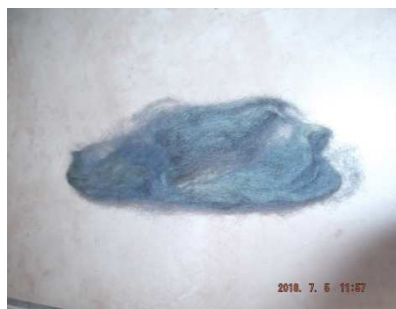
תמונה מס' 2

3. ביום, בישול בחום נמוך [כ-60 מעלות] כשעה בשמש, התוצאה גוון כחול. תמונות מס' 3-4. בבישול בהרתחה מלאה של כמה דקות, הצבע נהרס.