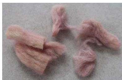
תמונה מס' 5