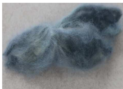
תמונה מס' 3