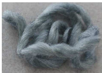
תמונה מס' 4