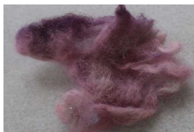
תמונה מס' 7