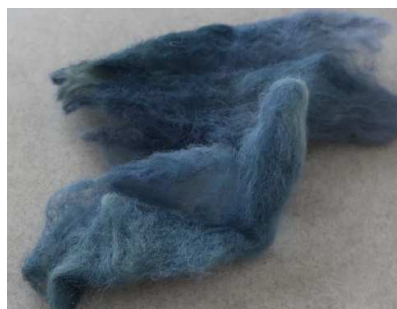
תמונה מס' 1