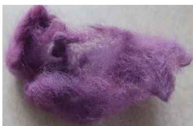
תמונה מס' 6