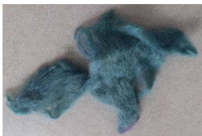
תמונה מס' 8