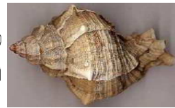
צורת דג, חלזון או שניהם?