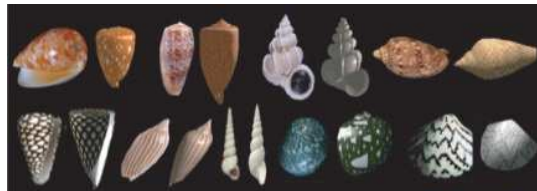
מיני חלזונות אחרים:

בתמונה משמאל רואים שנראית כמורקס צורה זו משני צדדיו, אלא שבצד זה בולט גם כן פתח הנרתיק. והנה כדי לומר על החלזון שתבניתו דומה לדג באמת בעינינו רק שיהיה דומה לו מהצד שלמעלה, אבל מעלה יתירה יש בפורפורה דידן שרואים בו צורת דג גם מלמטה.