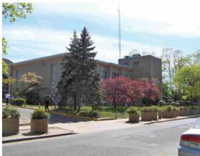
בנין הישיבה הישן של ליקווד