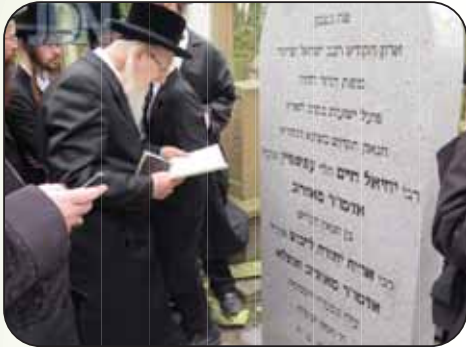
המצבה החדשה בקראקא