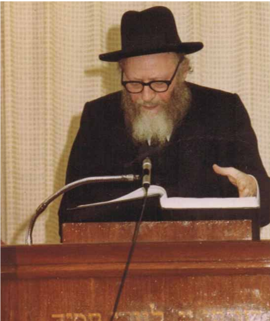
רבינו מוסר שיעור בישיבה

מרן רבי אהרן קוטלר צוק"ל היה זה שהשתית את היסודות האיתנים לעולם התורה בארצות-הברית. או כפי שביטא את תשוקת נפשו תיכף בהגיעו על אדמת אמריקה: "הקב"ה הצילני מגיא ההריגה והותירני בחיים לא בכדי, אלא כדי שאקים את עולם התורה אשר נגדע ונשרף