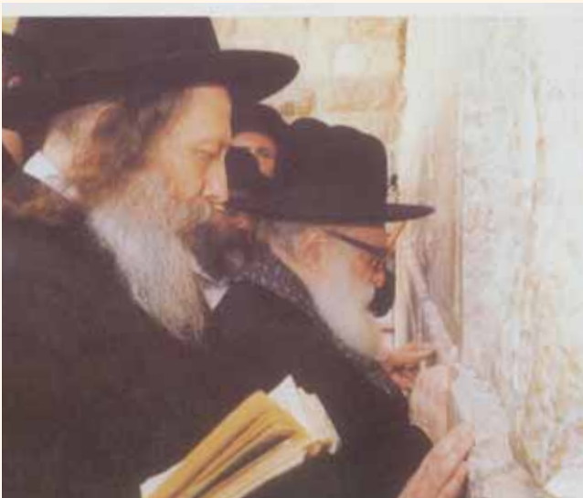
ראיתי בחלומי. כ"ק מרן האדמו"ר ה'לב שמחה' זצוק"ל, בתפילה בכותל המערבי ולצידו כ"ק מרן האדמו"ר מגור שליט"א לאחר שעלו למערת בית גור בהר הזיתים ביום מלאות השבעה לפטירת כ"ק מרן האדמו"ר בעל ה'בית ישראל' זצוק"ל

"דרכו בקודש אשר סלל לרבים, שזורה בשיטתו זו, באלפים רבים של דברי תורה שהשמיע בסוד שיח שרפי קודש של גימטריאות ורעיונות המיוסדים על השמות הק' כאשר הרעיון המרכזי הוא לראות את השי"ת ואת שמותיו הק' והנוראים בכל דבר ועניין.