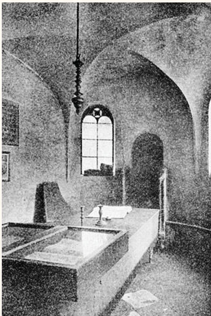
פולמוס נוקב בהבנת דברי רש"י. בית מדרשו של רש"י בוורמזא

והנה, קדם ל'אור החיים' במאות שנים, רש"י, שאף הוא בתוך פירוש ודרשה כתב על כך, אך ההיפך! רש"י (שמות פרק כג, פסוק יט) על הפסוק: ראשית בכורי