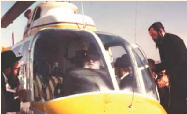
בחלום אדבר בו. רבינו מגיע לעמנואל