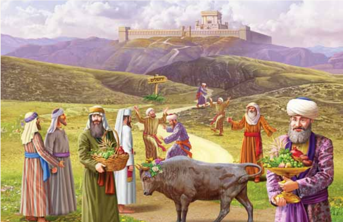
ביכורים | מלכות וקסברגר

הט"ז בחיבור "דברי דוד" על פירוש רש"י על התורה, כתב: ראשית בכורי אדמתך, אף השביעית בכלל. כן הוא ברוב הספרים, והקשה הרא"ם ע"ז מן המכילתא, וב'גור אריה'