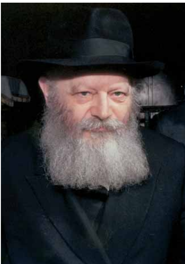
מעין המתגבר. כ"ק מרן אדמו"ר מליובאוויטש זי"ע

קשה להגזים בחשיבות המופלגת של מציאת המגמה והתכלית של רש"י בחיבורו על התורה. מבוכה רבה שוררת בנושא זה, הולמד המצוי עלול לטעות שאין כאן שום מגמה