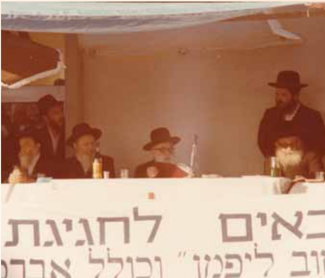
בנתיבי העליה והרוממות. רבינו עוסק בלימוד תוך כדי חנוכת הבית לבית החסידים בערך אותו חיבב והעריך