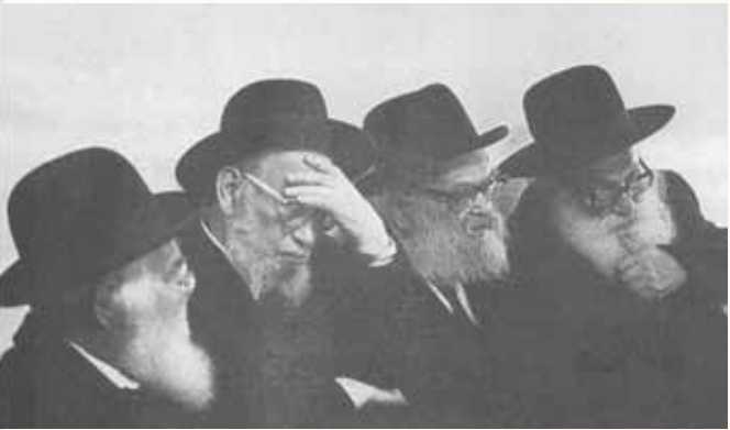
הדרכה ישרה. בישיבת מועצת גדולי התורה

וכה כתב ר' יונה לרבי זי"ע: "בכל פינה חסרת לנו!, בשנה שעברה היה לנו שיעור טוב, והיום אני רוצה ללמוד ואין לי עם מי. מעי המו בעזת זכרי את השיעור בשנה שעברה אצליך..." הרבי זי"ע השיבו ממקום שבתו בירושלים בזה"ל: "...זה זמן', זמנם, זמניהם שרציתי להשיב על מכתביך, וכנראה הלבבות