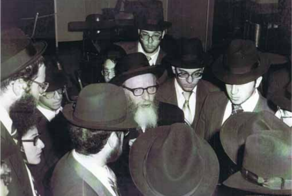
רבנו בישיבה מוקף בתלמידים

באירופה בלהבות הכבשן, כאן, על אדמת אמריקה". ואכן איתנים היו היסודות.