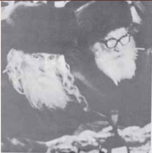
לזכור את ה' בכל מעשיו. עם אחיו כ"ק מרן אדמו"ר ה'בית ישראל' זי"ע