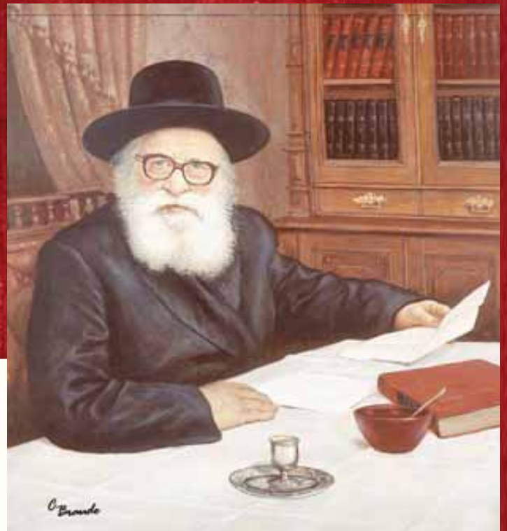
צורת קדשו של רבינו

הצצה זעירה אל מסכת בלתי נודעת מימי חייו דבקוהו בהשם יתברך ובשמותיו הק' בכל עת של כ"ק מרן אדמו"ר בעל ה'לב שמחה' מגור זי"ע