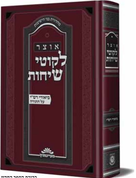
כריכת הספר החדש

מהלך שלם: כאשר באים להודיע לאדם ציווי מסוים, קל יותר ללמדו את המצוה בהתאם לפרט אותו הוא מכיר זה מקרוב. גם כאן, כאשר בא משה לומר לבני ישראל את מצוות קרבן תודה, הביא קודם את הנסים אותם הכירו וחוו זה עתה: עברו את הים ('יורדי הים'), הלכו במדבר ('עוברי מדבריות'), והיו סגורים במדבר ארבעים שנה ('חבושי בית האסורים'). לעומת זאת המקרה הרביעי של 'חולה' לא הכירו. לכן אמר להם משה דווקא בסדר הזה, כפי שהוא מופיע ברש"י, ולכן גם המקרה השלישי נאמר בלשון רבים 'חבושי בית האסורים', כיוון שכל עם ישראל היו בבחינה זו. לעומת זאת בגמרא, זה הובא כפי שהוא הסדר המצוי אצל בני אדם, שיותר מצוי חולה שנתרפא, וכך גם לא מצוי כ"כ רבים שיהיו חבושים בבית האסורים!