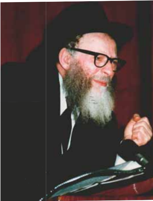
ריתחא דאורייתא. במסירת שיעור

התקופה הראשונה שלאחר הסתלקות אביו, רבי אהרן הגדול מליקווד. רבנו היה אז צרוץ כולו. כאב ליבו על הסתלקות מורו ומאורו ונטרדה נפשו מהעול הגדול שנפל עליו. באותם הימים פגש את רבנו מרן הגאון רבי מרדכי גיפטר זצוק"ל, שעודדו ואמר: "עליכם להיות מוטרדים, לא מהחשש שמא תתמוטט הישיבה. אלא מהרצון והשאלה, איך מגדלים ומפתחים את הישיבה ביתר שאת!"