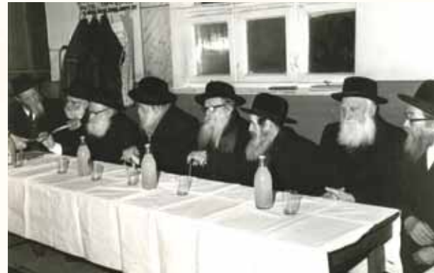
עם רבני העיר תל אביב