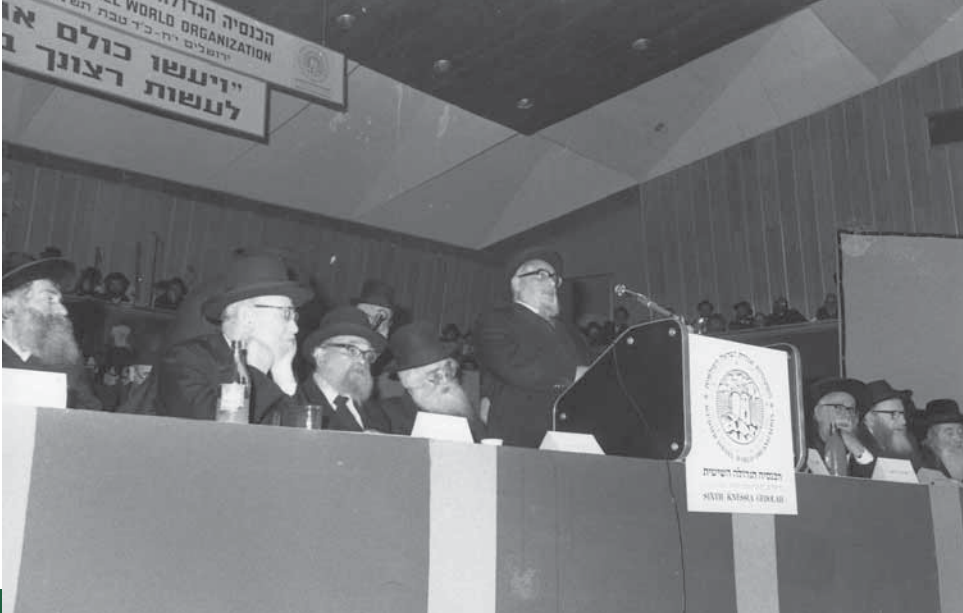
משתתף בכנסיה הגדולה השישית. מימין לשמאל: מרנן כ"ק אדמו"ר מערלוי זצ"ל, רבינו, הגאון רבי שלמה זלמן אויערבאך זצ"ל, הגרא"י דינר זצ"ל, הגרא"מ שך זצ"ל, הגאון רבי יעקב קמינצקי, כ"ק אדמו"ר ה'פני מנחם' מגור זצ"ל