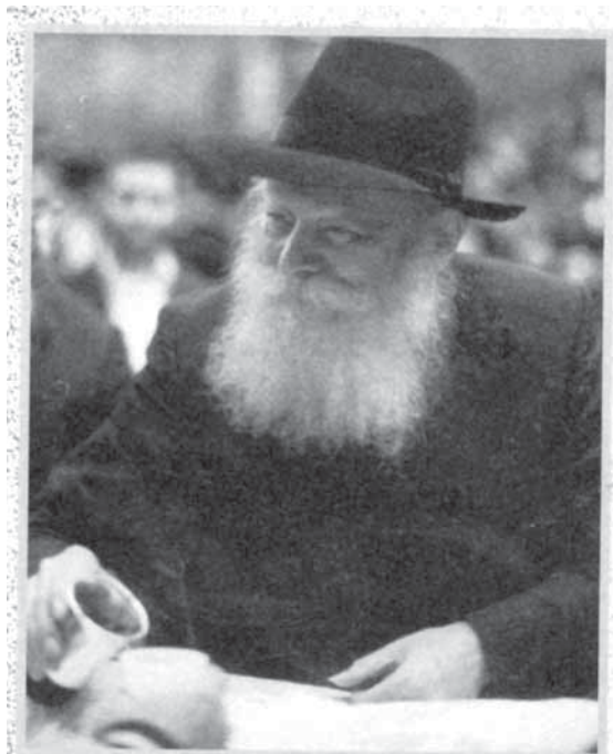
הבנת ה'פשט' בדברי רש"י. הרבי בחלוקת כוס של ברכה

"...בשיחות על רש"י, אפשר לומר שהרבי היה כמו מחנך פדגוג, בלמדו דרך סלולה איך ללמוד רש"י, ובפרט, לשים לב לפרטים, שממבט ראשון לא נראה שיש דברים בגו. אתה מקבל דרך לדייק ולשים לב, וכך מגלה דברים נפלאים..."