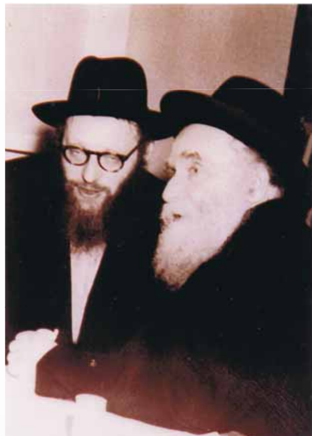
עם אביו מרן הגר"א קוטלר זצ"ל

זמן רב עתיד לחלוף בין האירוסין ועד שמחת הכלולות עצמה, בינתיים עתידה יהדות אירופה להתמוטט כליל ושישה מיליוני יהודים לעלות בסערה השמימיה ולחסות הכי קרוב אל כיסא הכבוד. כשפרצה המלחמה, הצליח רבנו להימלט