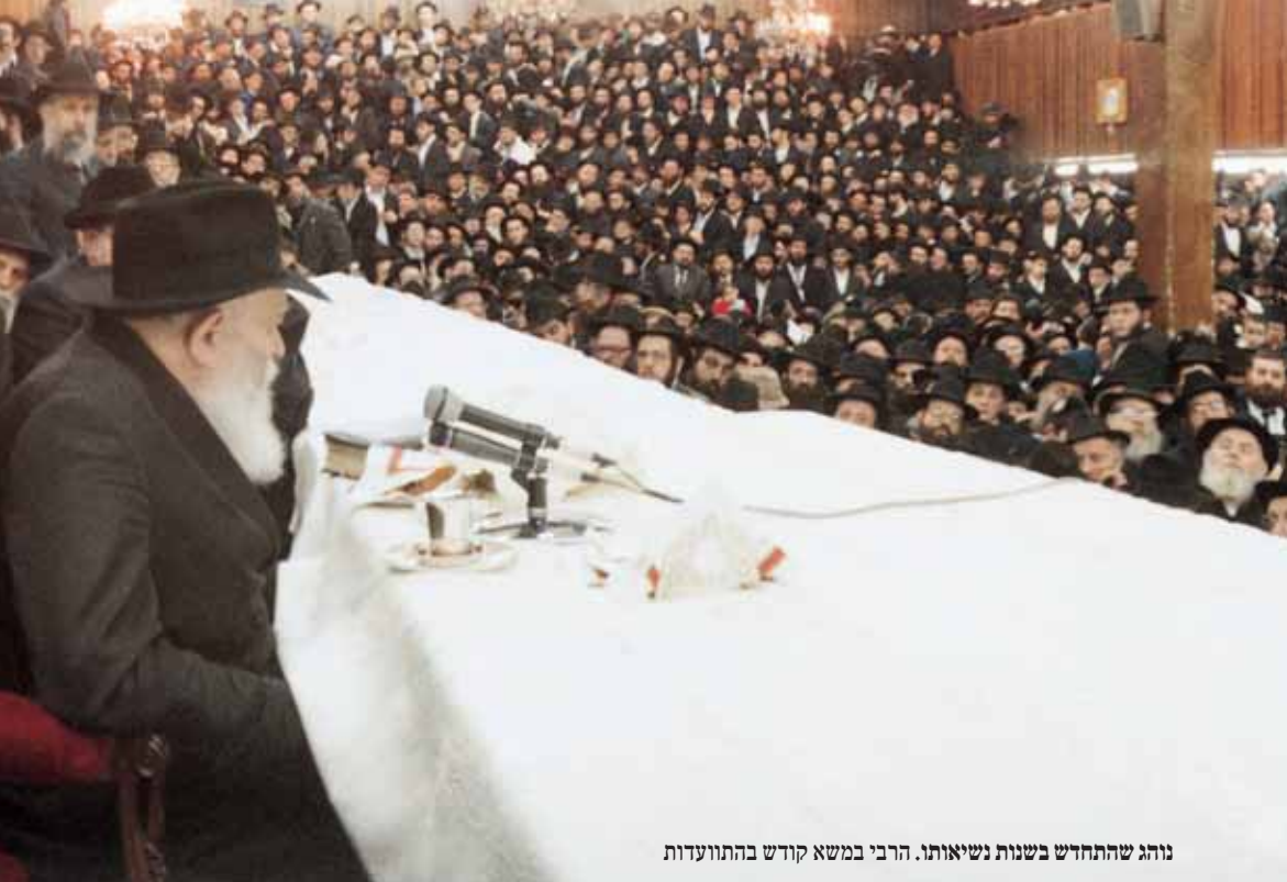
נוהג שהתחדש בשנות נשיאותו. הרבי במשא קודש בהתוועדות

"הרי כיון שאירע מאורע הנ"ל יש מקום לומר שזהו סימן שמלמעלה יש קפיצא על הנהגה זו, ולכן אבטל את המנהג להודיע ולהכריז מראש איזה פירוש רש"י יתבאר בהתוועדות..."