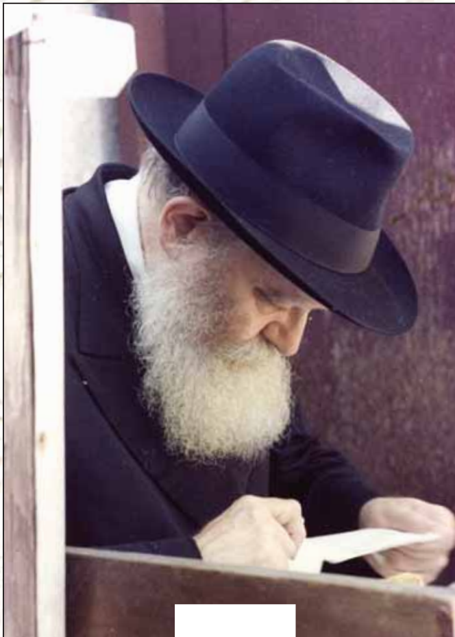
כ"ק מרן אדמו"ר מליובאוויטש זי"ע