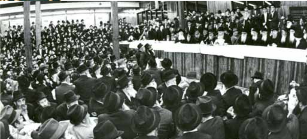
במסגרת ה'התוועדות' החסידית ייחד הרבי שיחה שנסובה על דיבור אחד מפירוש רש"י בפרשה. התוועדות

אנו מסיימים את השיחה, מלאי חשק ותשוקה להתחיל ללמוד חומש-רש"י מחדש, עם הקו שהתווה אותו צדיק זי"ע, עם אותם כללים שאיזן וחקק, ובעיקר: באותה רצינות, לכל דיבור של רש"י!