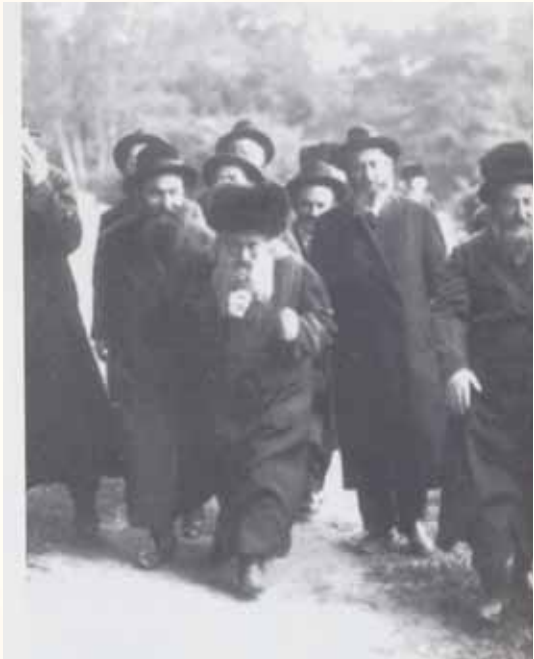
שויתי ה'. אביו כ"ק מרן אדמו"ר ה'אמרי אמת' עם בניו כ"ק מרן אדמו"ר ה'בית ישראל' ורבינו זי"ע