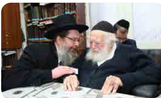
המשך בעמוד 8

סיפר לי רבנו זיע"א, הייתי פעם אצל רבי איסר זלמן מלצר זצ"ל וא"ל בשם הגר"א על הגמ' סוף סוטה: א"ל ר"י לתנא לא תיתנו משמת רבי בטלה ענוה דאיכא אנא, ולכאורה איזה ענוה זו, ואמר בשם הגר"א שיש תנא שקורין לו אנא, עכ"ד.