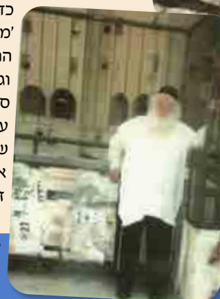
'ומאז במשך כעשר שנים, אבא נסע לצפת, בדירה שדאגו לסדר לו מראש' הרב זצ"ל במרפסת הדירה שהיה שוהה בה בצפת.

שח הרב זצ"ל באחת ההזדמנויות: פעם בבין הזמנים אבא לקח אותנו לגן החיות, כדי לברך את ברכת 'משנה הבריות', בגן החיות ראינו גם קוף וגם פיל, ונתעורר לנו ספק אם עלינו לברך על כל אחד בנפרד, או שברכה אחת פוטרת את שניהם, כששאלנו זאת את מרן החזו"א,