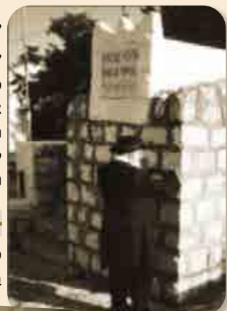
'פעם אחת בחיים צריך ללכת ולהתפלל שם' הרב זצוק"ל בקברי צדיקים

'פעם כשהביאו מזון להתקין בדירה בצפת, כדי להפיג מעט מהחום ששרר בחוץ, אבא אמר לי, שכאשר החזו"א היה בטבריה, והיה חום גדול, שאלו את החזו"א, כיצד הוא מצליח ללמוד בחום הזה, החזו"א ענה להם, כל החום הזה מפריע עד שאני מתחיל ללמוד, כשאני