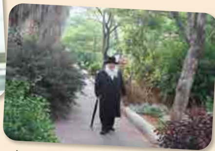
'אין חילוק בין בין הזמנים לכל השנה'. הרב זצוק"ל בלמוד החובות בהליכה היומית.