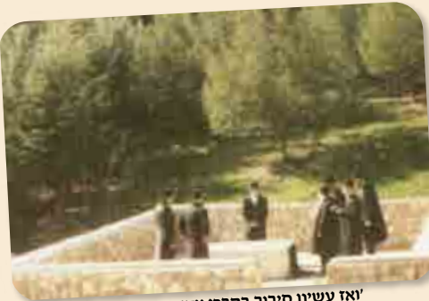
'ואז עשינו סיבוב בקברי צדיקים שבאיזור' הרב זצ"ל בקברי צדיקים.

עוד ממשיך הוא לספר לנו: 'זכורני שפעם אחת, השכנים שלנו, ראו שאנחנו לא יוצאים לטיולים, הם עשו טובה גדולה ולקחו אותנו, אבל גם זה היה מלווה בלחץ, כי הרי אבא מתפלל מעריב בזמן, וצריך להיות פה 40 דק' אחרי השקיעה'.