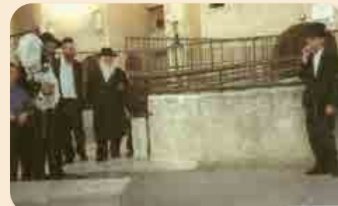
'לאחמ"כ ביקש אבא להביא ספר תורה שלו' הרב זצ"ל עם ספר התורה שהביא במיוחד.

שח בנו של הרב זצ"ל, הגרי"ש שליט"א: 'בימים כתיקונם, בשנים עברו, אבא בכלל לא היה נוסע לנופש, לא בזמן ולא בבין הזמנים, רק מלפני כשלושים שנה, כאשר אמרו לאבא, שנופש מחוץ לעיר יעשה טוב ויתן מנוחה לאמא ע"ה, בתחילה אבא התחמק, ואמר בבדיחותא: 'אבא היה אומר, ארון ישן לא מזיזים אותו ממקום למקום', לבסוף אבא הסכים, ומאז במשך כעשר שנים, אבא נסע לצפת, בדירה שדאגו לסדר לו מראש'.