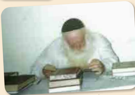
הרב זצוק"ל בכתיבת ספריו בדירה בצפת 'אין בין הזמנים בעולם'.