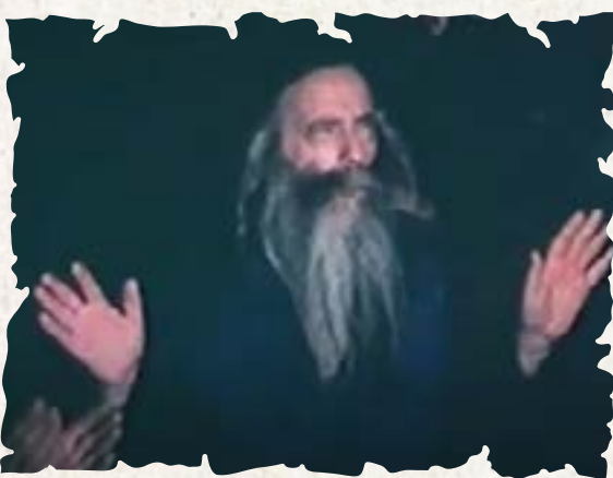
האדמו"ר השפע חיים זיע"א בעת ריקוד מצוה טאנץ

ובכן ניגון זה הוא "ניגון קאסאן", שחיברו הקדוש ר' שמעון וייס הי"ד, נכד ה"בני שלשים" האדמו"ר הראשון לבית קאסאן זיע"א, מהעיר ווישקע ומכאן שמו ר' שמעון ווישקער. והניגון היה מושר אצל חסידי קאסאן עם חרוזים באידיש, כפי שמסופר על ידי שרידי החסידים וצאצאי האדמו"ר מקאסאן. ומהיכן נובע הטעות לייחסו כניגון צאנז? ובכן מעשה שהיה כך היה, האדמו"ר השפע חיים מצאנז קלויזנבורג זיע"א, היה מסתובב במחנות הדי. פי. של שרידי היהודים משוחררי הנאצים ימ"ש, בכדי לחזקם ולעודדם, ואתו עמו היו קבוצה של בחורים מתלמידי ישיבת קאסאן שהסתובבו עמו, והם היו שרים את הניגון הזה, מה שמצא חן בעיניו של השפע חיים, שגם אמצו והיה משוררו בעת שהיה רוקד מצוה טאנץ, וגם בעת שהיה רוקד 'בואי בשלום' בהתלהבות בליל שבת כדרכו בקודש, ומכאן השתרש הטעות לייחסו כניגון צאנז, וכאמור סגנונו העתיק של הניגון הוסיף אל הדמיון לייחסו כניגון עתיק מצאנז ויש שגם חיוו את דעתם שבוודאי זה