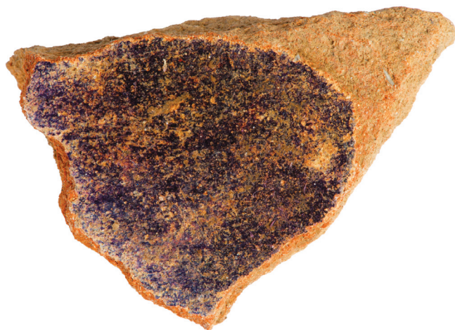
שבר כלי חרס ועליו שרידי צבע מחילזון קהה-קוצים, אתר שקמונה, תקופת הברזל

שקמונה: בתל שקמונה שבחוף הכרמל נמצאו שרידים של תעשיית הארגמן מתקופת הברזל II (המאה ה"ט–הח' לפני הספירה) והם כוללים חלזונות ושברי כלים שבדופנם הפנימי השתמר משקע של צבע סגול, אשר בבדיקה כימית נמצא שמדובר בצבע ארגמן. הארגמונים שנמצאו באתר הם מהמינים קהה-קוצים, חד-קוצים ואדומת-הפה. אחד מכלי החרס היה בעל מפתח גדול (40–60 ס"מ), שנודעת לו חשיבות גדולה למחקר, מפני שנתרו בתוכו, בחלקו העליון, שרידי צבע ארגמן הנראים כפס צר, ואילו שאר הכלי נקי משרידי צבע. שרידי פחם שנמצאו ליד הכלי מעידים על השימוש בו לבישול תמיסת הצבע. יש לשער שתמיסת הצבע המחזורת התחמצנה רק בחלקו העליון של הכלי,