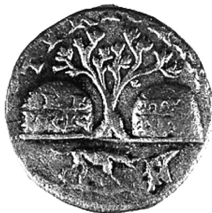
מטבע מהעיר צור ועליו איור של כלב וקונכיות הארגמן, המתאר את גילוי צבע הארגמן (מתוך הספר Jidejian, Tyre through the Ages )

על מטבעות רבים של צור העתיקה טבוע ציור של קונכיות הארגמן, החל במטבע כסף מסוף המאה ה' לפני הספירה בקירוב ובמשך כל התקופה הרומית. במטבע ברונזה מסוף המאה ה' לספירה נראה כלב מרחרח קונכיות ארגמן, סצנה המנציחה את הסיפור המיתולוגי על גילוי צבע הארגמן בידי האל הפיניקי מלקארת (הרקלס בנוסח היווני), פטרונה של העיר צור. כן נמצא בצור ארון קבורה (סרקופג) מהתקופה הרומית ועליו חקוקה כתובת ביוונית המציינת את שמו ומקצועו של הנפטר: אנטיפטר, דייג חלזונות ותעשיין של ארגמן.