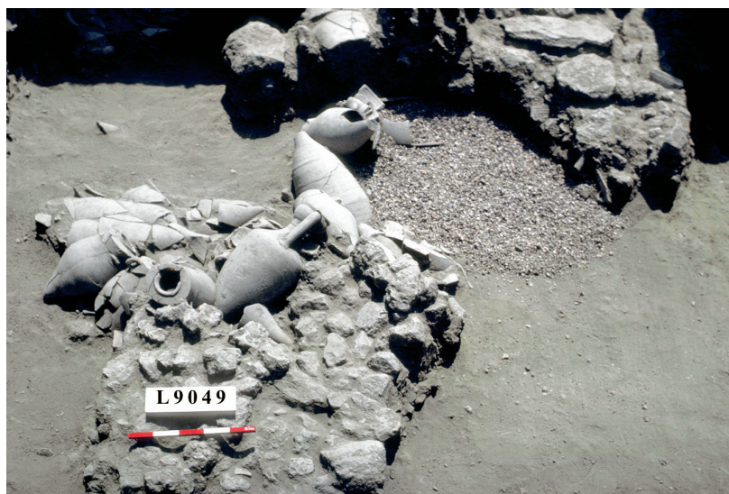
תל דור, ערימת רסק קונכיות ולצדה אמפורות יווניות ופיניקיות מהתקופה הפרסית

מחקרנו מתמקד באזור הים התיכון, שכן כל העדויות ההיסטוריות ורוב השרידים הארכאולוגיים הם ממרחב זה.