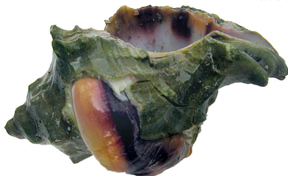
ארגמן קהה-קוצים שפוצח באזור הבלוטה התחתית-זימית

עדויות ארכאולוגיות רבות קיימות לתעשיית הארגמן באזור מזרח הים התיכון, ברובן מצבורי קונכיות ארגמן שבורות או מרוסקות. אולם הוכחות ישירות לתעשיית הארגמן קיימות רק במקרים שישנם שברים בקונכיה באזור הבלוטה התחתית שממנה מופק הצבע, או ממצא קונכיות בזיקה למתקני תעשייה, פעמים עם שרידי צבע ארגמן. אחד המאפיינים הקרמיים של תעשייה זו הם כלי חרס גדולים, עבי דפנות, העמידים בחימום ובבישול ממושכים. קונכיות שנמצאו בהן חורים אופייניים של קדיחה הם עדות לקניבליזם, כלומר שנטרפו בידי חלזונות אחרים בני מינם. תופעה זו רומזת לכך שגודלו בבריכות, משום שהם אינם זמינים בכל עונות השנה.