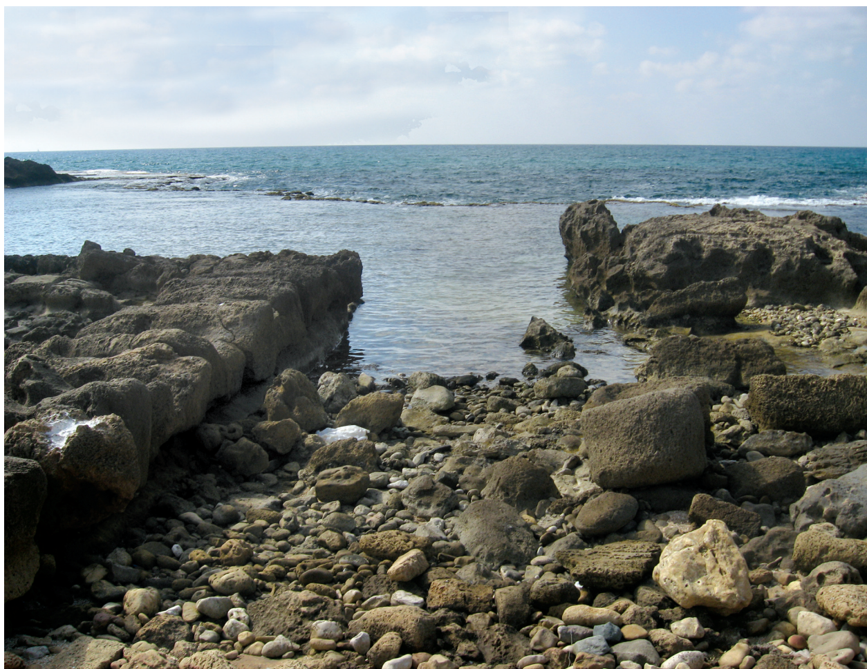
בריכות חצובות בתל דור סמוך למתקני צביעת הארגמן, שימשו כנראה לגידול ארגמונים

תל דור: בתל דור שבחוף הכרמל נמצאו כמויות גדולות של קונכיות מרוסקות. כל אלפי הקונכיות היו כמעט באותו גודל, ופירוש הדבר כנראה שהן לא נשלו מן הים, אלא