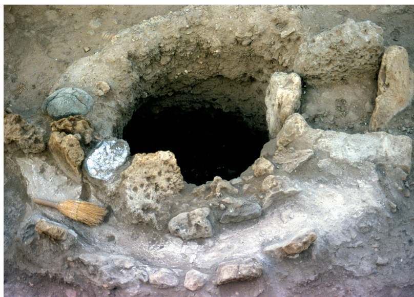
תל דור, חלק ממתקן מטווח להכנת צבע הארגמן, מוכתם בכתמי צבע מהתקופה הפרסית. הבור לצדו נמצא מלא בשברי קונכיות

תל מבורך: אתר שממוקם כארבעה ק"מ צפונית לקיסריה. נמצאו בו בלוקסים רבים קונכיות של ארגמון קהה-קוצים ומעט יותר קונכיות של ארגמנית אדומת-פה. כן נמצא במקום מתקן שלדעת החופרים שימש לצביעה. קיסריה: בעיר נמצאו קונכיות ארגמון חד-קוצים פזורות בשטחי חפירה שונים, אך מספרן אינו רב; בחלקן קדוחים נקבים קטנים הרומזים לקניבלזם (תופעה המצביעה על גידולן בבריכות). נראה שמרכז תעשיית הצביעה לא היה בתוך העיר עצמה, אלא באתרים שצפונית לה.