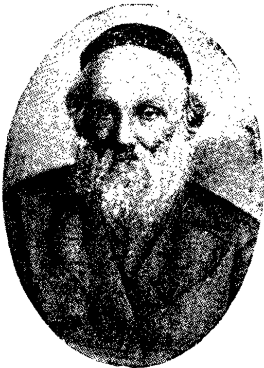
רבי דוד פרידמאן