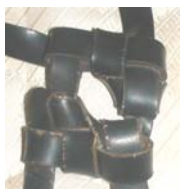
דל"ת כפולה (רנ"א)

בתפוצות ישראל קיימים שלושה אופנים לצורת קשירת קשר תפילין של ראש, ואלו הם: