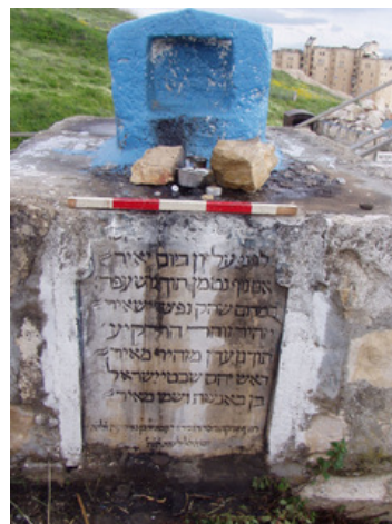
איור 8. כתובת מצבת הקבורה של מאיר בן באנשת.

הנקבר, הדיין ר' ישועה הלוי, שנפטר בשנת ה'ש"ו (1546 לסה"נ), הוא כנראה ר' ישועה, דיין קהל המוסתערבים בצפת בימיו של ר' יעקב בירב (דודסון א' 2009, חכמי צפת בין השנים 1540-1615, עבודת דוקטור, האוניברסיטה העברית, ירושלים, חלק א, עמ' 70, 75, 81). ר' ישועה היה קרוב לוודאי אחד מחכמי ישיבת ר' יעקב בירב, ואפשר שהתואר 'הדיין המוסמך המאושר' מורה על כך שהיה בין הרבנים שזכו לקבל סמיכה ישירות מר' יעקב בירב, או מתוקף סמכותו, בזמן חידוש הסמיכה בצפת בשנות ה-30 של המאה ה'ט"ז לסה"נ. התואר 'מאור הגולה' תמוה וצריך עיון.