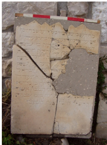
איור 18. כתובת מצבת הקבורה של ר' יוסף מטראני.