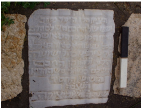
איור 7. כתובת מצבת הקבורה של ר' ישועה הלוי בן ר' משה הדיין.