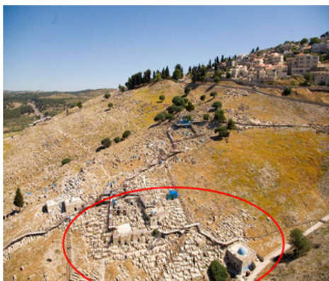
איור 1. בית עלמין צפת, סימן אזור כתובות קבורה מן המאות ה"ז-ה"ז, מבט לצפון.