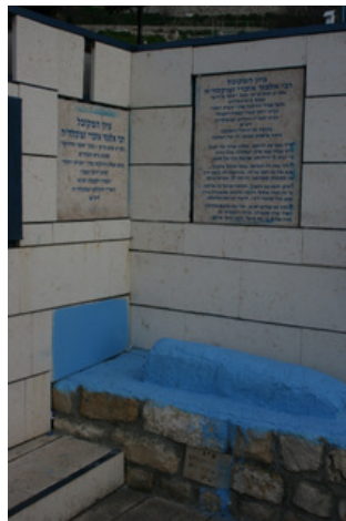
איור 15. מצבת הקבורה של ר' אלעזר אזכרי לאחר הצבתה מחדש (2011).