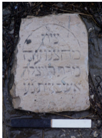
איור 27. כתובת מצבת הקבורה של רחל האשכנזית.