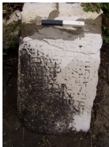
איור 4. כתובת מצבת הקבורה של ר' עזריאל טרבוט.