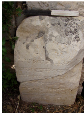
איור 13. כתובת מצבת הקבורה של ר' משה צהלון.