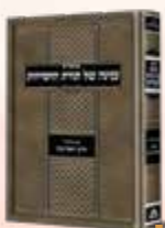
ענינה של תורת החסידות