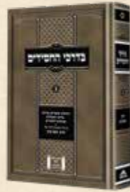
בדרכי החסידים - חלק ב' התוועדות ה'חור' הגה"ח ר' יואל כהן