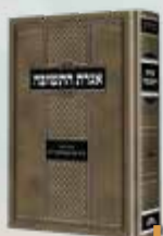
מחשבת החסידות תורה ומצוות