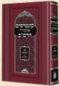
קונטרסים אדמו"ר הרש"ב קונטרס עץ החיים עם ביאור חדש