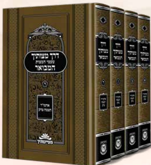
דרך מצותיך המבואר ד' כרכים

טעמי המצוות על פי החסידות לבעל ה"צמח צדק"