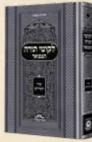
לקוטי תורה המבואר שיר השירים כ"ק אדמו"ר הזקן בעל התניא