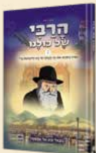
הרבי של כולנו - חלק ב' סיפורים בקומיקס מאת נתנאל אפשטיין