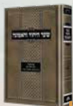
שער היחוד והאמונה