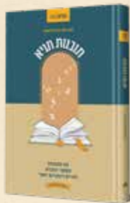
תובנות תניא 50 תובנות לחיים מספר התניא. מאת הרב אריק מלכיאלי