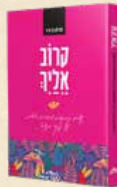
קרוב אליך 90 נשים כותבות מזויות אישית על פרקי ספר התניא