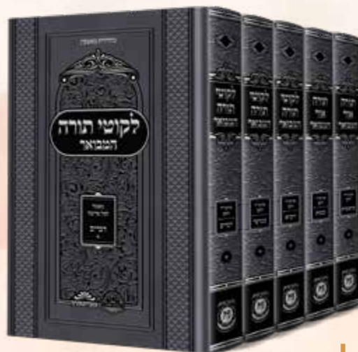
תורה אור ולקוטי תורה המבואר ה' כרכים

כ-100 מאמרים של בעל התניא לפרשות השבוע, מועדים ושיר השירים