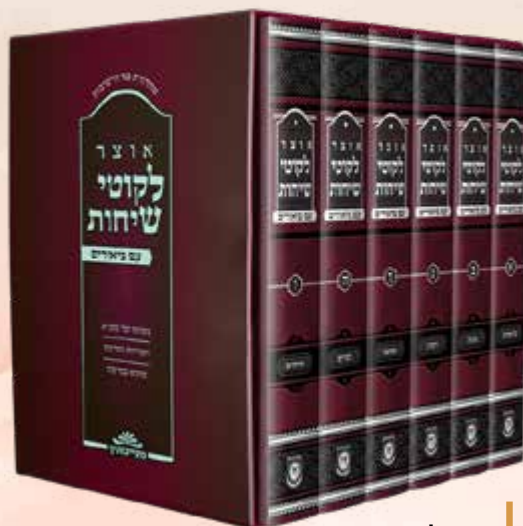
אוצר לקוטי שיחות עם ביאורים ו' כרכים

אוצר של 6 שיחות לכל פרשה וחג מתוך סדרת ט"ל כרכי לקוטי שיחות של כ"ק אדמו"ר מליובאוויטש בנוסף לקוטי שיחות לפי נושאים: לשיתיהו, כלל ישראל, רש"י על התורה