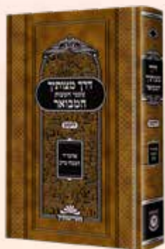
דרך מצותיך המבואר ליקוט

אחת עשרה מצוות יסודיות מתוך סדרת 'דרך מצותיך המבואר'