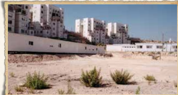
משכן הארעי של הישיבה בראשית שנותיה של הישיבה