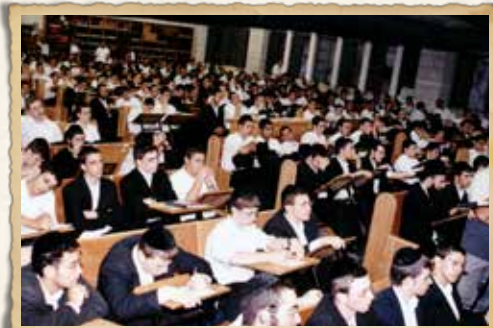
כניסה לבנין הישיבה - אלול תשס"ג