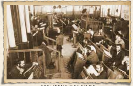
הישיבה בבית הכנסת 'אחווה'

למיר' כאל אבן שואבת בגלל דמותו הקמאית הקורנת באור אהבת תורה של מרן הגרא"י, כאשר הוא שש כמוצא שלל רב על כל חידו"ת ששמע מפי תלמידיו, ע"פ רוב בשעה שסעד את ארוחותיו, ואף המילגה שקיבלו האברכים הייתה חלקה כפופה להרצאת חידו"ת באוזניו. שמיעת חידו"ת לא הייתה מהאוזן ולחוצץ. רבינו היה מתערב כל העת בעת הרצאת הדברים, מטיל סברא הפוכה לעומת נושא הדברים והלך עימו הלוך ושוב, וכפי שהסביר פעם לרבנית ששאלה אותו על כך, שכל מטרתו בזה שהבחור והאברך יבינו את הדברים שהם אומרים בצורה טובה יותר. סיבה נוספת הייתה שרבים ראו ברבינו דמות נערצת של גדלות עצומה בתורה שיש ללכת בדרכה כשהיה ידוע שרבינו מסיים את הש"ס כל שנה, כל חצי שנה ש"ס משניות וכל ארבעה חודשים את כל חלקי הרמב"ם. לפעמים שהיה דורש מבחורים להצביע על מקור בש"ס לדברי רמב"ם מחודשים וכשלא היו יודעים היה מציינ מהיכן דברי הרמב"ם נובעים.