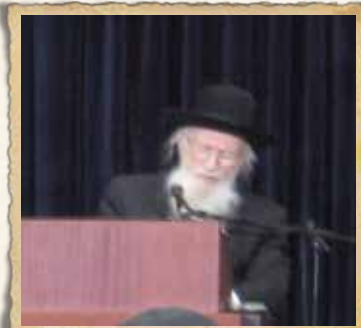
חנוכת הבית שבט תשס"ו