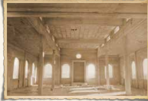
פנים בית המדרש המרכזי בהיבנותו שנת תש"ד