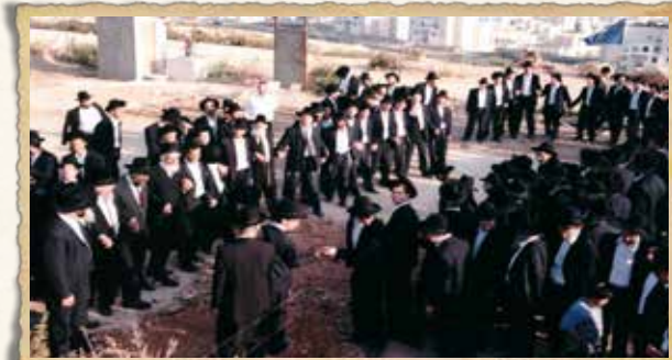
הנחת אבן הפינה