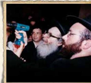
מרן רה"י זצוק"ל בקביעת מזוזה

ישיבתו הייתה חשובה למרן רה"י כבבת עינו. שגשוגה, פריחתה והצלחתה עמדו תדיר לנגד עיניו. רבינו ראה בה את מפעל חייו והשקיע בה רבות. פעמיים בשבוע היה מגיע לישיבה ומתערה בין הבחורים בהיכל בית המדרש. היה למד עם כמה וכמה חברות כשמפעם