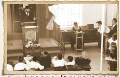
הגאון הגדול ר"נ פרצוביץ זצוק"ל במסירת השיעור כללי הראשון

גדולי התלמידים שליט"א מספרים שטובי הבחורים באותם ימים נמשכו