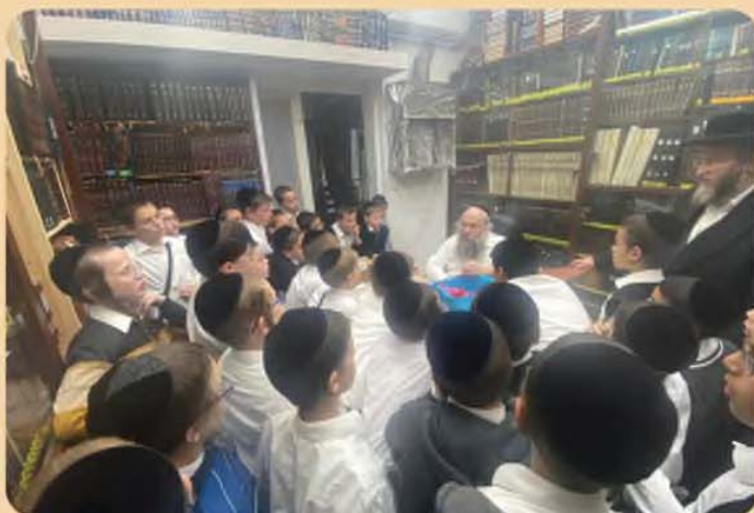
תלמידי ת"ת 'מבקשי תורה' במודיעין עילית נכנסו לבחינה בבית הרב זצוק"ל ע"י בנו הגר"ש קניבסקי שליט"א