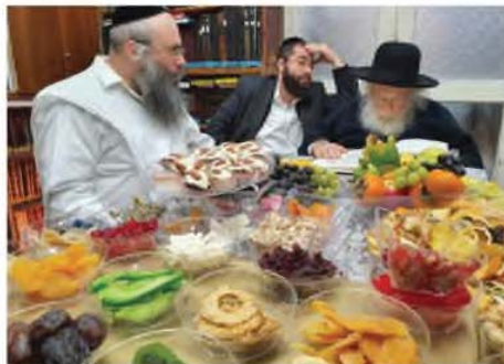
המשך בעמוד 3

'עד מתי אתה מכניס ראשך בין המחלוקת' אחרי רבים להטות. בברכות ל"ז א' תניא ומעשה