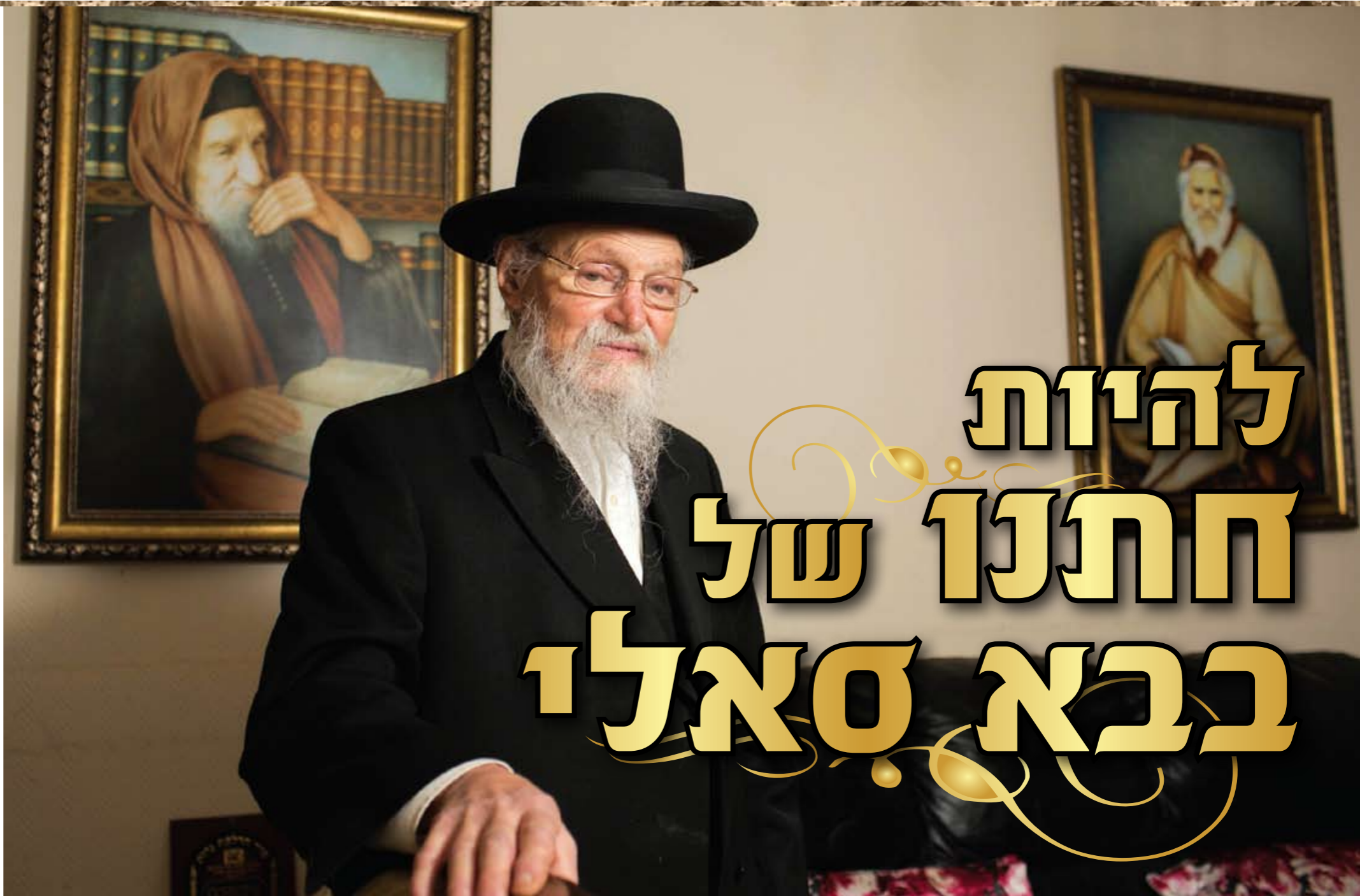
הגה"צ רבי דוד בוסו שליט"א נשיא מוסדות 'מאור ישראל' בשיחתו עמו

משפחתו, ולאחר כמה חודשים התיישב בשכונת בקעה בירושלים, אך אני לא שמעתי הרבה אודותיו, ולא ידעתי אז על גדולתו וקדושתו. בתקופה ההיא התחלתי לשמוע הצעות לשידוכים, ובכל הצעה הייתי דורש לדעת שמדובר במשפחה חרדית וחזקה מבחינה רוחנית. בתחילת שנת תשי"ג פנה אלי אחד מידידי והציע לי את בתו של הרב ישראל אביחצירא. הוא הפליג לדבר בשבחו, וסיפר על גדולתו בתורה וביראה ועל צדקותו וקדושתו, אך אני, כיון שלא הכרתי את משפחת