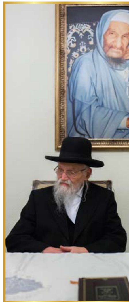
"הושיבו אותי בראשו של שולחן ארוך בסלון הבית...."

לפעמים היה מסכים להכניס אליו את האורחים. אני זוכרת שהיו באים רבנים ואנשים חשובים ומבקשים להיכנס, אמרנו לו שאנחנו מתביישות לסרב לרבנים חשובים ונכבדים, אך הוא סירב לקבלם, והסביר לנו כי כל רצונו הוא לעבוד את ה' בשקט, והאורחים הבאים אליו מונעים זאת ממנו.