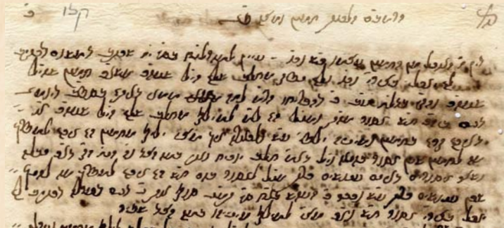
כ"ה הגאון רבי דוד צפג' זצ"ל