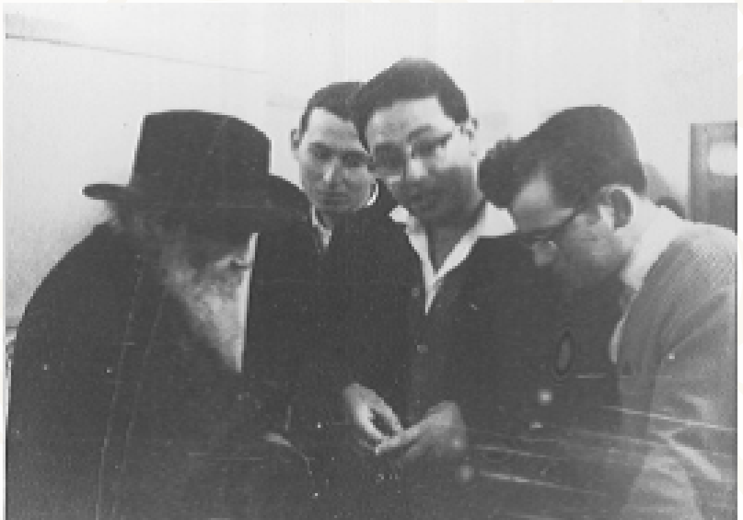
נפולעון חברים. מדבר בלימוד עם תלמידי ישיבות

דר הסמוך, שיבוא לשמוע... ואז הוסיף ר' יענקל, ואני אומר עוד, שבעצם אין ספר שלו, אלא הוא עבר על הראשונים, ובכל מקום שראה "א שטיקל קצות" הכניס לספרו... הוא היה אומר מפני מה ספרי הראשונים דקים ואילו ספרי האחרונים עבים? אלא, שהמוח הוא כמו כלי שמכניסים לתוכו, ומה שלא נכנס כותבים בספרים, הראשונים היו בעלי מוח גדול ולכן לא נשפך הרבה, ומה שאין כן האחרונים... נוהג היה לבטל בחריפות אלו שאמרו דברים לא מובנים ולא נכונים, והיה רגיל לומר באירוניה שבשמים לא יודעים ללמוד. שהרי בכל מקום שהמחברים כותבים "מקום הניחו לי מן השמים להתגדר בו" בדרך כלל הרי זו 'עמרצות' גמורה... פעם ביושבו בכולל חזון איש צדה עינו את מרן הגר"ח קניב סקי זצ"ל שהיה אז אברך צעיר, יושב והוגה בירושלמי. ר' יענקל פנה אליו ואמר לו, נו, תגיד משהו. ר' חיים למד אז נושא סבוך והציע לפניו שאלה. חשב ר' יענקל והציע תשובה חריפה, או אז "הפתיע" אותו ר' חיים שהירושלמי אומר תשובה הפוכה, נענה ר' יענקל, הו! הירושלמי יודע ללמוד!