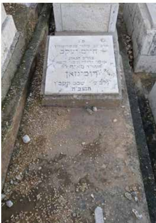
עילוי בכשרונותיו. מצבת קבורתו בהר המנוחות בירושלים