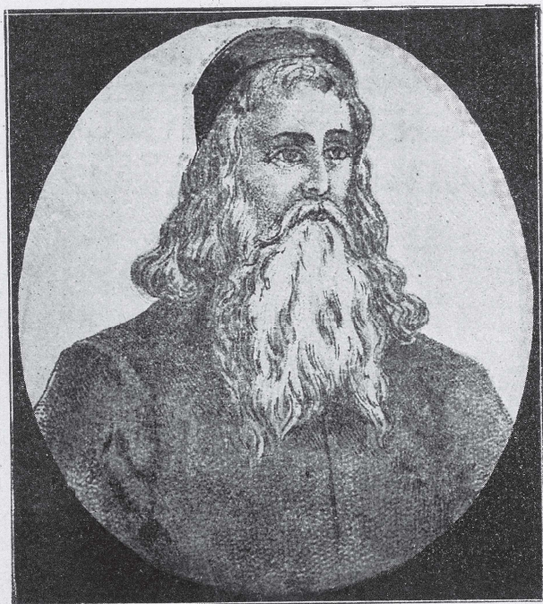
מרן המהרש"א זצ"ל