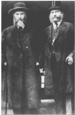
מימין: הגר"א סילבר עם האדמו"ר הרי"צ

בשבת קודש יחול חג הגאולה י"ב תמוז, היום בו ניצל כ"ק אדמו"ר הרי"צ משלטון הרשע של הקומוניסטים כ'עוון' פעילותו בהפצת היהדות ברחבי ברית המועצות, תאריך זה הוא גם יום הולדתו של האדמו"ר הרי"צ.