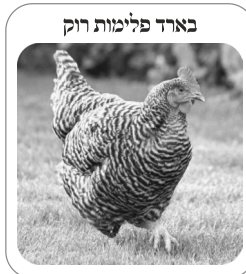
בארד פלימות רוק

(ב) תרגול רוק, אשר שמו המלא הוא פלימות רוק (plymouth rock). וצבעו של התרגול פלימות רוק המקורי הוא מפוספס,