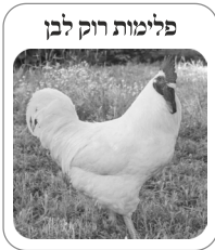
פלימות רוק לבן

(יג) לאחר מספר שנים שהיה מצוי הפלימוט רוק המפוספס, הציגו גויי הארצות עוף פלימוט רוק לבן (white plymouth rock).