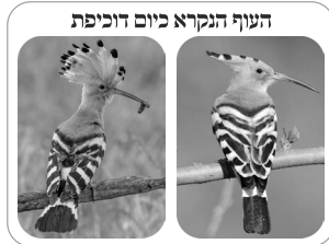
העוף הנקרא כיום דוכיפת

וזו היא כרבלתו, הרי מפורש בדברי רש"י פעמיים שיש לו כרבלת, וגם הוסיף שהיא כפולה וכפותה, ורש"י ביאר דבר זה יותר בהרחבה בחולין (גו.) "שכרבלתו עבה ודומה כמי שכפולה לתוך הראש וכפותה שם", ואילו העוף הנקרא בלשונינו דוכיפת אין לו כלל כרבלת (ראה תמונה), אלא רק נוצות, וגם אין שם עובי הכרבלת, וכל שכן שאינה נראית כפולה אל הראש וקשורה שם. ומה שכתב הרב שכרבלתו של הדוכיפת נפתחת ונסגרת, הנה מלבד שאין זו כרבלת, בנוסף הרי לא כתב