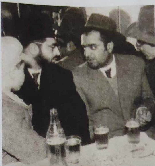
מחלוקת לשם שמים. עם מרן הגר"ע יוסף קא"ל בצעירותם

"אני רואה סביבי הרבה אברכים צעירים שדרוכים מאוד על התורה, אכפת להם מאוד מכל התקדמות, ולא אכפת להם כל מדברי הבאי ופוליטיקה. הם גדלים נכון, הם יצליחו - כי כך בדיוק צעדו רבותינו!" ■