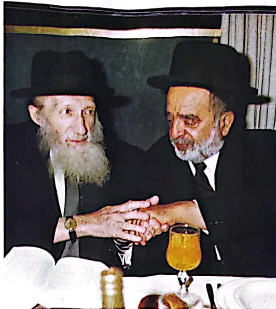
למדרות שמתכנסות לכל האסכולות. בצוותא עם שכנו מרן הגר"פ שיינברג, ראש ישיבת תורה אור

בקודים הפנימיים של רב־תלמידיו כונתה צורת הלימוד הזאת 'עיון מבעית'. הקליקה הפנימית של המובחרים שבהם פרשה מכל עיסוקיה והתמסרה לאותו עיון. חבורות-חבורות התאגדו בפינות שונות בירושלים, חלק מהן ככוללים מאורגנים