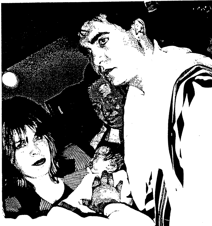
צילום אילוסטרציה. אין קשר בין המצולמים לכתבה. בתמונה: משפחת ברהום

לדבריו, מוהלים נדרשים לערוך בד ואף לקבל חיסונים שונים כעניין שבי על ידי ועדת הפיקוח על המוהלים מ משרד הבריאות, בדיוק כפי שהבד הללו נדרשות מכל רופא או אדם ה שירות רפואי. יעל שחר