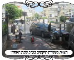
הצוות בעשית תיקונים בערב שבת האחרון

בשעה שהיה חשש שהרכב ישאר כך לשבת, חיפשנו פתרון הלכתי, כי לא ניתן להעמיד שם לחי כלל במצב הזה, שהרכב תקוע בחור שבקיר. והנה נראה לעומד שאפשר להעמיד את הלחי מאחורי הקיר בתוך החצר, ואע"פ שאם מעמיד את העמוד בתוך חצר שמוקפת במחיצות פסול כמ"ש המשנ"ב (סי' שס"ג ס"ק ק"א), מ"מ מבואר בחזו"א שאם במקום שתחת החוט יש פירצה במחיצה, אין נפסל הצוה"פ, אלא כאילו הרחוב והחצר הם מקום אחד, כי במקום הפתח הם אחד. אמנם לכאורה אינו דומה למקרה זה, כיון שכאשר הרכב תקוע, הרי הוא סותם את החור, ושוב יש כאן מחיצה. י"ל שכיון שהרכב יסולק משם אחרי שבת, הרי הוא דבר זמני, וק"ל שמחיצה זמנית אינה פוסלת, א"כ