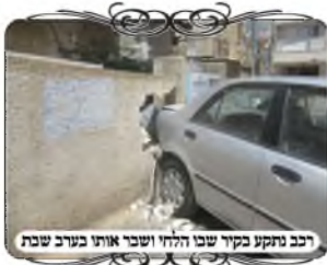
רכב נתקע בקיר שבו הלחי ושיבר אותו בערב שבת

במקרה זה רכב נכנס בטעות בקיר של אחת החצרות, ושיבר את הקיר, אבל בדיוק במקום הזה עמד הלחי של העירוב השכונתי, והלחי כמובן נהרס ונפל לגמרי. המתקשרים היו מודאגים אם יהיה אפשרות לתקן כזה דבר, אבל בס"ד כיום בעזרת הכלים והאמצעים ניתן לעשות דברים גדולים. הגענו למקום, אבל לא היה שייך לתקן, כי הרכב נשאר תקוע במקום התאונה בקיר, והנהג פונה משם לביה"ח, ולא ניתן להעמיד שם לחי חדש. בשיתוף עם התושבים עמדנו בקשר לשמוע סמוך לשבת האם יזיזו את הרכב, לאחר מכן חזר בעל הרכב בשלום ב"ה, ואחד מהבודקים הגיע למקום וביקש להזיז את הרכב, והודיע לנו שאפשר לבוא לתקן, ובס"ד עשינו תיקון חדש עם לחי מברזל, עומד על החור ותפוס לשני הצדדים. במקרה זה לא היינו צריכים להשלים את הקיר, כיון שהלחי יוצא סמוך תוך ג' טפחים לשארית הקיר, וע"ז נחשב כסתום וממשיך את מחיצות העירוב.