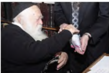
רבינו משלש כסף במעטפת צדקה

ורח"ע לא ענה לו במפורש על השאלה, רק השיב לו בסיפור, וכך אמר לו: מלפנים כשהייתי רב בעיירה 'איוויא', הייתי מקדים שלום לכל אחד מהתושבים. לימים נעשיתי רב בעיר הגדולה וילנא, וראיתי שאם אומר שלום לכל אחד, אין לדבר סוף ולכן הפסקתי!.