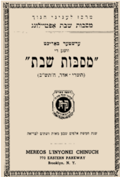
דו"ח ראשון על מסיבות שבת. כאן הנוחן היסודות לזכור חובתך ועוד

בהמשך אימו של הילד שואלת אותו: "אתה רוצה לדעת כיצד תהיה בטוח שלעולם לא תשכח להראות לקב"ה כמה אתה אסיר תודה על מה שנתן לך בחסדו? האם אתה רוצה להיות בטוח שאתה אומר את הברכה הנכונה כשאתה אוכל?" "איך אני יכול להיות בטוח, אימא?" שואל הילד.