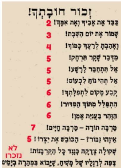
זכור חובתך! מתוך סבו"ת. המספרים מציינים את סדר הופעתם בחוברת 'ערשטער באריכט'

ומסבירים להם את חשיבות [7] לימוד התורה. המספרים באריחים מרובעים נוספו לחדד את סדר הנושאים, וראו צילום של 'זכור חובתך' בעמוד זה – המספרים באדום הם הסדר המופיע בקטע הקודם.