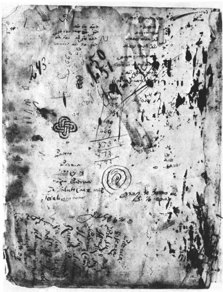
כתב יד בית המדרש לרבנים, ניריורק, Mic. 1615: רשימות ושרטוטים קבלים של משה חיים לוצאטו מימי נעורו