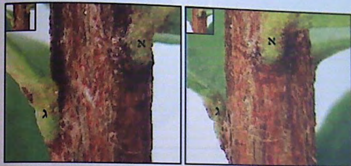
487. עלה ג' משמאל, עלה א' מימין.