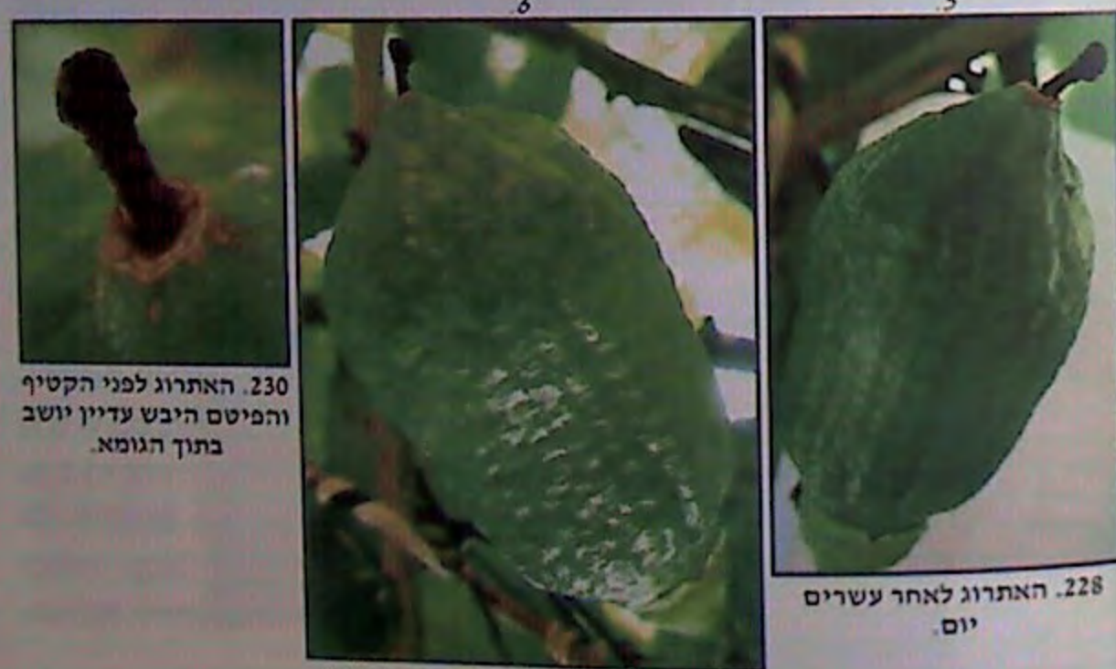
228. האתרוג לאחר עשרים יום.