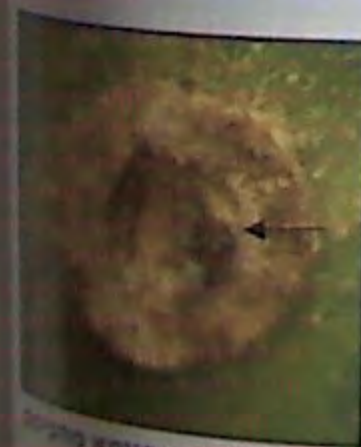
222. הפיטם במבט מן הצד. 223. כתם שחור בגומא מחמת