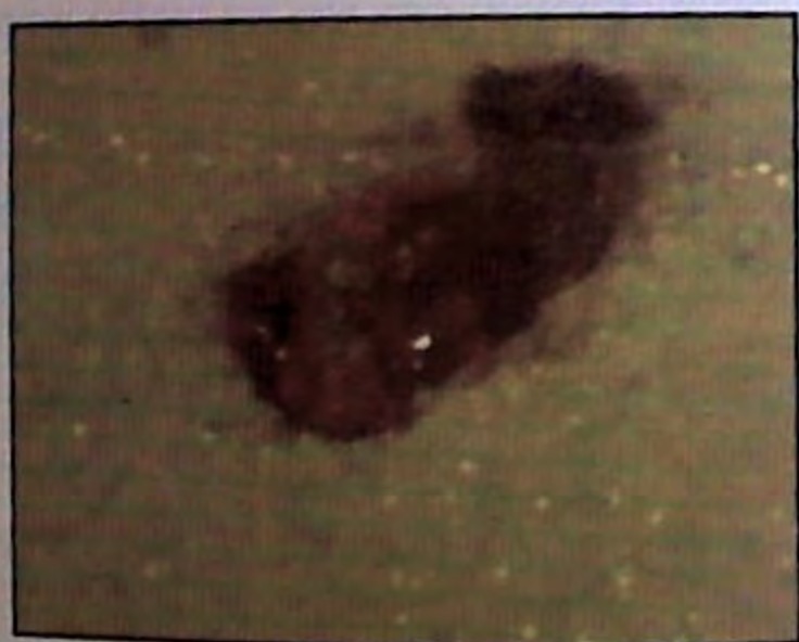
393. פטריה מקרוב בחיתוך רוחבי.