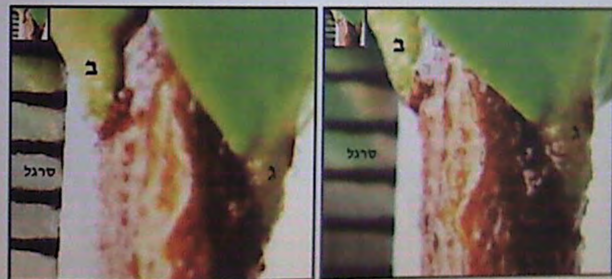
489. עלה ב' משמאל, עלה ג' מימין, בצד סרגל.