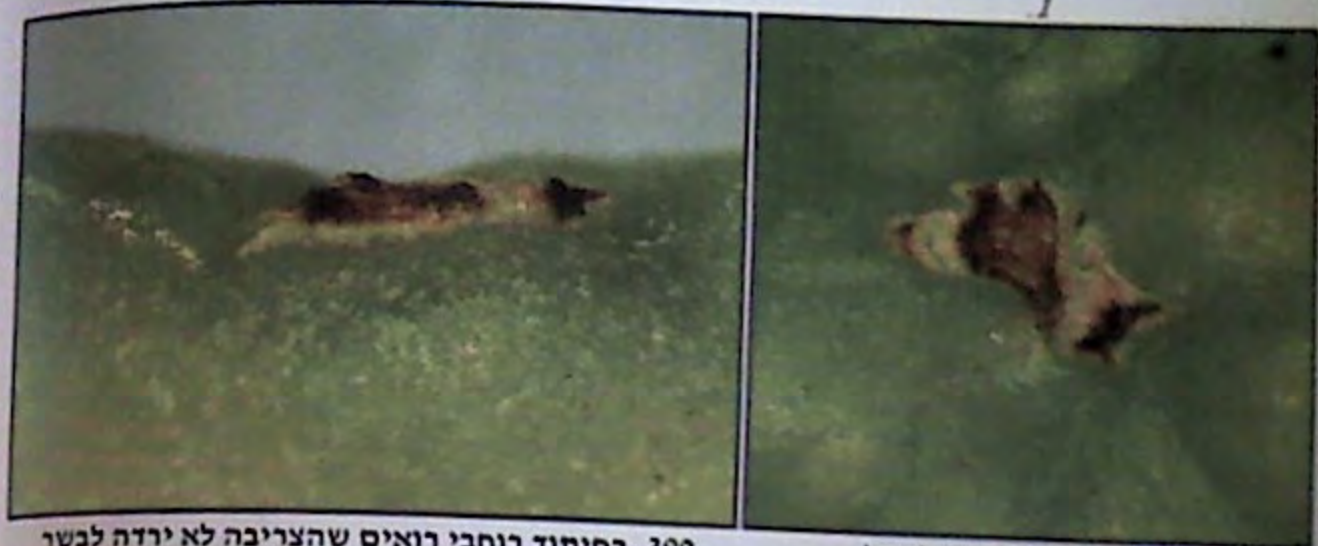
389. צריבה על גבי בלעטל.