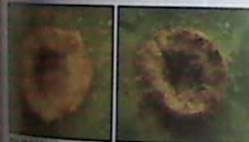
220. כך נראות הגומות לאחר שהפיטם היבש ננגיעה קלה.