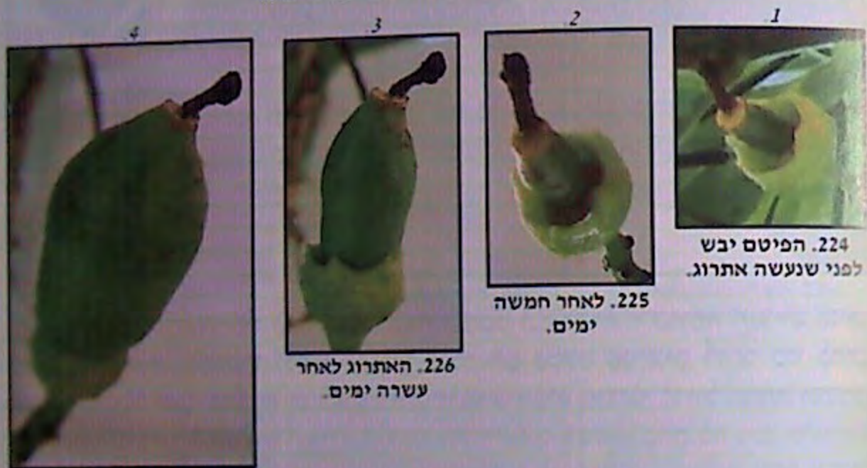
224. הפיטם יבש לפני שנעשה אתרוג.

המחשה של תהליך פיטם שנתייבש בשלב הראשוני, והאתרוג מתפתח סביבו, ונוצר גומא, והפיטם שקוע בחוד הגומא עד הקטיף, ובנגיעה קלה יפול: