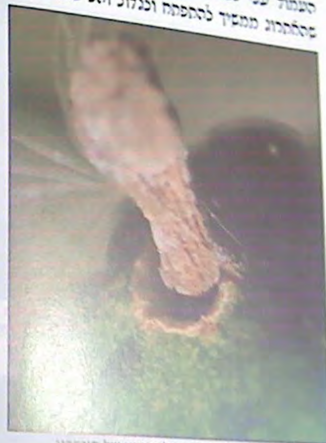
216. פיטם יבש תלוי מעל הגומא של האתרוג.

העמוד שלי לפני שהתפתח לפרי. ב. אין היקף עובי הפיטם כהיקף הגומא מחמת שהתרוג ממשיך להתפתח ולגדול והפיטם היבש לא גדל איתו ונשאר בגודלו הראשוני.