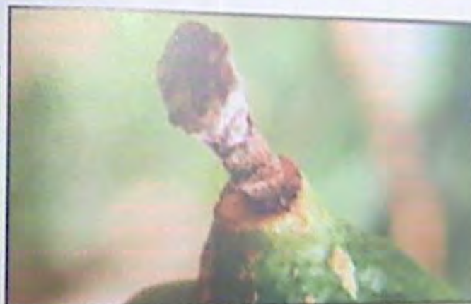
217. פיטם יבש תלוי מעל הגומא של האתרוג.