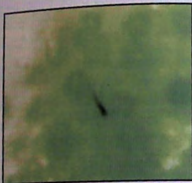
392. דמוי ראש קוז, והינו פטריה.

נקודה שחורה. אך בבדיקות שנערכו החברר שזה פטריה שחדרה בעד חוד קטן בגליל ואין זה חוד של קוז ושפיר הוי מגופו של אתרוג, אך על כל פנים הוא קטן מדי בכדי להיחשב ניכר בהסקפה ראשונה, ולכן אין בו דין מראה פסול, אמנם מדון הסר חולי יש לחשוש משום שהוא רקוב שם.