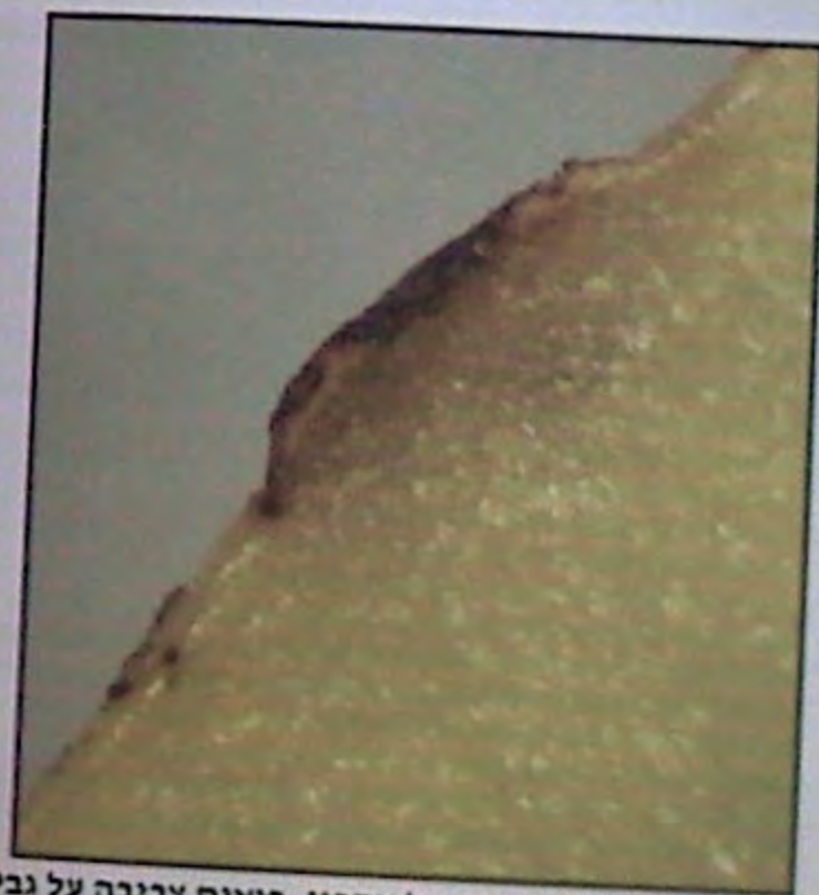
391. חתך רוחבי של אתרוג, רואים צריבה על גבי הגליד שלא ירדה לתוך הבשר.

הדרך המומלצת להבחין האם יש עומק לנקודה הוא להתבונן בלד הנקודה באור טון ולראות בזוכית מגדלת האם נראה שיש המשך תחת הגליד. אבל לא תמיד מלמדים לראות, בפרט באתרוגים ירוקים כהים ויש להתבונן בסבלנות.