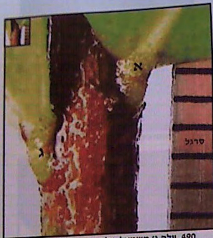
490. עלה ג' משמאל, עלה א' מימין, בצד סרגל.