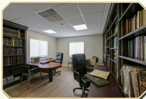
♦ בית המדרש של המכון

דומה כי חובת ההתבוננות מוסכמת על הכל, כי בלעדיה לא תיכון עבודת הימים כלל (וכד' הרמב"ם הנודעים הל' תשובה פ"ג ה"ד לגבי מצות תקיעת שופר), אולם מתוך עיון בתפילות שתקנו לנו לימים הנוראים נראה בעליל כי כח המחשבה, ההתבוננות, וההעמקה - כיסוד למעשי איש - הם עיקרו ועיצומו של יום, כי כל מהות היום וקביעותו נבנה על כח המחשבה, שהרי סוף מעשה במחשבה תחילה.