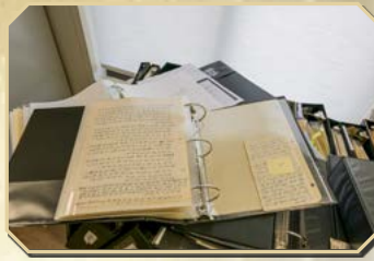
♦ ארכיון - כתבי הגריח"ש