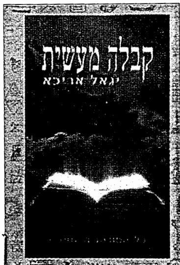
קבלה מעשית: עומק המצוקה האנושית

מאגיה, ספרות מאגית ותפיסות עולם הקשורות ללחשים, להשבעות ולקללות וקשרים עם כוחות נסתרים, היו קיימות מאז ומעולם בחברה היהודית והלא-יהודית כאחד. מציאותה של המחשבה המאגית לאורך ההיסטוריה מקנה לה מעמד של חשיבות ומקום רב עניין בתולדות התרבות, בחקר ההיסטוריה והאמונה העממית, במערכות פרשנות ובהבנת התודעה האנושית, המגדירה עצמה מחדש ביחס לכוחות גלויים ונסתרים. אבל אין היא מקנה לה שום תוקף, וראות והשפעה אוניקטיביים, גם אם ספרים