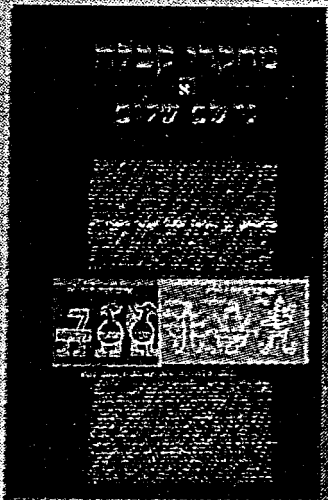
מחקרי קבלה גרשם שלום, סמלים, רעיונות

במאמריו ארג שלום את הרשת, שהפכה את הקבלה מגילוי אקטצנטרי נשכח לתופעה מרכזית בהיסטוריה האינטלקטואלית היהודית, מהלך שפירוטו ראו אור בספריו, החל ב'MAJOR TRENDS IN JEWISH MYSTICISM' (שוקן, 1941) וכלה בהוצאות, שחלקן מצוי בעברית כ'פרקי יסוד בהבנת הקבלה וסמליה' (מוסד ביאליק, תשל"ד). המאמץ המחקרי במאמרים מורכבים אלה הוא דו כיווני: חלקו מופנה לבירור מירב הפרטים המסתתרים בכתבי יד ובדפוסים נדירים, והשני לבירור משמעות הנאמר במסורות חזיתיות אלה ולכינון מיסגרת מושגית מבארת, שמעניקה לריון פחד ומשמעות.