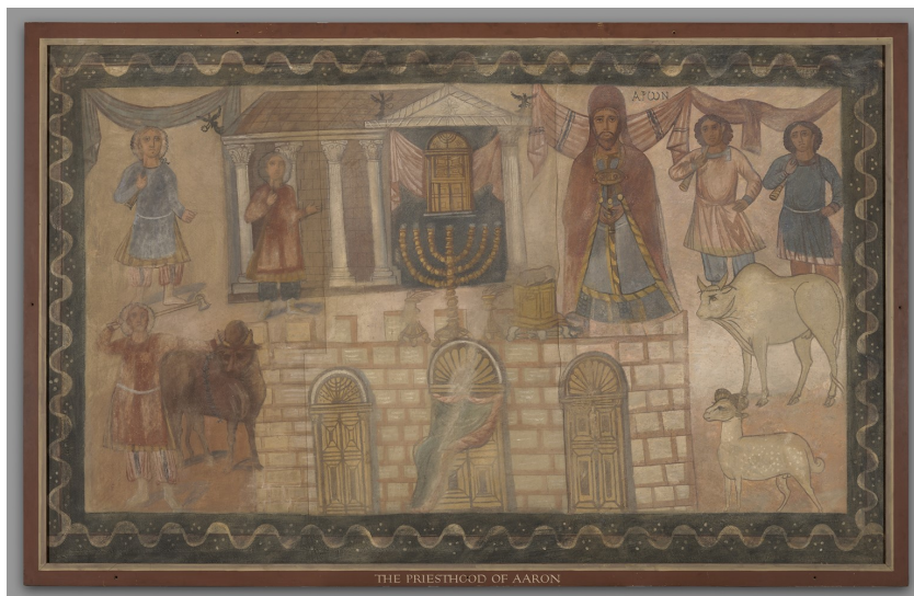
תמונה 1: בית המקדש הבנוי (המוקף חומה אחת) ועבודתו