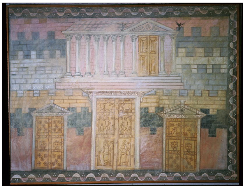
תמונה 2: בית המקדש שלעתיד לבוא, המוקף בשבע חומות (כל אחת בצבע שונה)