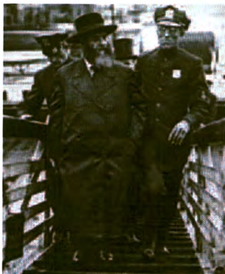
רבי יוסף-יצחק יורד מהאונייה בעת ביקורו בארצות הברית בשנת תרפ"ט, 1929. כמי שהתייצב נגד המשטר הקומוניסטי בברית המועצות התקבל בארצות הברית בכבוד רב, ואף הוזמן לפגישה עם הנשיא הרברט הובר