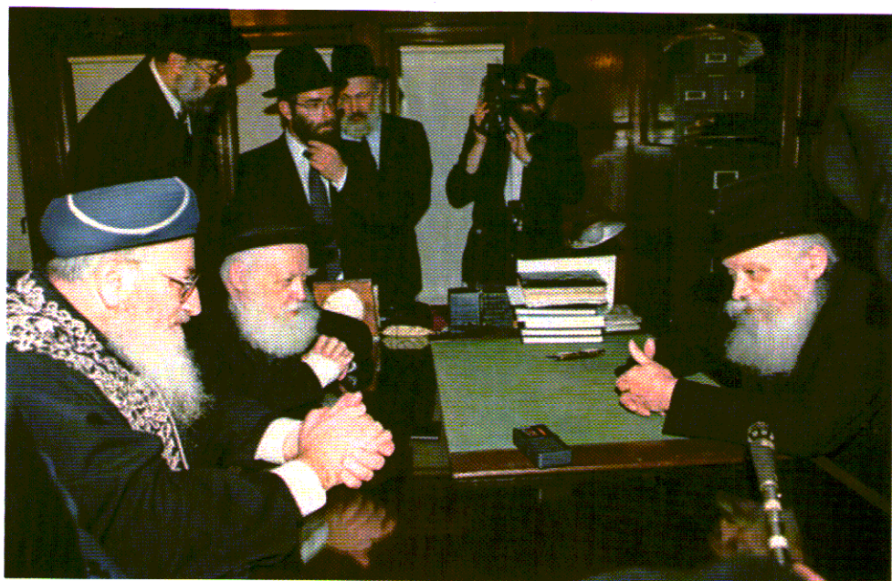
הרבנים הראשיים, מרדכי אליהו ואברהם שפירא, מבקרים אצל הרבי. לרב אליהו היה קשר חזק במיוחד עם הרבי