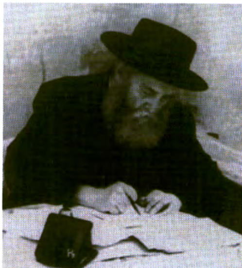
תחת הפגזות כבודות בוורשה ישב רבי יוסף-יצחק וכתב. אפיינה אותו יכולת להתמקד בעיקר ולהסיט את הדעת מהקשיים ומההפרעות