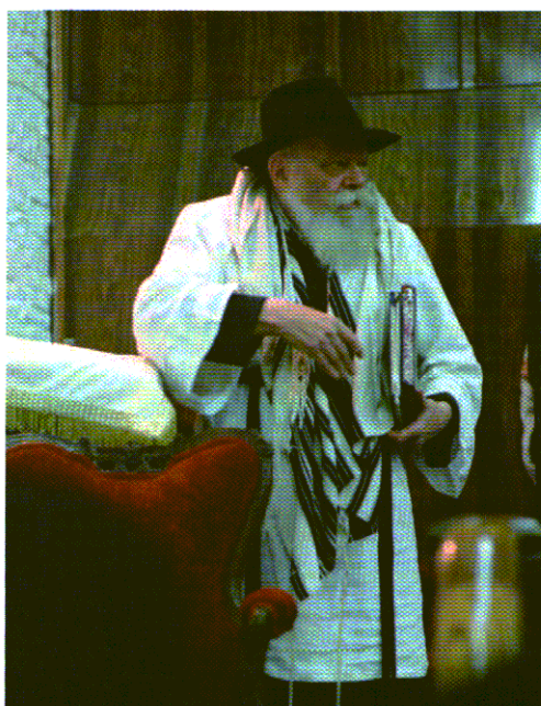
במוצאי יום הכיפורים, לבוש ב'קיטל' הלבן

הרבי הרבה לבקר ב'ציון' חותנו, בבית העלמין מונטיפיורי שבקרוינס. הוא היה עומד שם, בחורף ובקיץ, בגשם ובחום, מתפלל וקורא את הבקשות שהופנו אליו