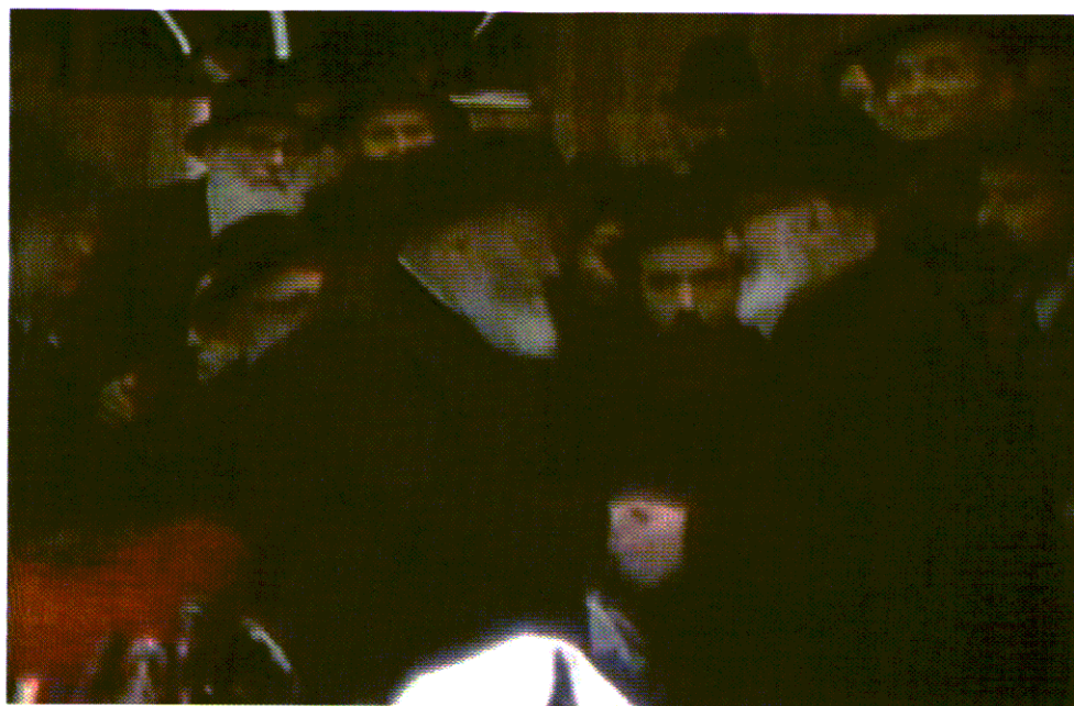
הרב יוסף-דוב הלוי סלובייצ'יק הכיר את הרבי עוד מהימים שבהם למדו יחד בברלין. בשנת תש"ם, 1980, בא להשתתף בהתוועדות לרגל שלושים שנות נשיאותו של הרבי