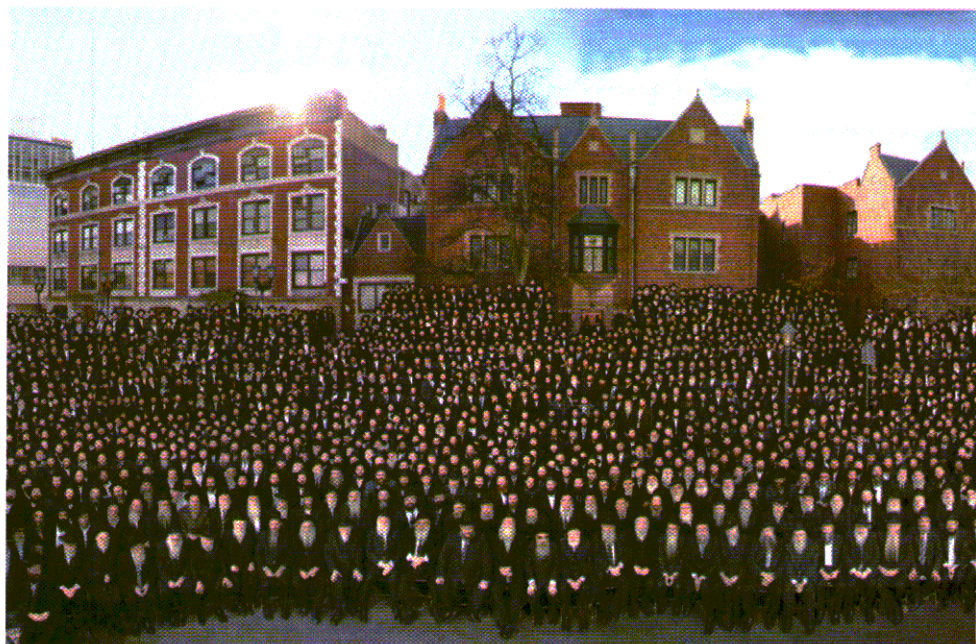
צבא השלוחים מכל קצווי תבל מתקבץ אחת לשנה במרכז חב"ד העולמי. התמונה המסורתית על רקע בניין 770

במהלך התפילה, הרבי כמעט לא זע, לא התנועע בחדות, לא הניף ידיו, לא זעק לשמים. נראה היה עומד ביראה במקומו