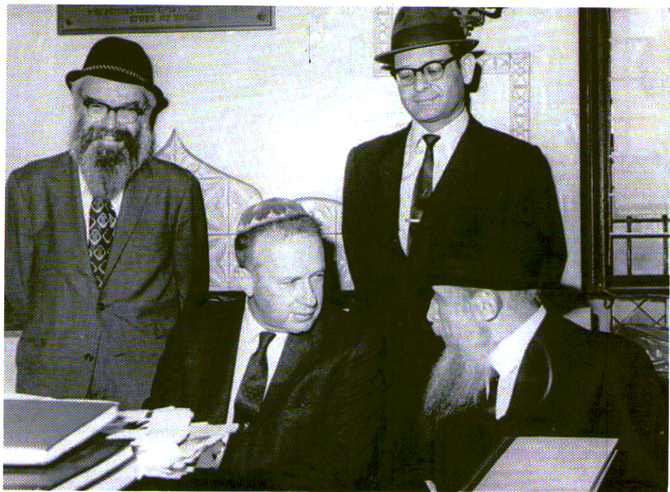
בתחילת שנות השבעים, בעת ששימש שגריר ישראל באו"ם, בא יצחק רבין לברך את הרבי לרגל יום הולדתו. הם נועדו לפגישה ארוכה. כאן הוא נראה לצד מזכירו של הרבי לפני הפגישה