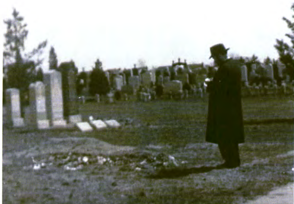
הרבי משתטח על ה'ציון' (הקבר) של חותנו, קודם שנבנה במקום ה'אוהל'

חסידים נוהגים לכתוב פתק בקשות המכונה 'פדיון נפש' ולהניחו ליד המצבה. לפנינו צילום מ'פדיון נפש' שכתב הרבי על עצמו, עוד בטרם קיבל עליו את ההנהגה: "אנא לעורר רחמים רבים ממקור הרחמים והסליחות