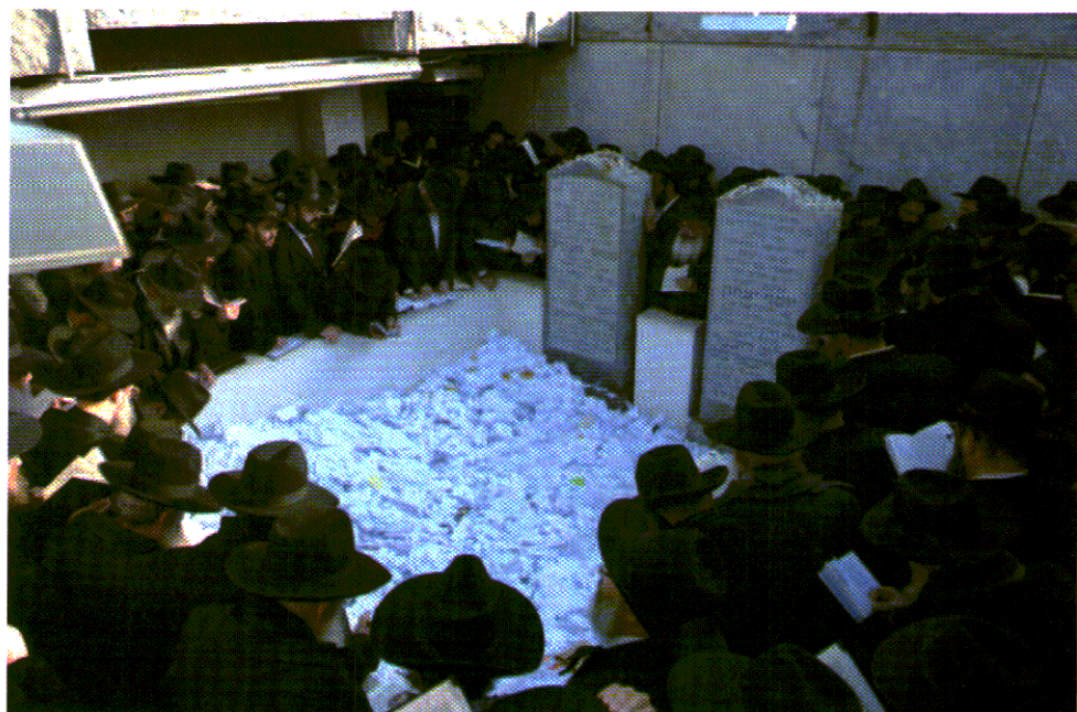
ציונו של הרבי שוכן בצמוד לזה של חותנו. המקום הפך אתר עלייה לרגל. המונים באים לשם לבקש את שחפץ לבם. את פתקי הבקשות קורעים ומשאירים ליד המצבות

רבים עולים להתפלל ולבקש רחמים גם על קברה של אשת הרבי, חיה-מושקא