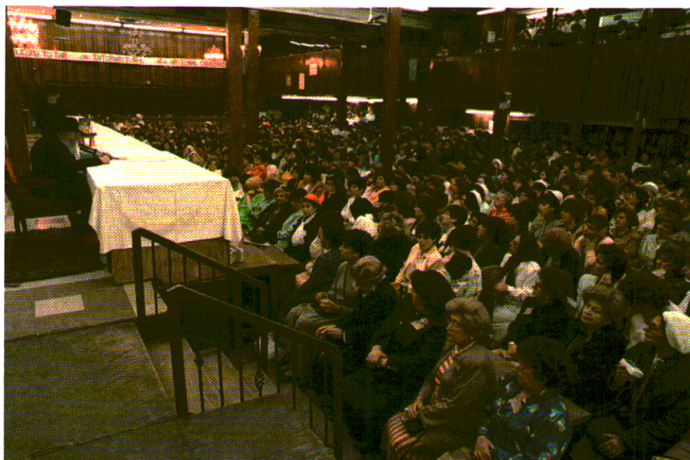
הרבי קיבל נשים לפגישות ודחף אותן לפעילות ולשליחות. כמה פעמים בשנה היה אולם בית המדרש מתרוקן מגברים והרבי היה נושא דברים לפני הנשים

בערב יום הכיפורים ובערב שמיני עצרת היה הרבי מחלק לאלפים פרוסה של עוגת דבש, כסימן לשנה טובה