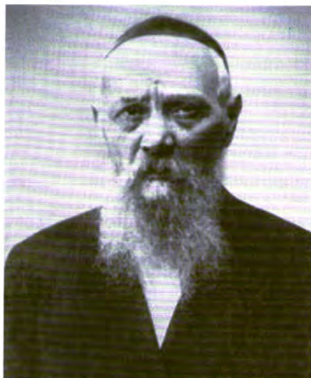
אביו של מנחם-מענדל, לוי-יצחק שניאורסון, איש קבלה מובהק ורב העיר יקטרינוסלב. לוי-יצחק נאסר בידי המשטר הקומוניסטי והוגלה לקזחסטן, שם נפטר בשנת תש"ד, 1944

מנחם-מענדל יצא מגניו יורק לפריז כדי לפגוש את אמו ולהסדיר את נסיעתה לארצות הברית