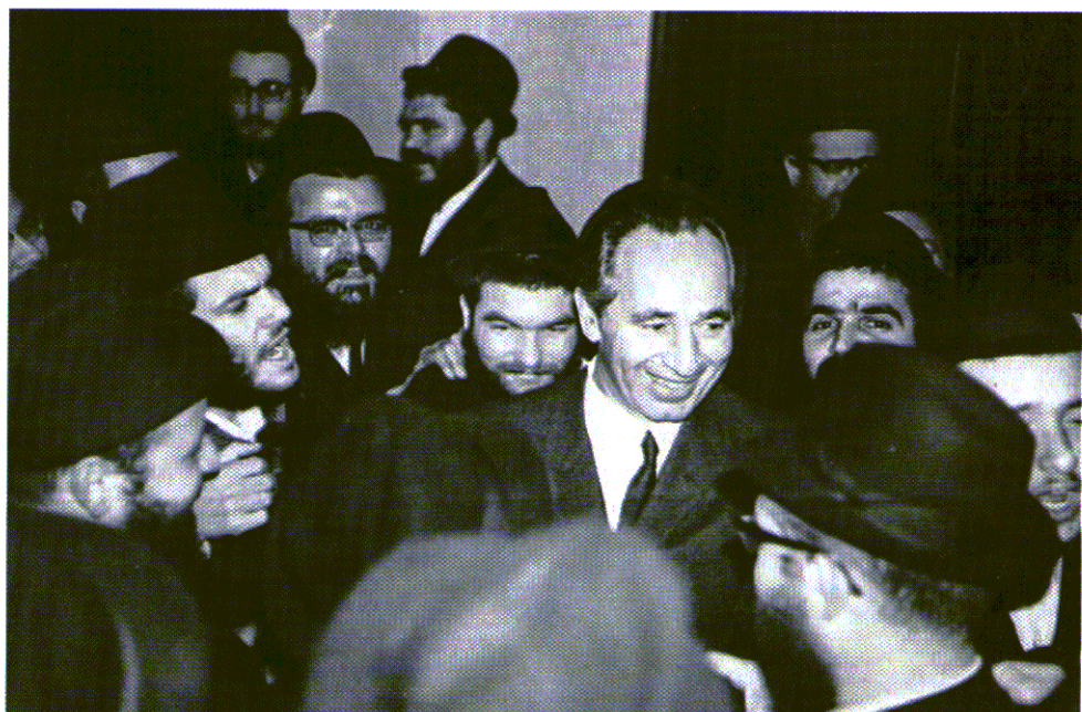
החסידים מקיפים את שמעון פרס בצאתו מפגישה ביחידות עם הרבי