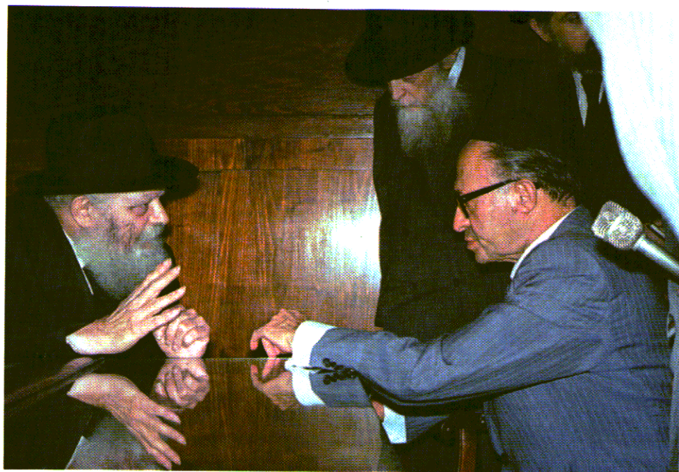
בביקורו הראשון של מנחם בגין בארצות הברית, בהיותו ראש ממשלת ישראל, ביקר אצל הרבי ונועד עמו ביחידות לשיחה ארוכה

פוליטיקאים אמריקנים, יהודים ולא יהודים, היו באים אל הרבי. הרבי קרא להם לקדם את האמונה בבורא עולם ולפעול לתקון החברה. כאן נראה רוברט קנדי, שהיה התובע הכללי של ארצות הברית ולימים שר המשפטים