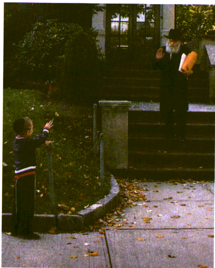
ביתו של הרבי ברחוב פרזידנט 1304 היה מחוץ לתחום בעבור החסידים. אך ילדים היו מחכים לפעמים ליד הבית