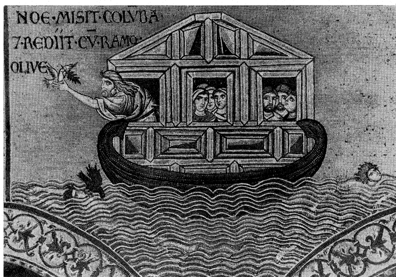
מעשה התיבה: כי העוף אויב הלז פגרים צפים מצא (עמ' 189) (פסיפס בקתדרלה של מונריאל מן המאה ה-12)