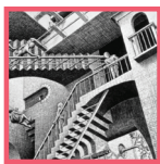
מקורות יודעי דבר