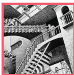
מקורות יודעי דבר

זהו לקט מצומצם מבין הנושאים שעסק בהם. מלבד היותו צוהר לעולם שהיה ואיננו - הוא מסוגל לסייע במאבק המתמשך בשינה ובשגרה הנוחה והמתעתעת, להעיר ולעורר, להרהר ולערער. כל זאת מתוך בקשת אלוהים, עמידה בתפילה, דרישת התורה והעפלה אל העולמות העליונים.