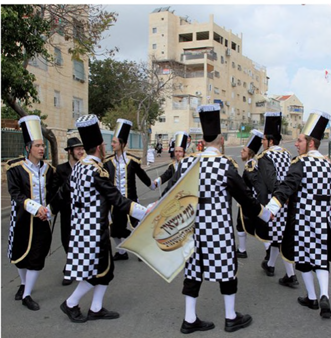
תלמידי ישיבות חוגגים את חג הפורים בריקוד ברחובה של עיר