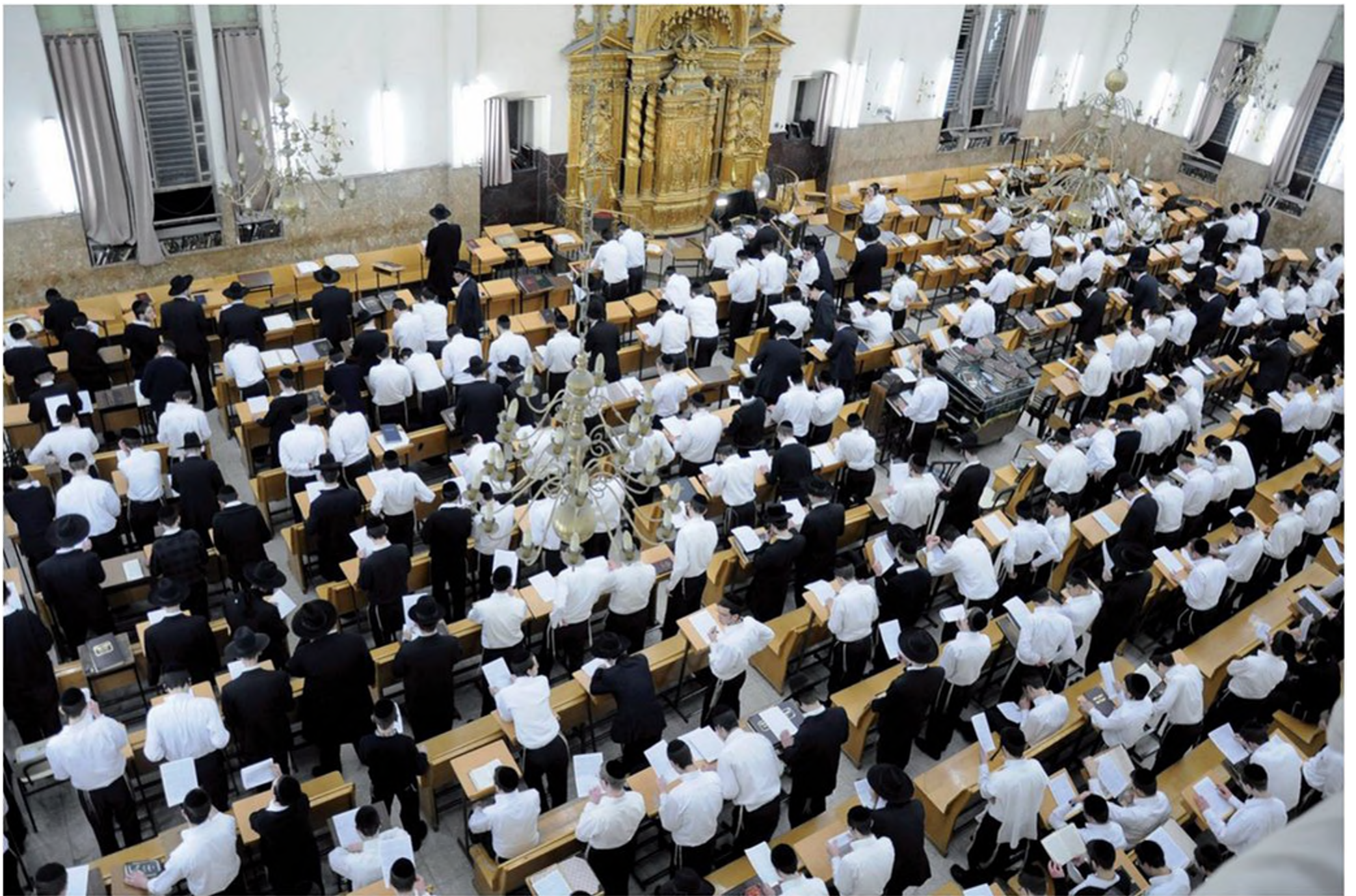
היכל ישיבת פוניבז' בבני ברק. ברקע ארון הקודש הייחודי – סמל ההיכר של הישיבה