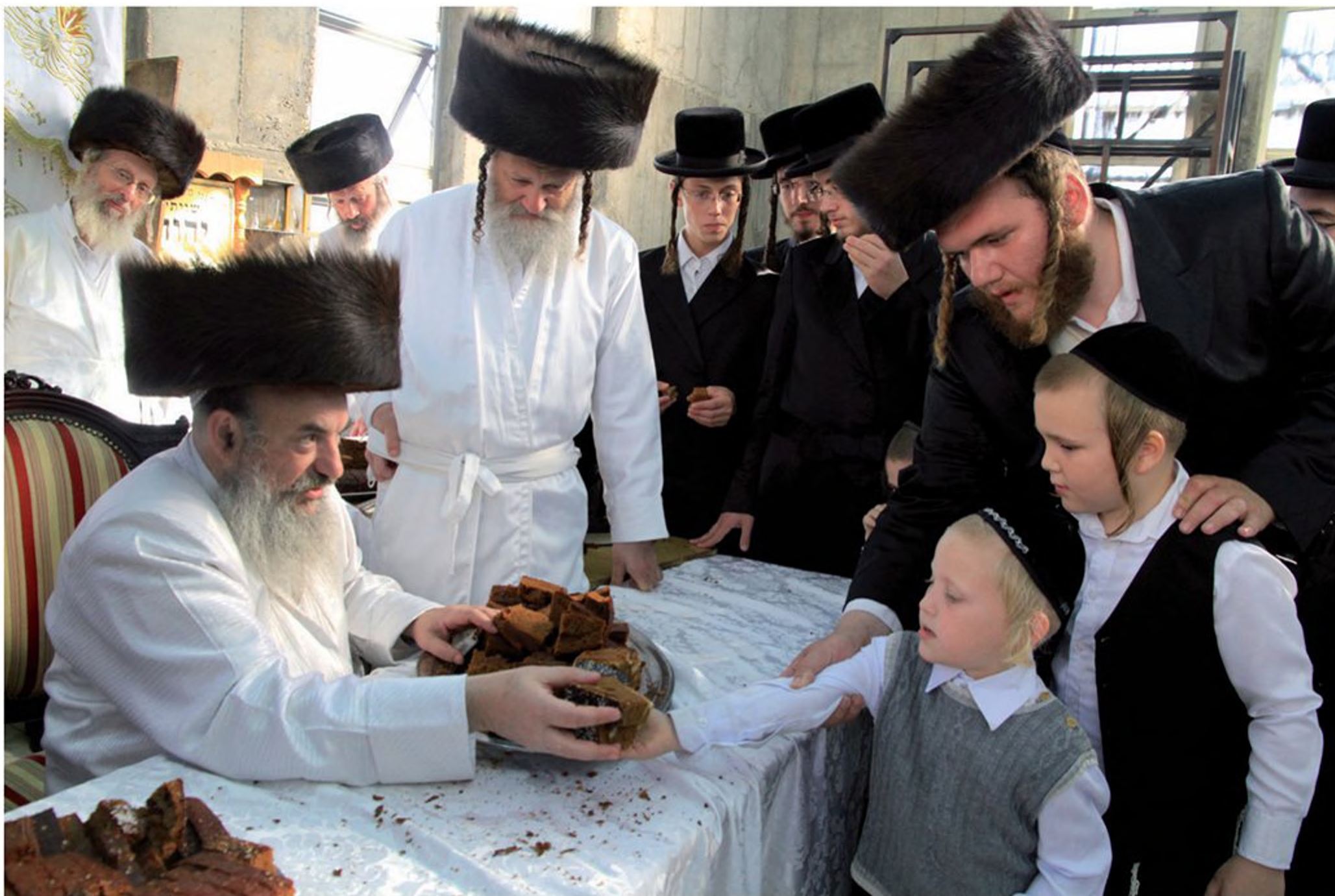
הרבי מלעלוב מחלק עוגה לחסידיו