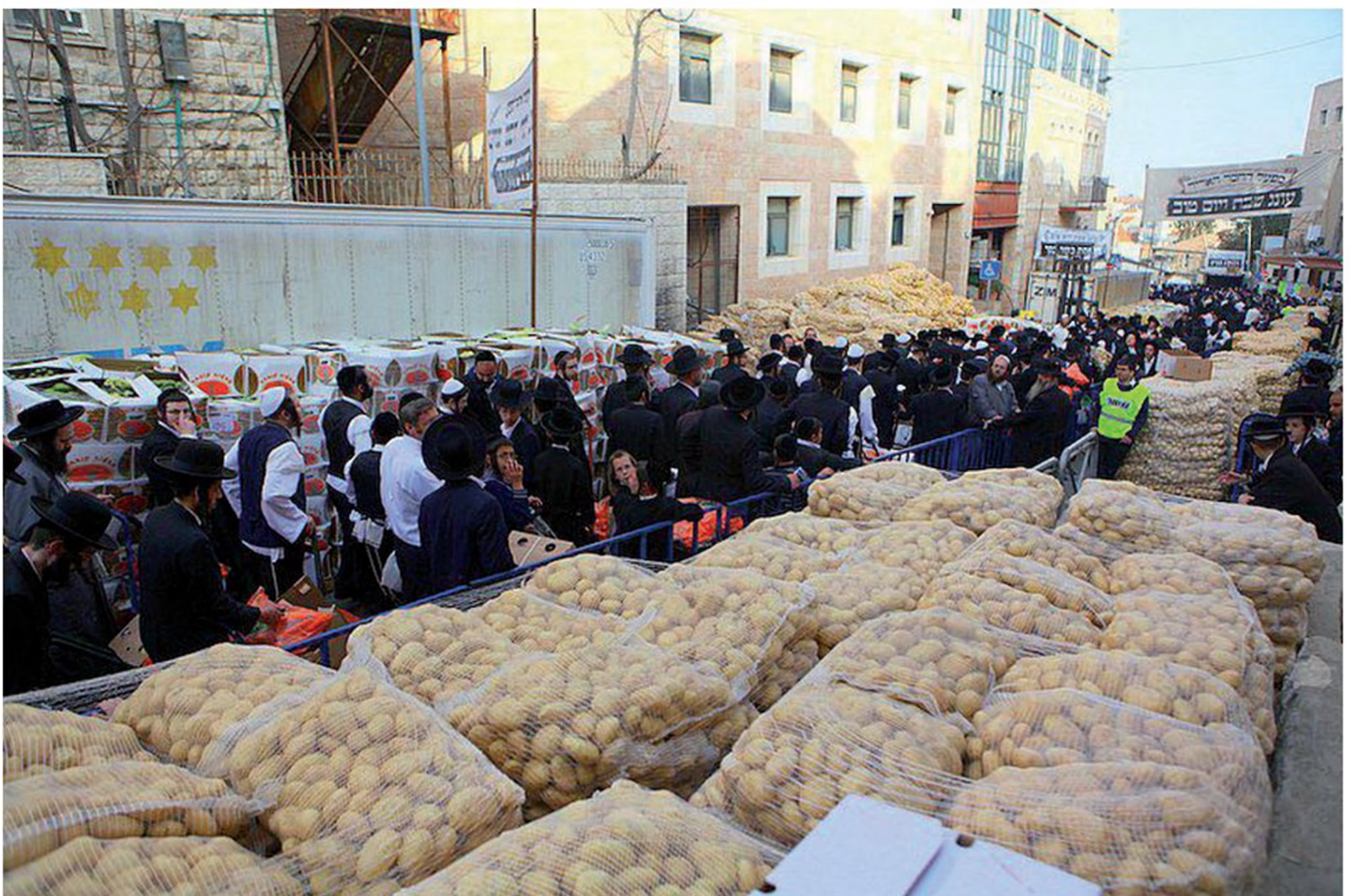
קמחא דפסחא. מכירה מרוכזת של מוצרי מזון מוזלים לקראת חג הפסח