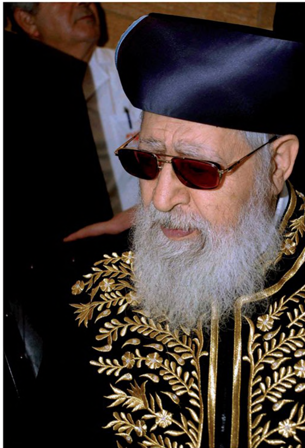
הרב עובדיה יוסף, לבוש בבגדי הראשון לציון

מועצת חכמי התורה של ש"ס מתכנסת לאחר פטירתו של הרב עובדיה יוסף. יושבים (מימין לשמאל): הרב משה מאיה, הרב שמעון בעדני, הרב שלום כהן והרב דוד יוסף