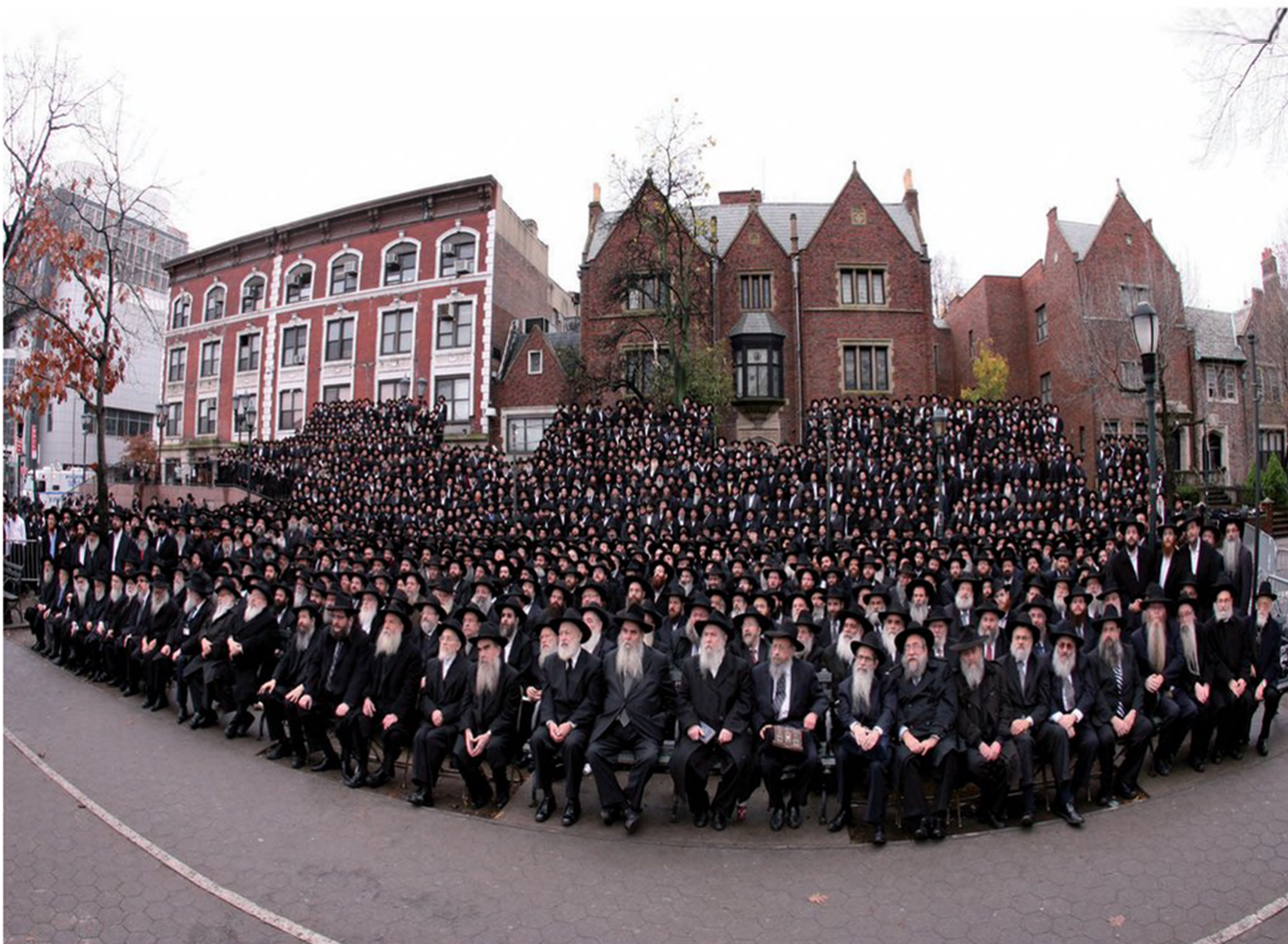
תמונת מחזור של שלוחי חב"ד בכנס השלוחים העולמי