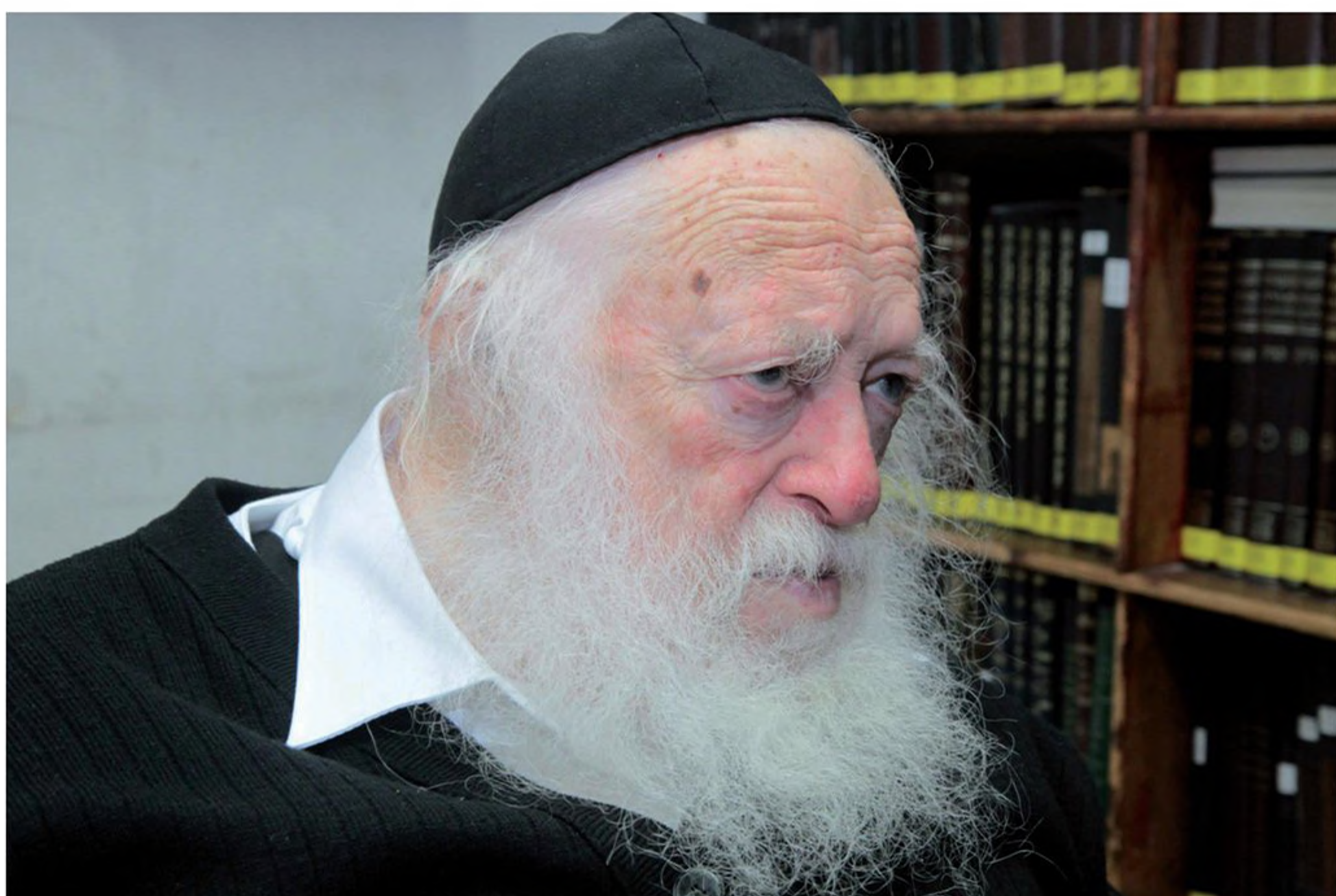
הרב חיים קנייבסקי בביתו