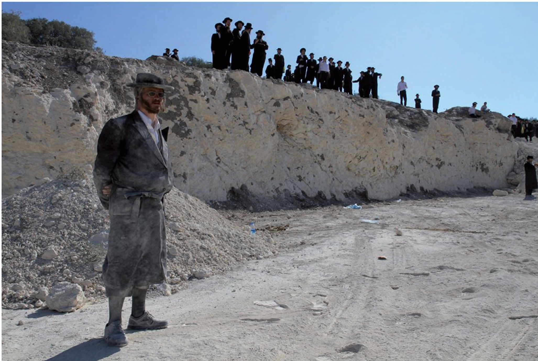
אנשי "אתרא קדישא" מפגינים נגד חילולי קברים באתר בנייה