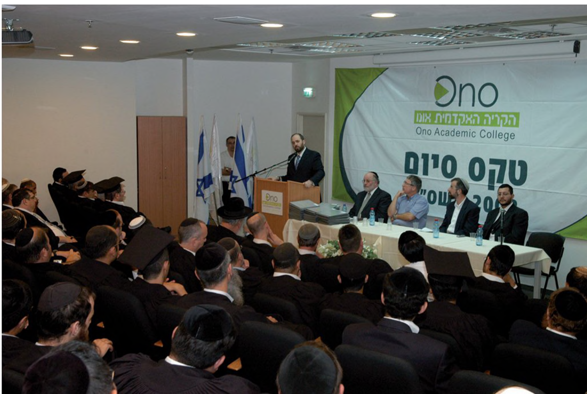
טקס סיום הלימודים בקמפוס החרדי, הקריה האקדמית אונו