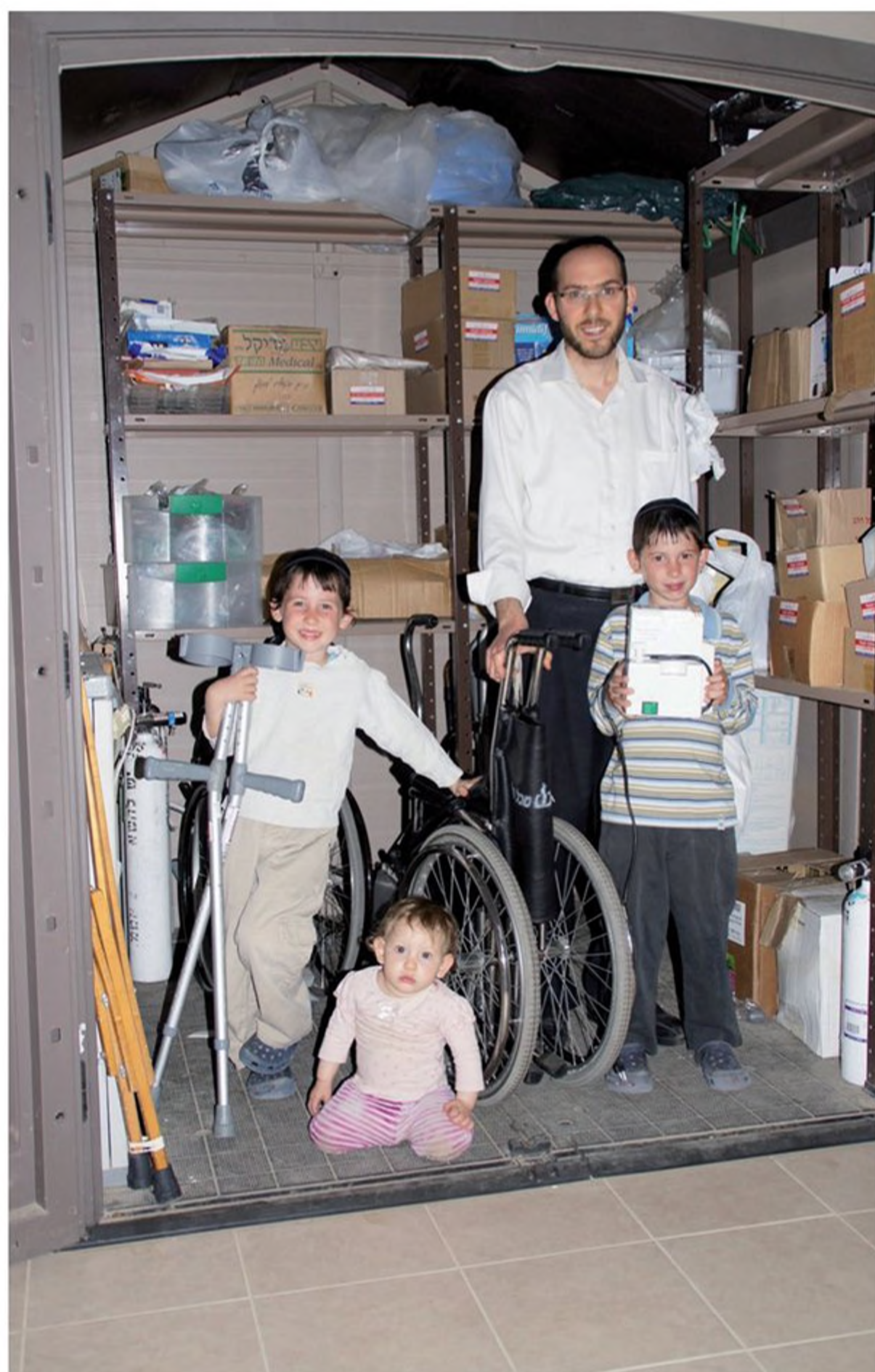
גמ"ח ביתי להשאלת ציוד רפואי בשיתוף עם ארגון יד שרה