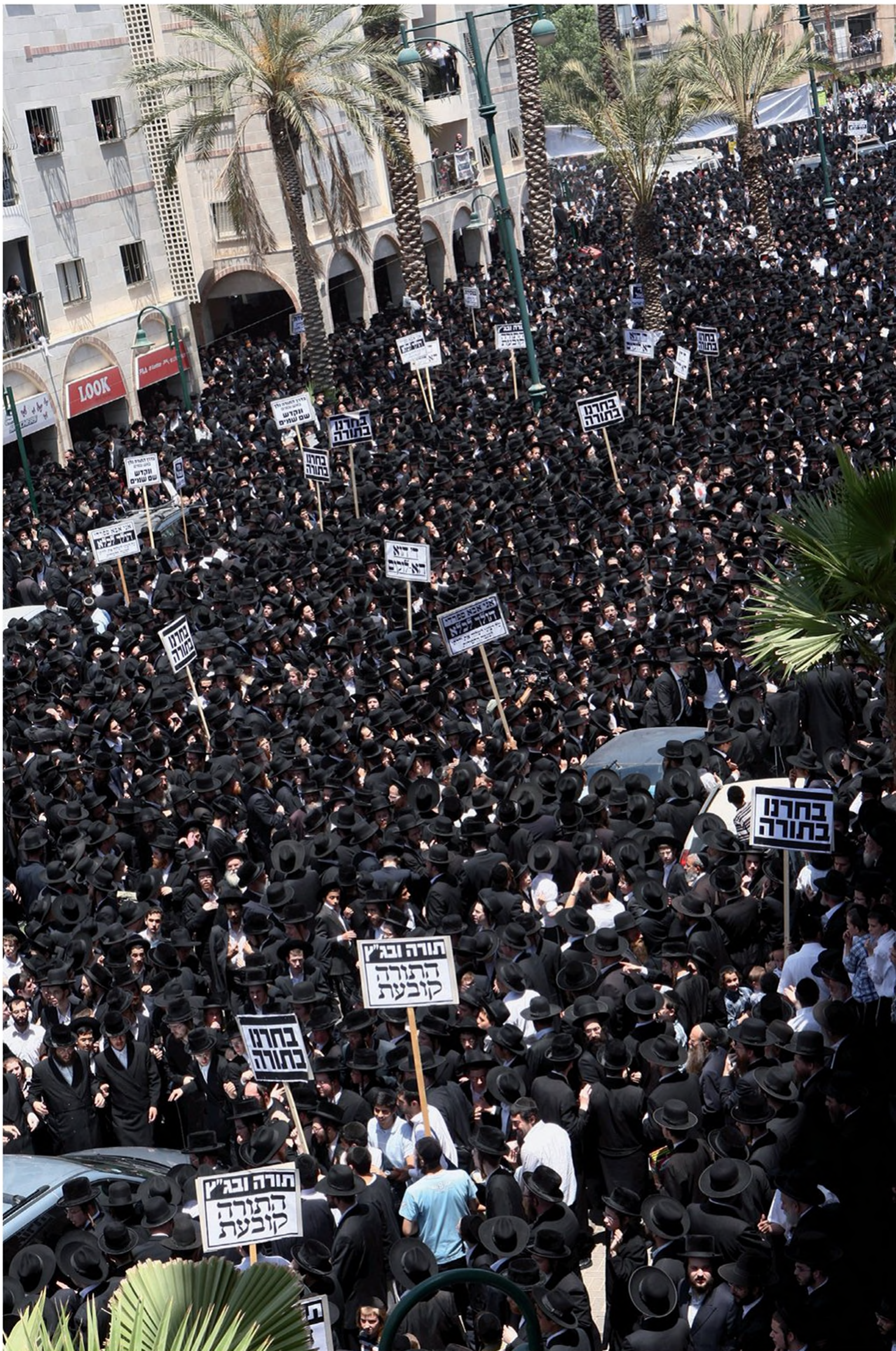
הפגנת החרדים בפרשת עמנואל (2010) בעקבות מעצרים של ההורים על ידי בג"ץ