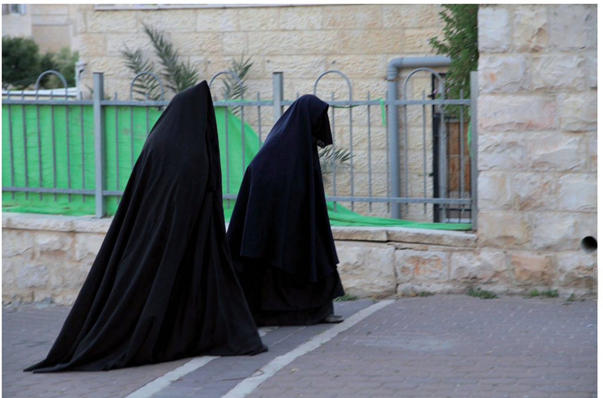
נשים בבית שמש מכוסות מכף רגל ועד ראש