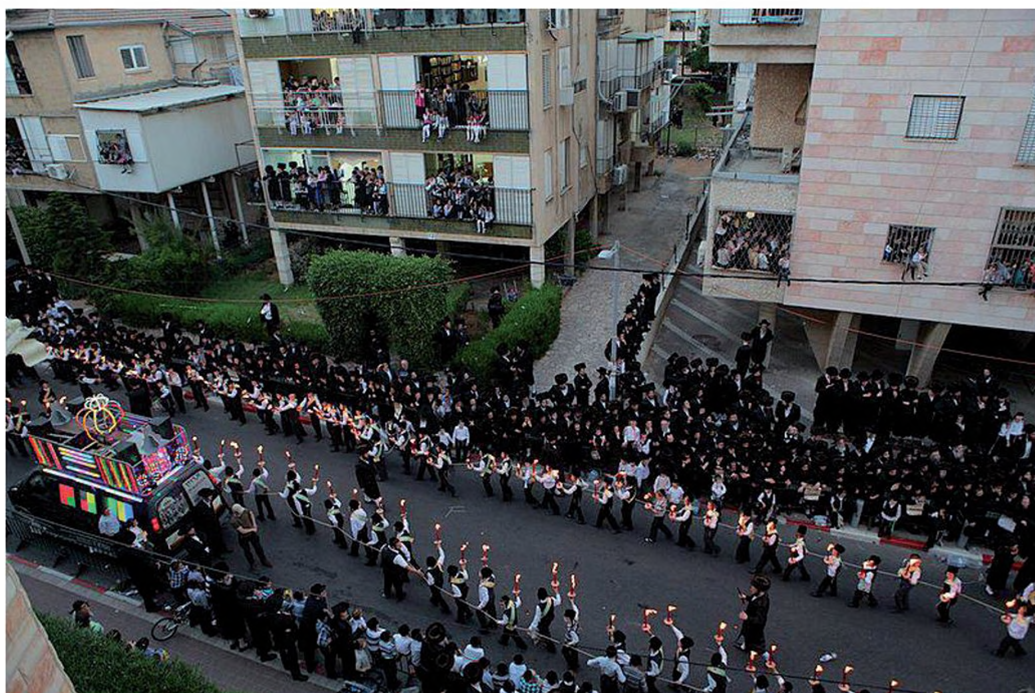
תהלוכת הכנסת ספר תורה חדש לבית הכנסת. במרכז – שני טורי ילדים המחזיקים לפידי אש בידיהם