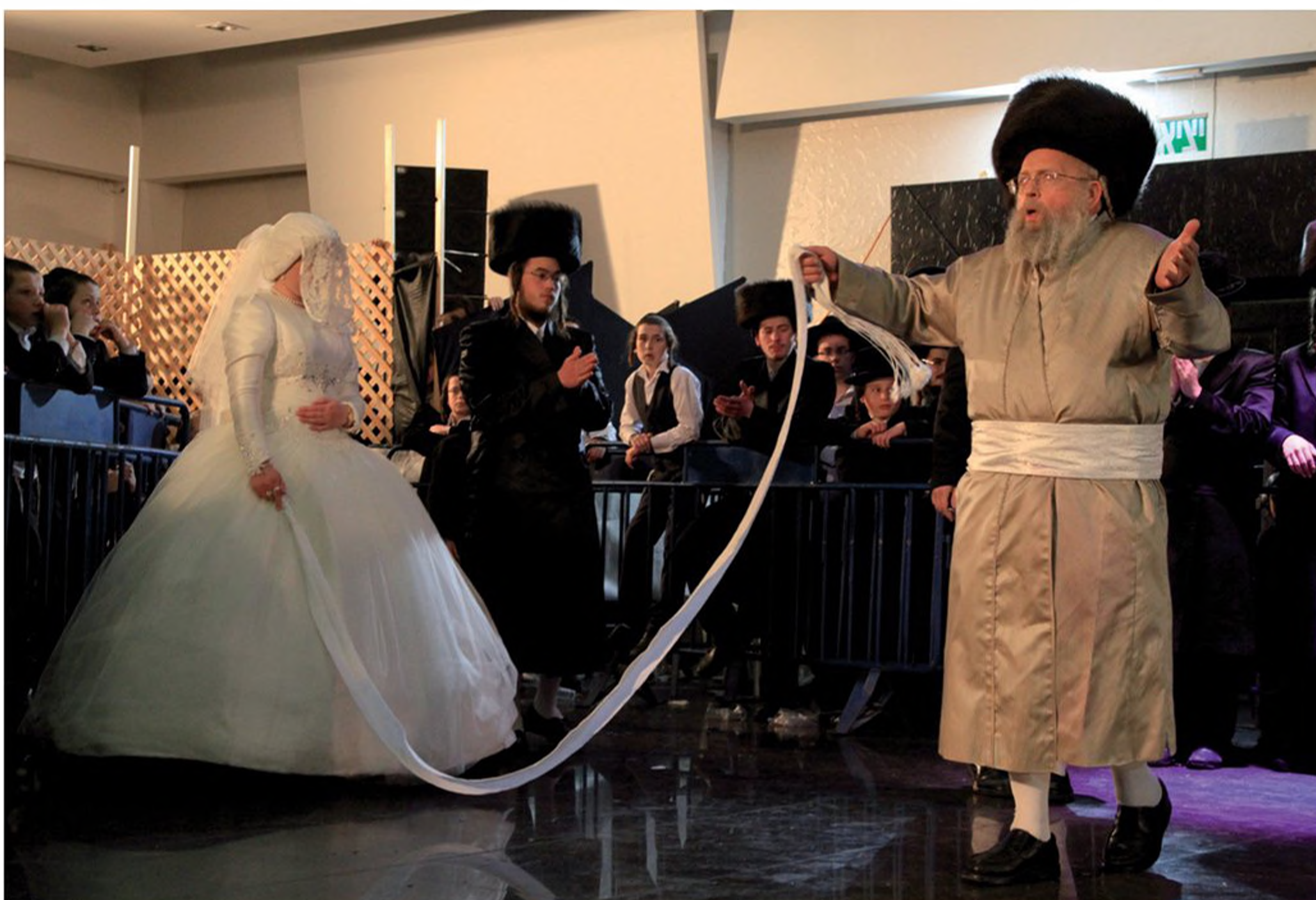
האדמו"ר מפינסק-קרלין רוקד בטקס ה"מצווה-טאנץ" אל מול קהל החסידים