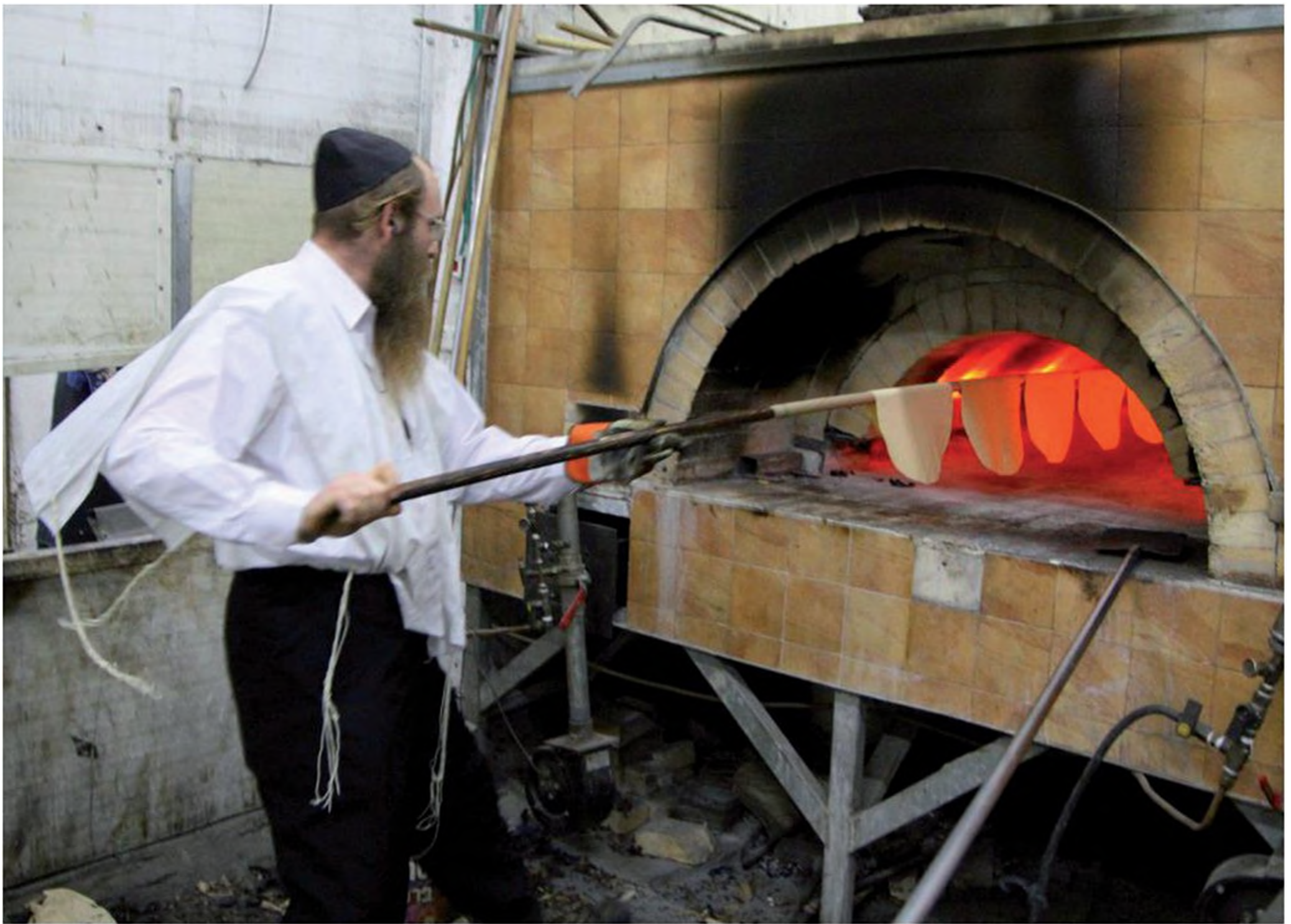
אפיית מצות יד לקראת חג הפסח