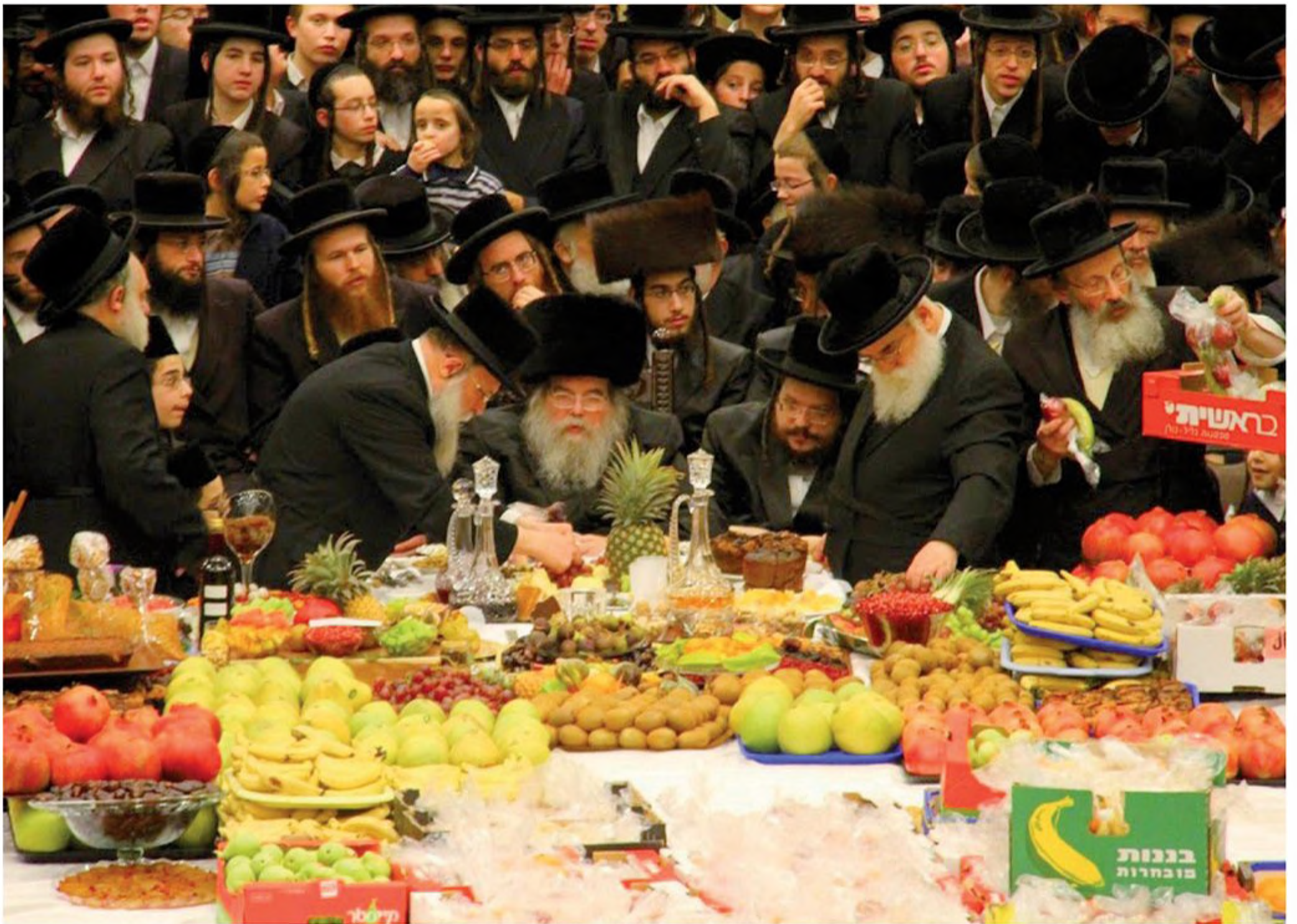
"טיש פירות" שעורך האדמו"ר מבעלזא (במרכז) לכבוד ט"ו בשבט