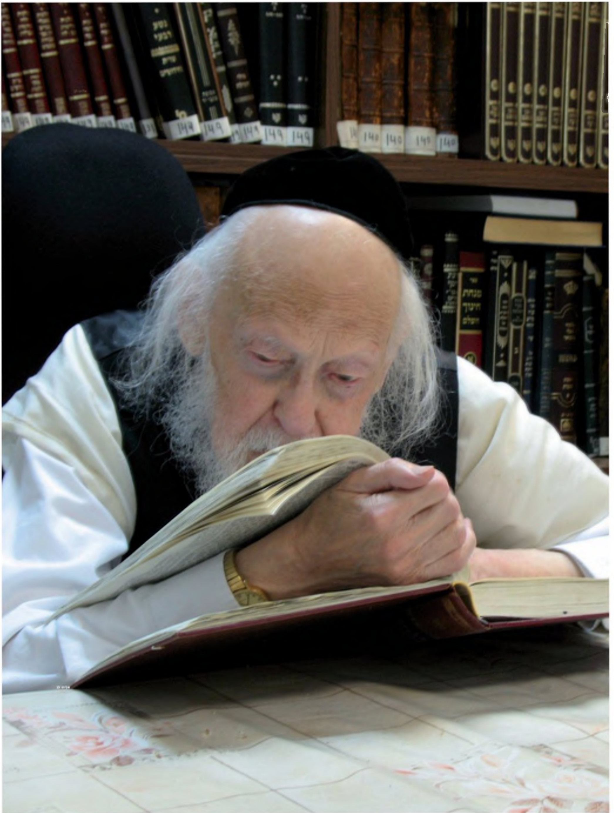
הרב אלישיב לומד בביתו