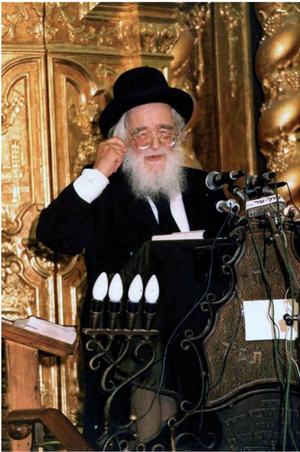
הרב שך מוסר שיעור כללי בישיבת פוניבז'