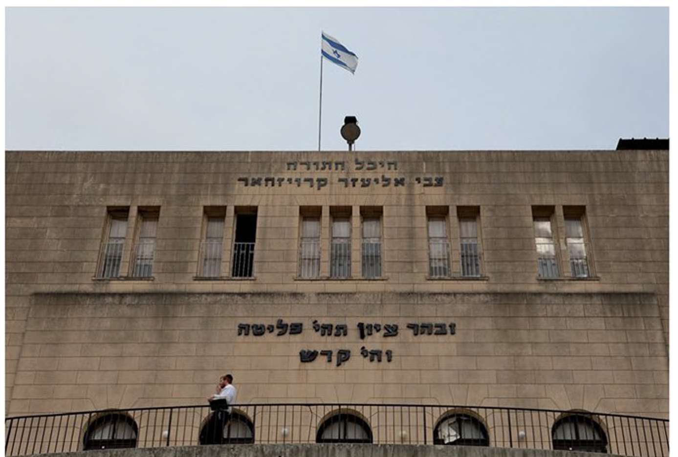
בניין ישיבת פוניבז' ביום העצמאות. בראש הבניין מתנוסס דגל ישראל