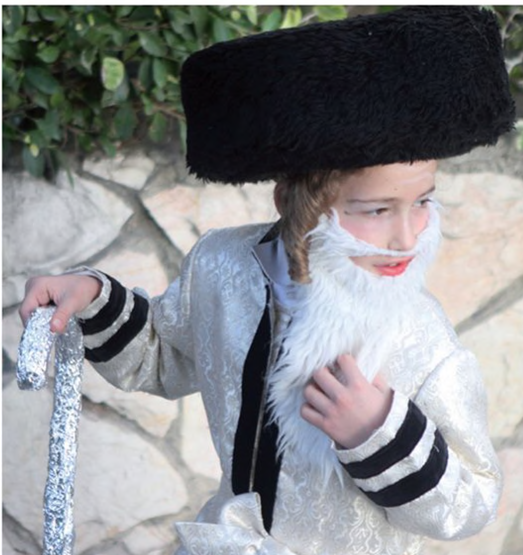
ילד מחופש בחג הפורים