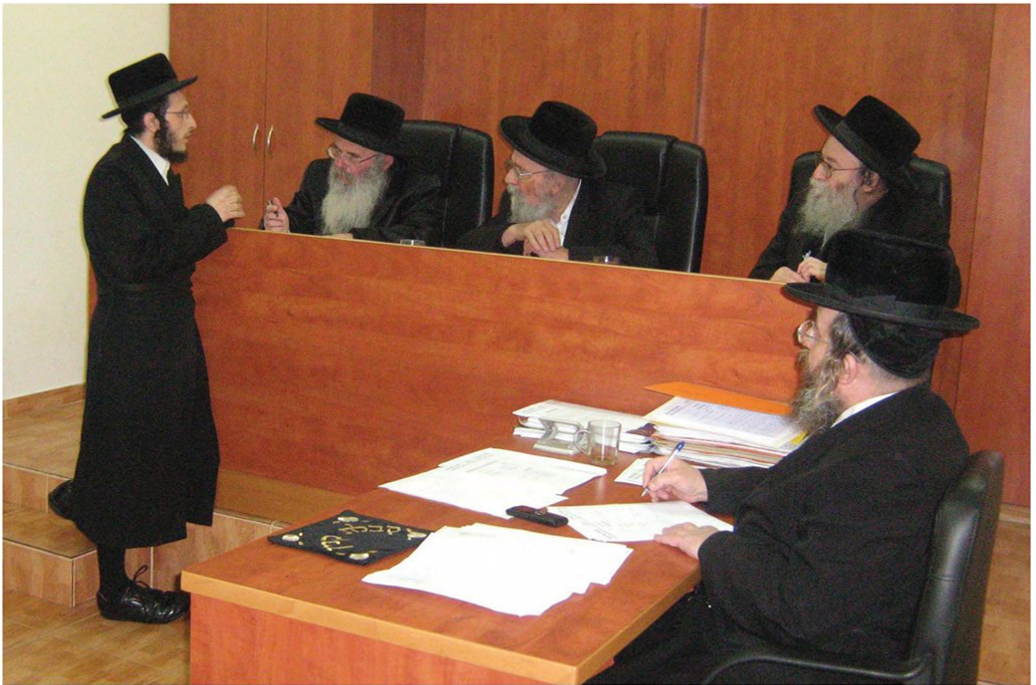
בית הדין של חסידות בעלזא