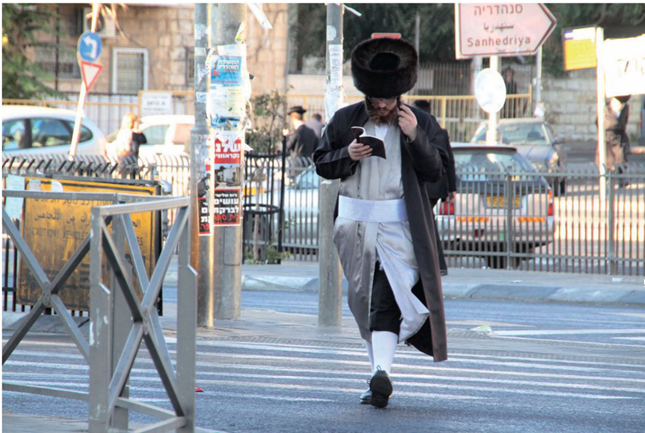
חסיד מנצל כל רגע בדרך ללימוד תורה, ושומר את עיניו ממראות אסורים