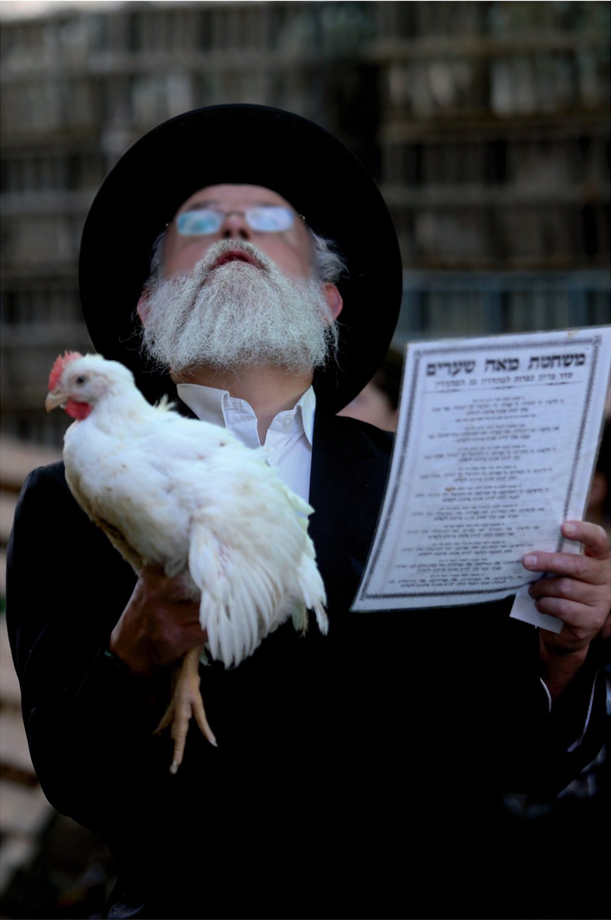
חסיד אוחז בידו תרנגול לכפרות, ערב יום הכיפורים