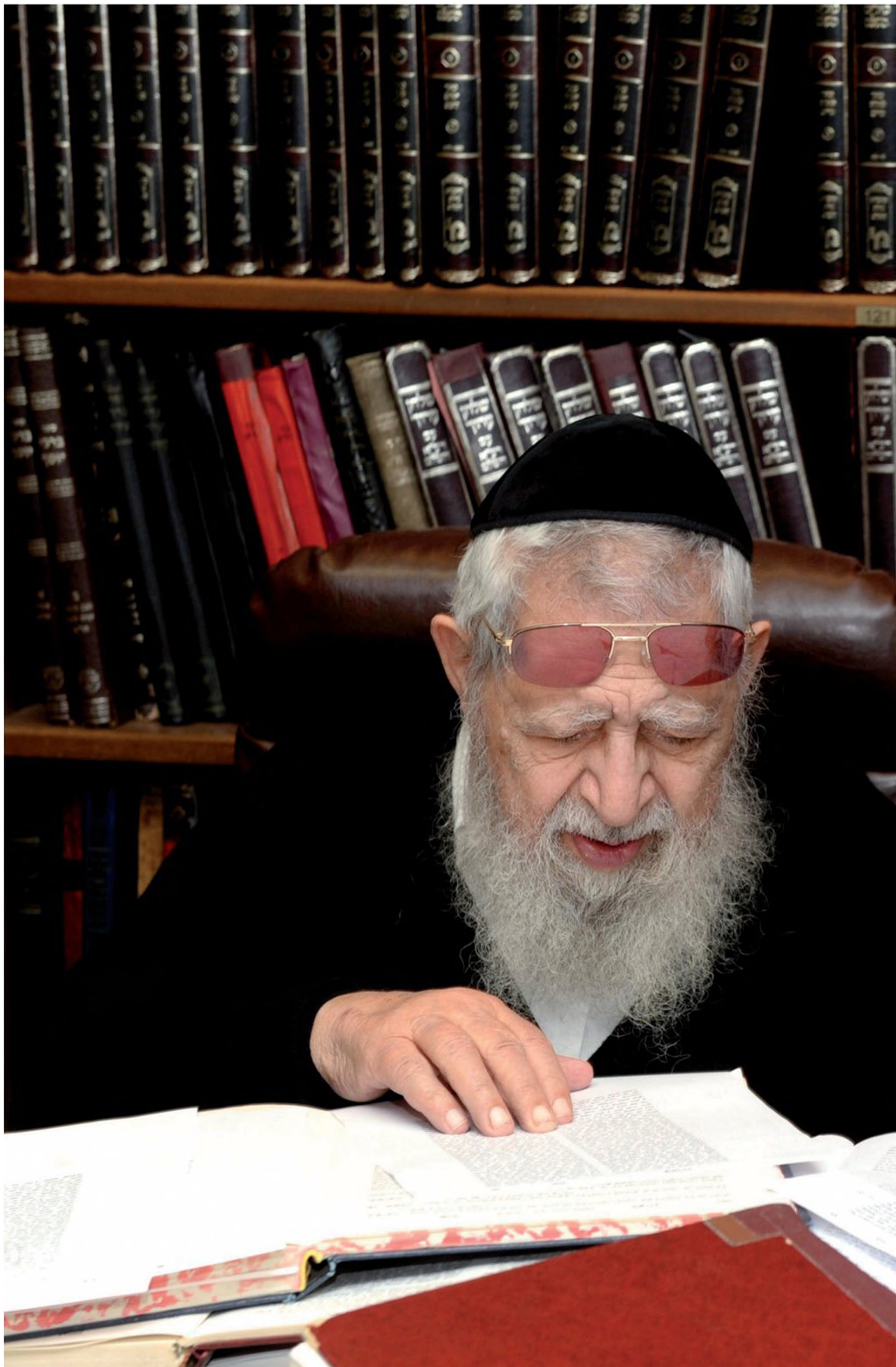
הרב עובדיה יוסף לומד בביתו