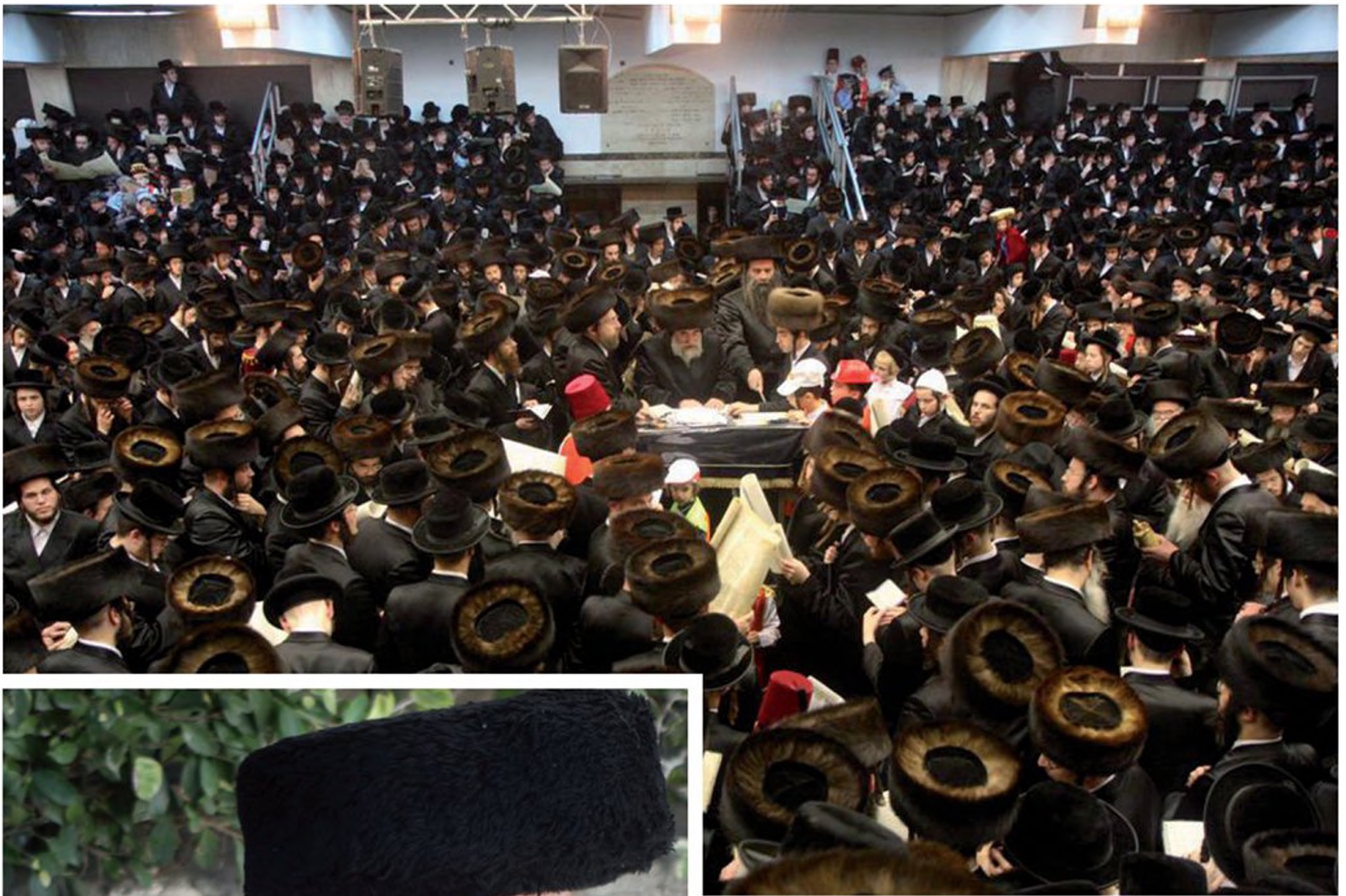
קריאת מגילת אסתר בפורים. במרכז – הרבי מויז'ניץ