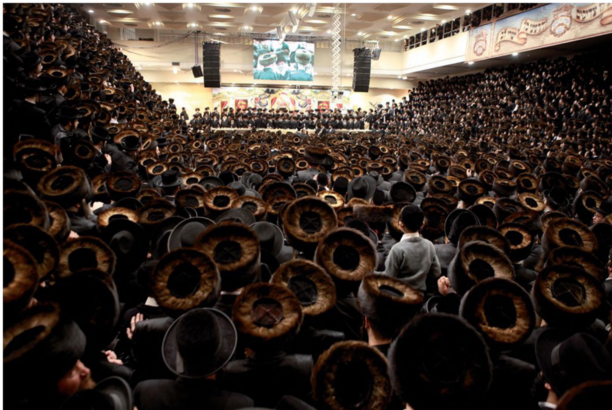
חסידות בעלזא באירוע יום זיכרון ("יארצייט") לאדמו"ר הקודם