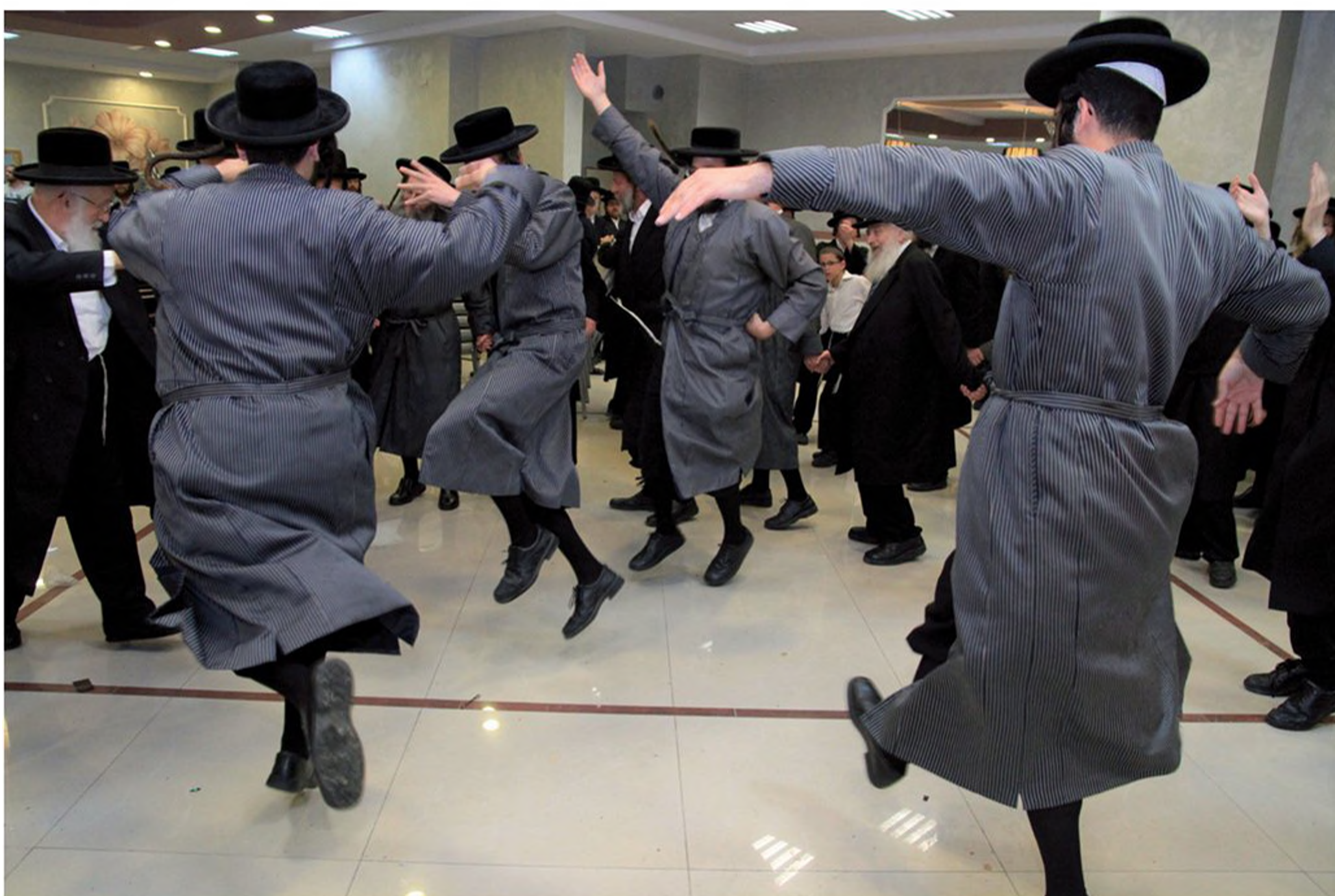
ריקוד חסידי אופייני בחתונה. חלוק הפסים מציין השתייכות חסידית ייחודית