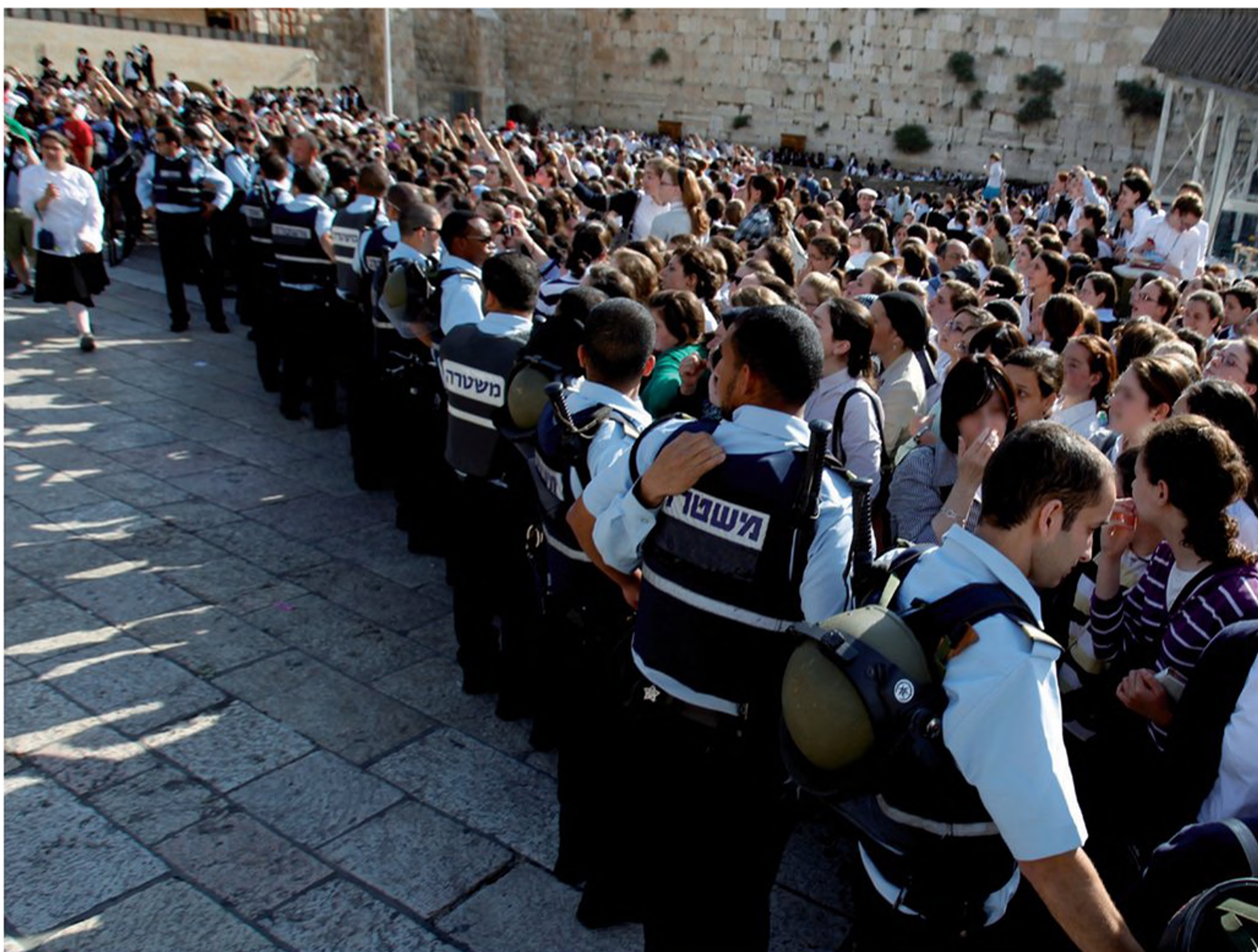
הפגנת נשים חרדיות ברחבת הכותל כנגד "נשות הכותל" הרפורמיות