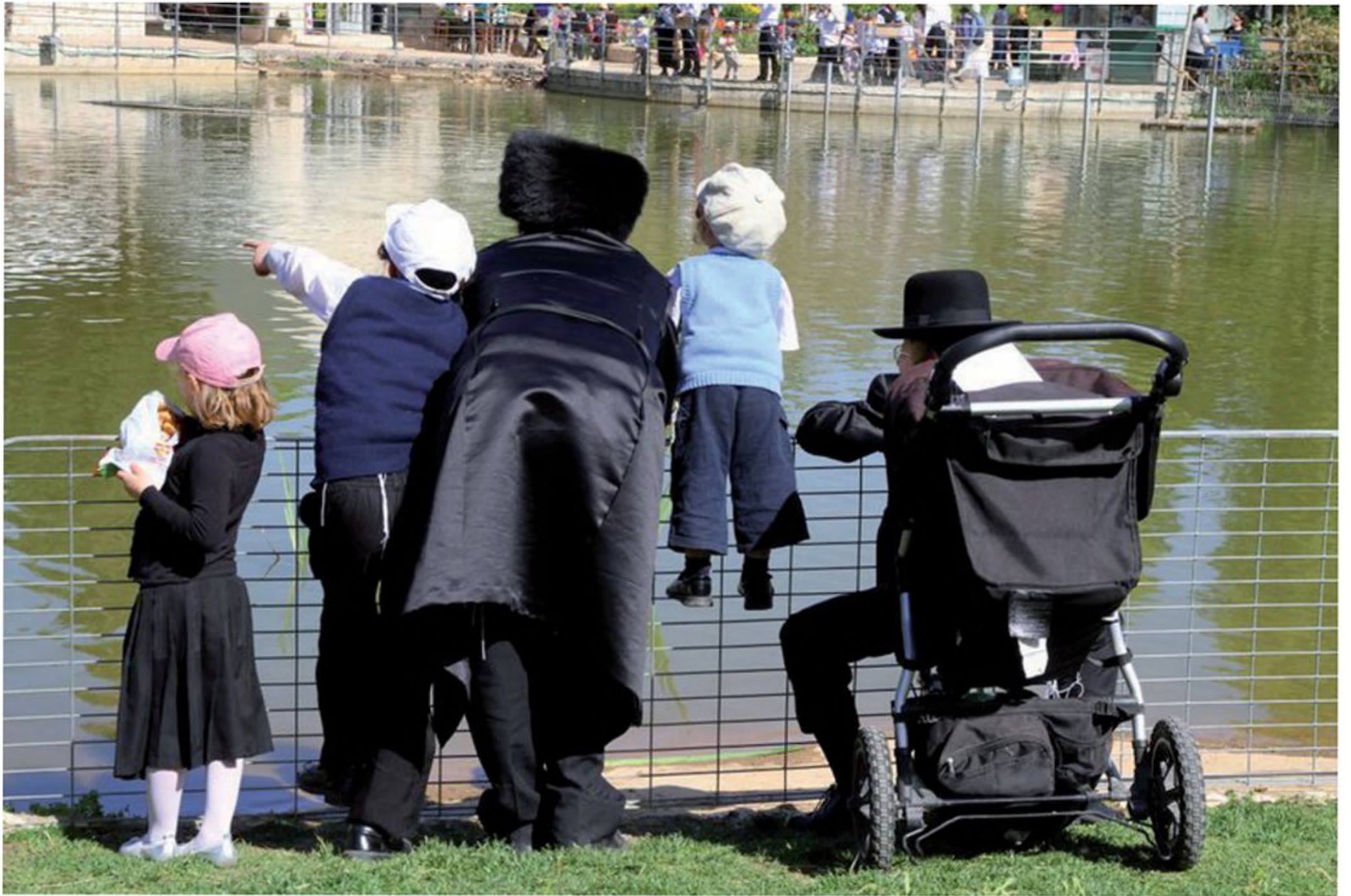
משפחה חסידית בטיול חול המועד