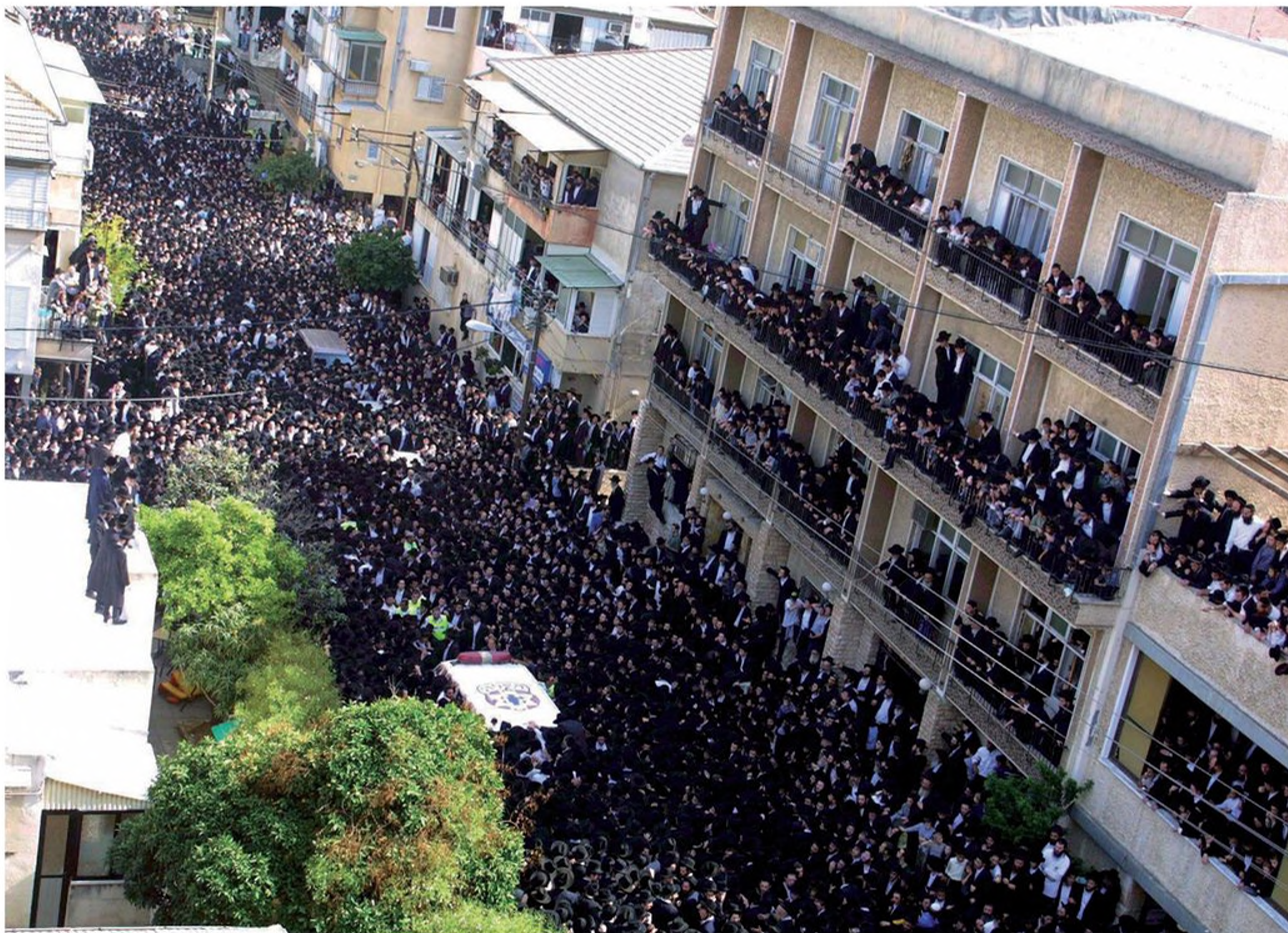
הלוויית הרב מנחם שך, בני ברק, 2001