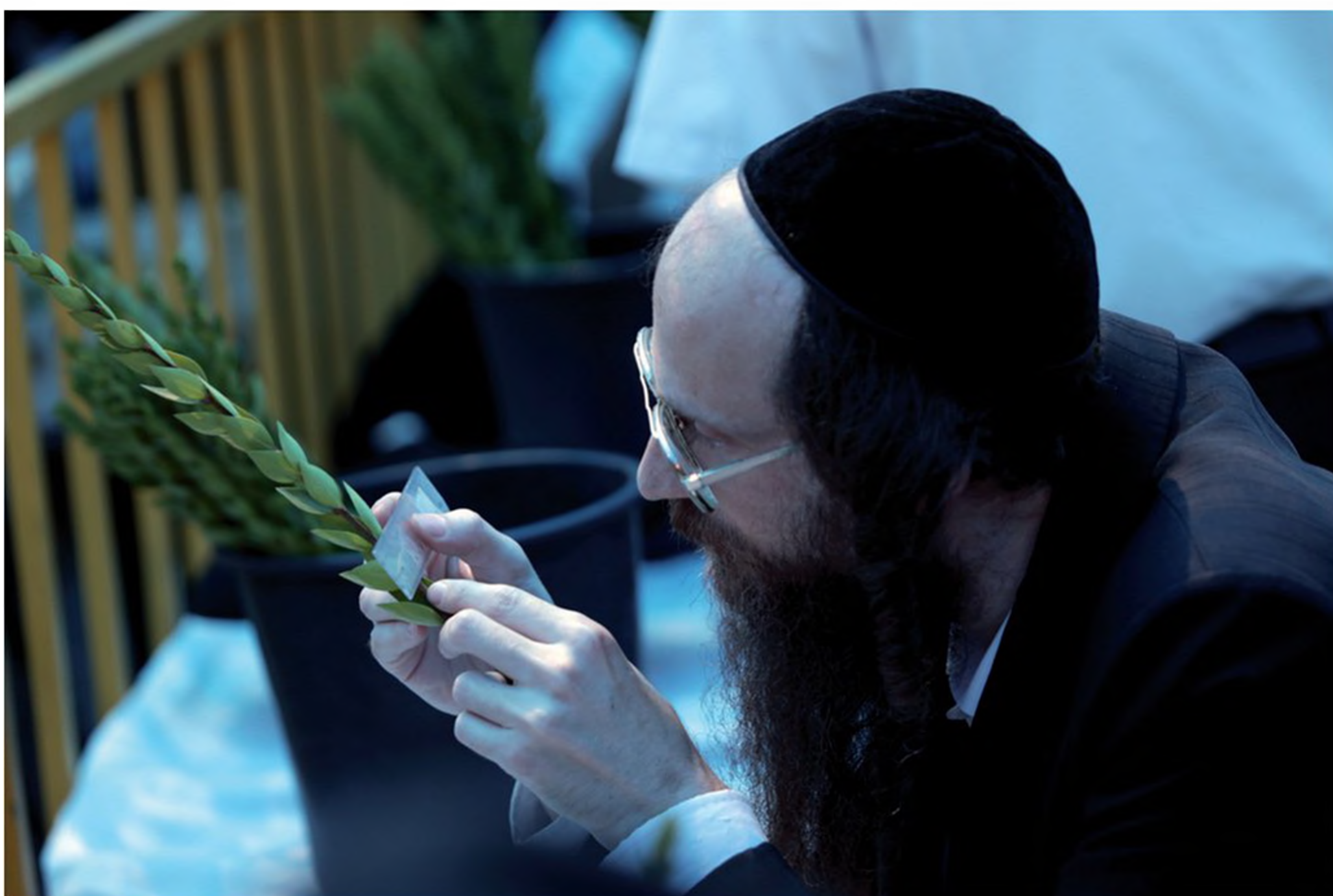
אברך חסידי בודק בסרגל את גודלם של עלי ההדס, לקראת חג הסוכות