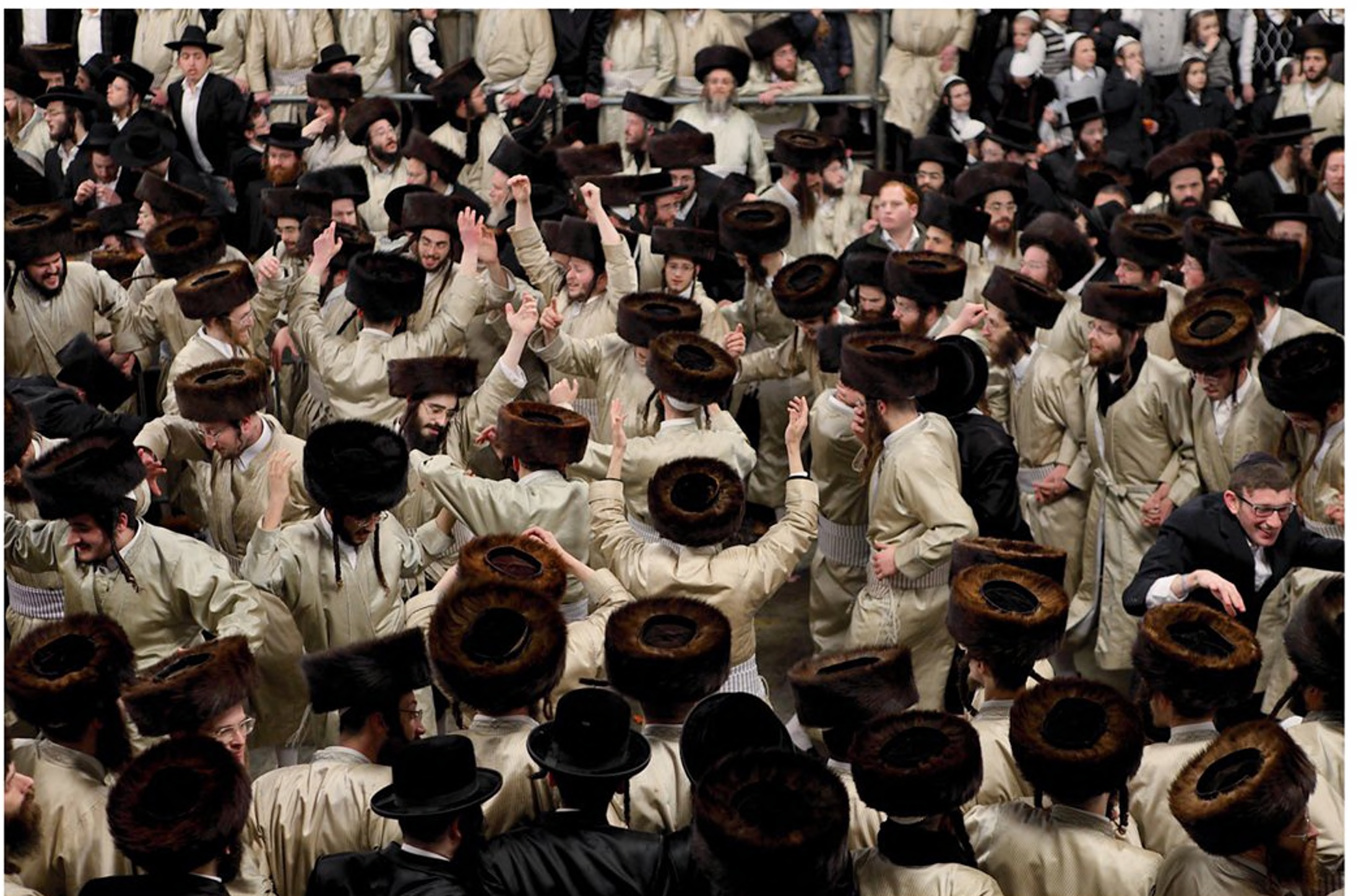
שמחת בית השואבה בחסידות תולדות אהרון