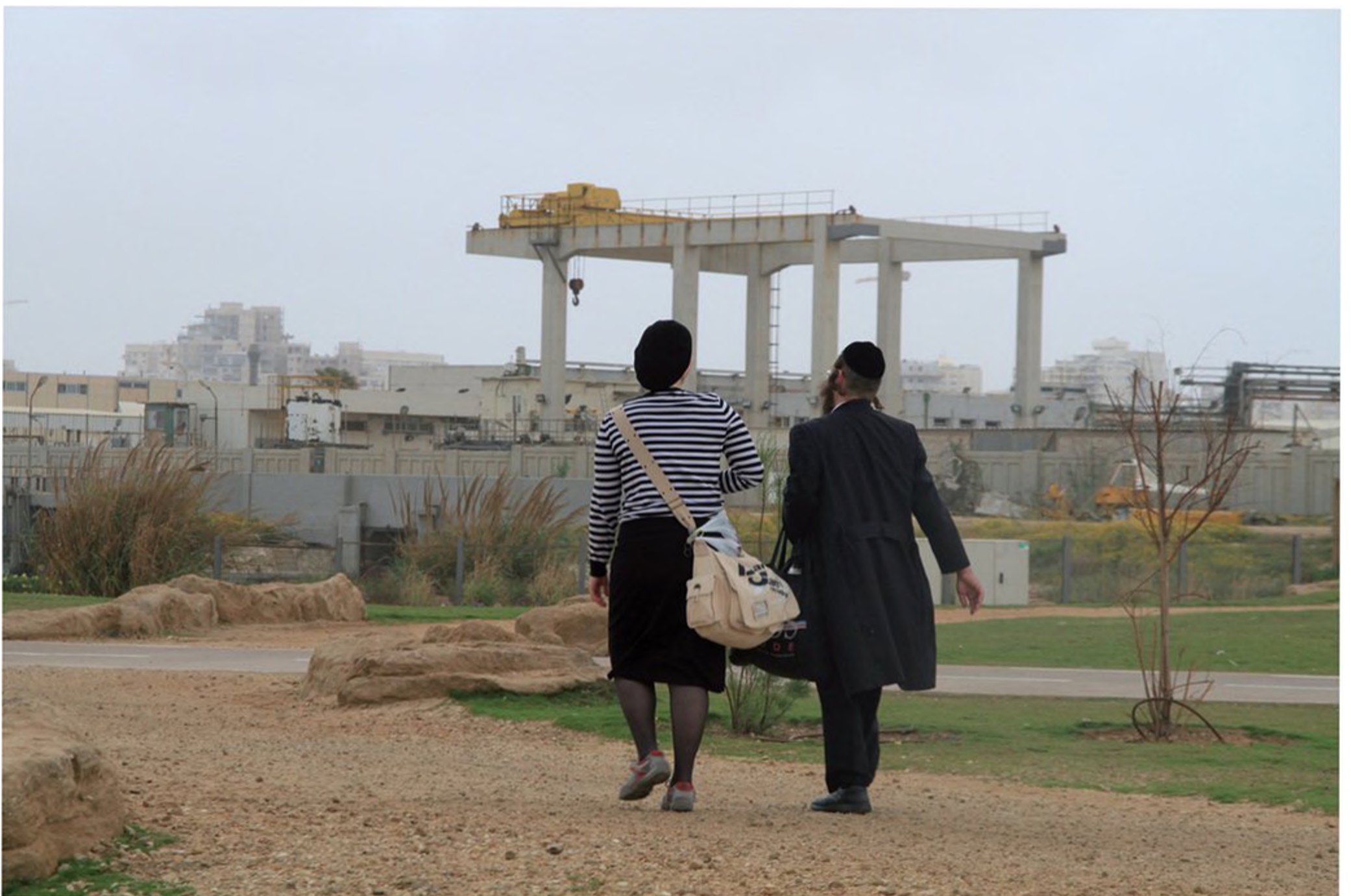
זוג חסידי בטיול בתקופת בין הזמנים