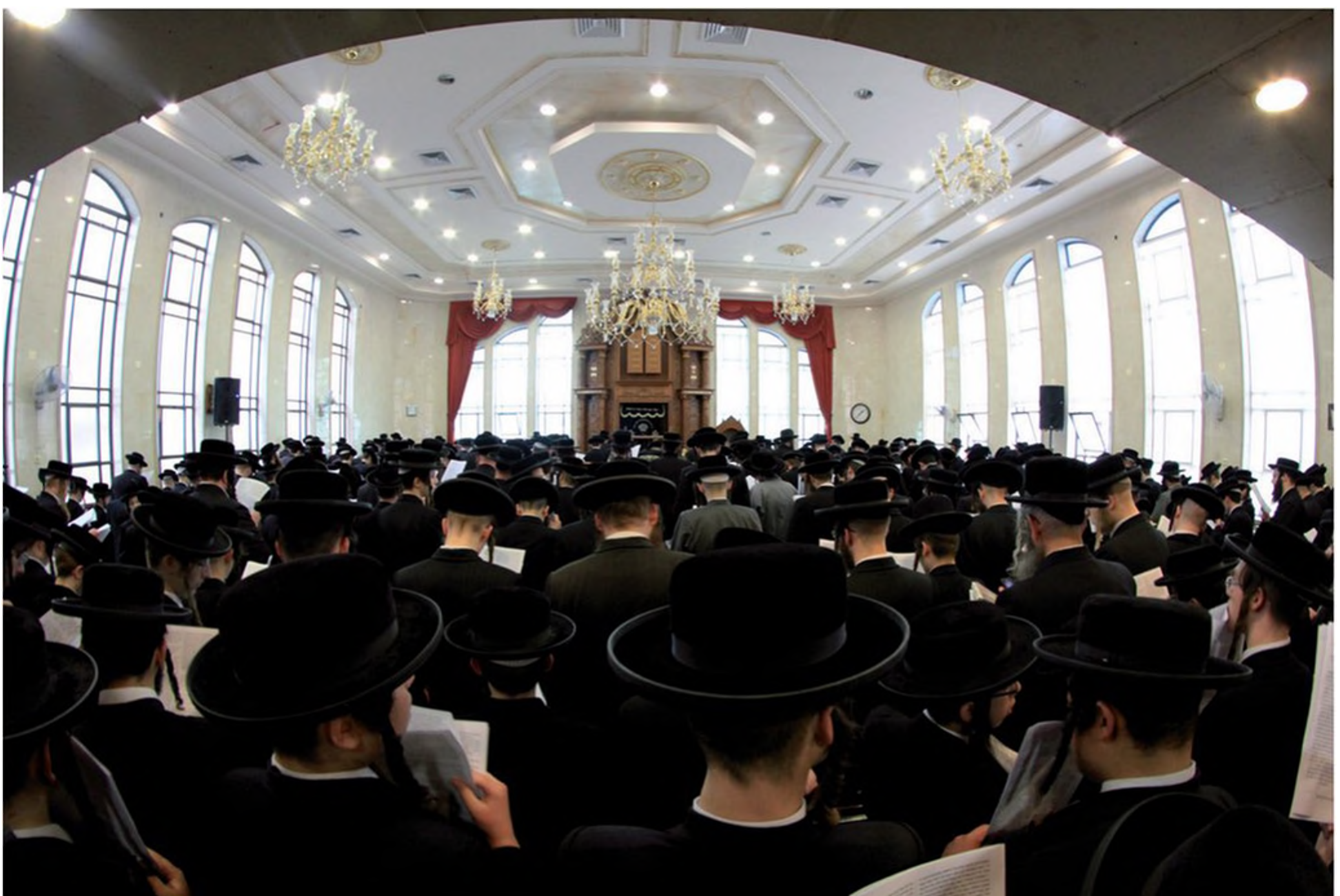
היכל ישיבה חסידית. הבחורים עומדים לתפילה בחליפות ובמגבעות