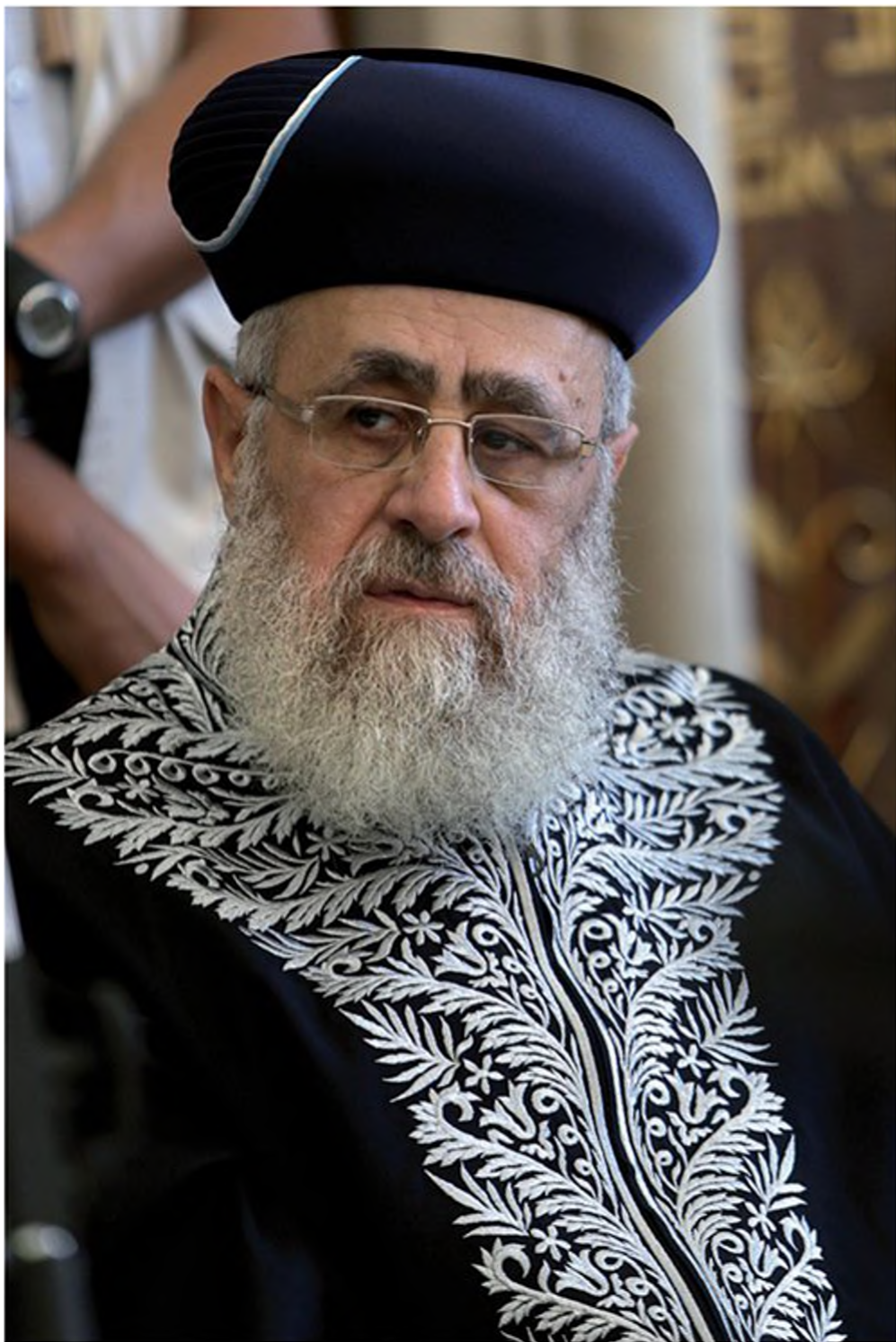
הרב יצחק יוסף, לבוש אף הוא בבגדי הראשון לציון