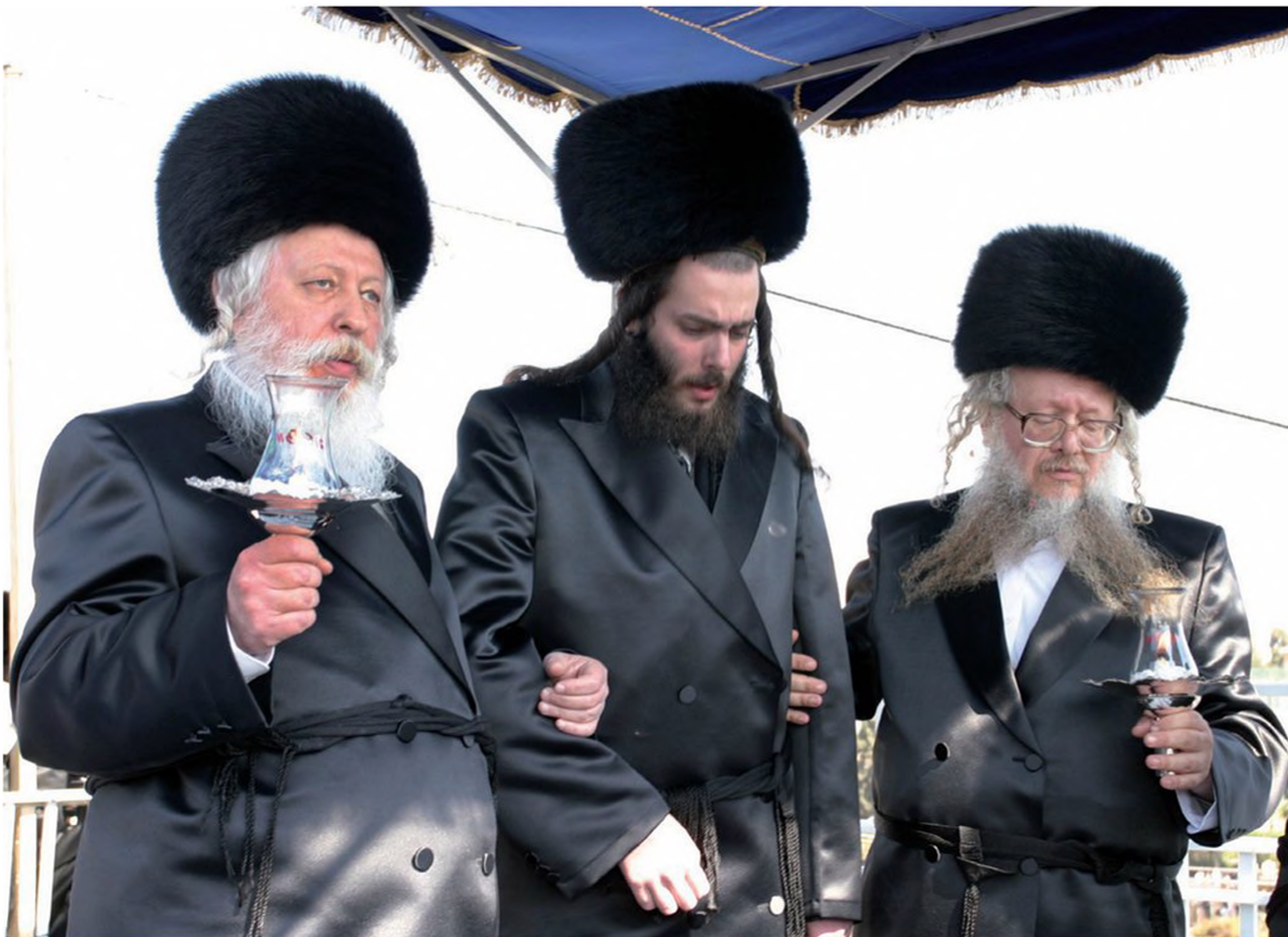
הרבי מגור (משמאל) מוביל את בנו לחופה. חזותם החסידית של חסידי גור נבדלת ב"ספורדיק" הגבוה אותו הם חובשים לראשם