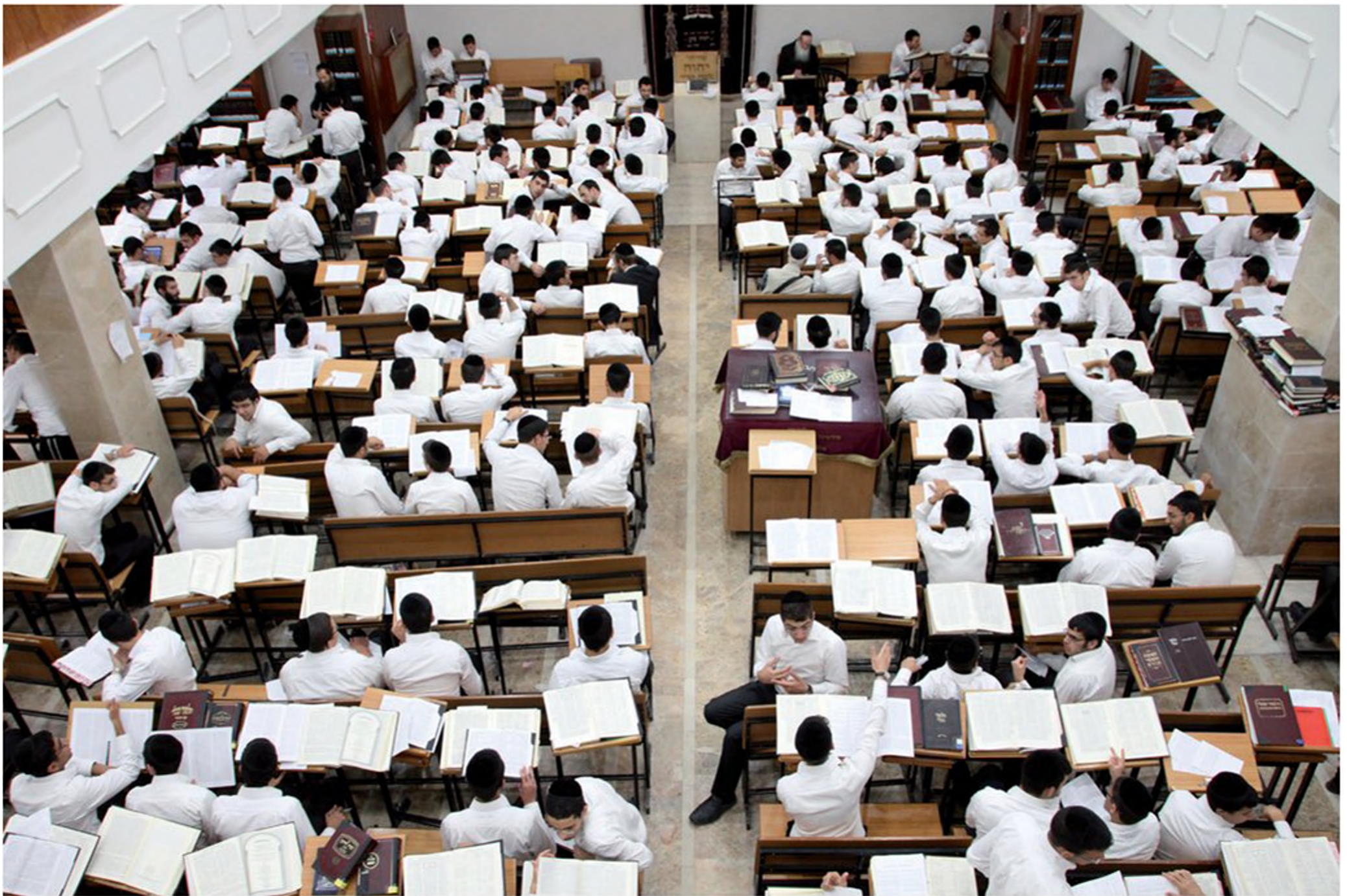
היכל ישיבה ליטאית. הבחורים לומדים בחברותות זה עם זה