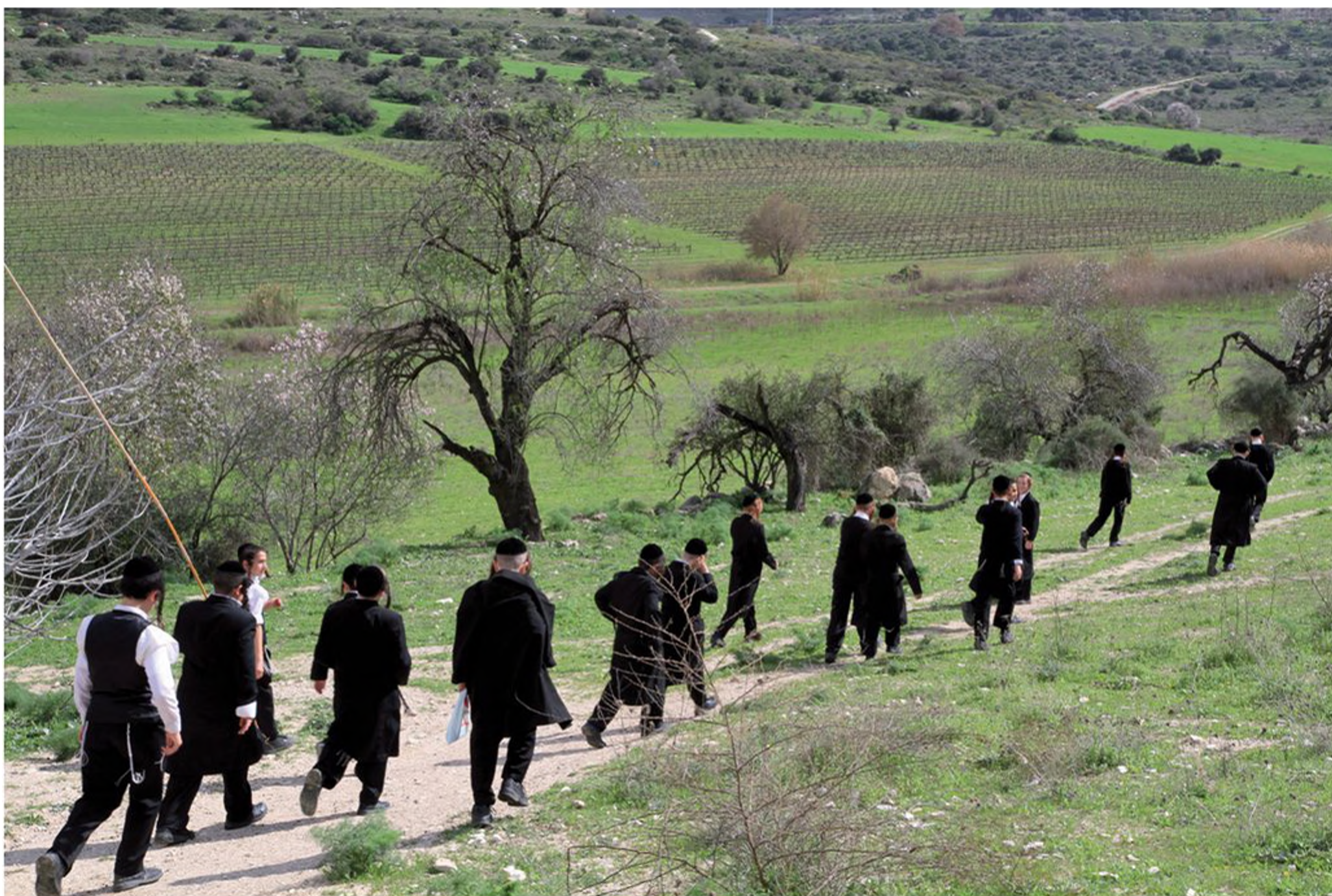
צעירים חסידים בטיול שנתי של בית הספר