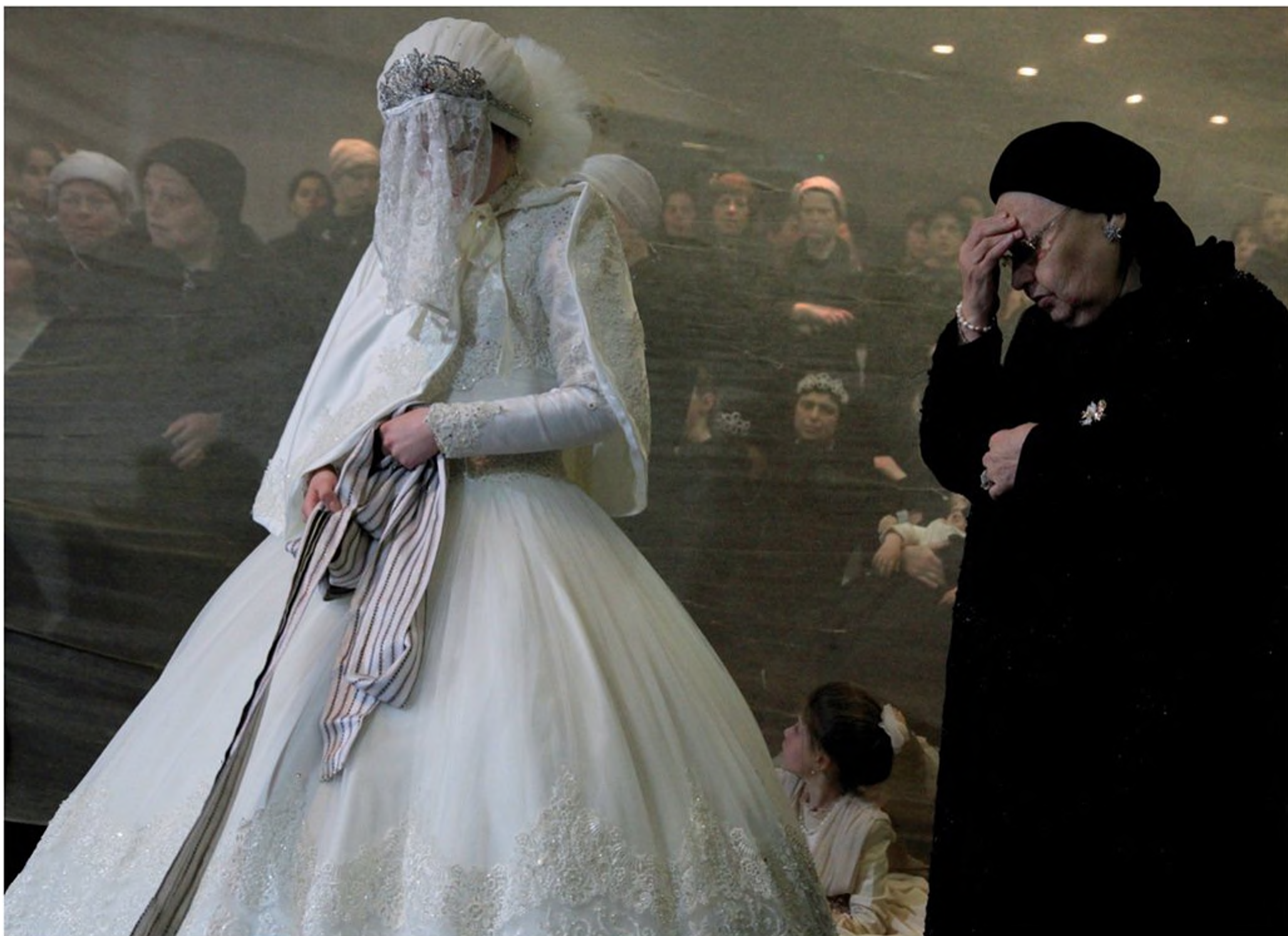
אם חסידית מלווה את בתה הכלה בתפילה, בטקס ה"מצווה-טאנץ" [ריקוד המצווה]