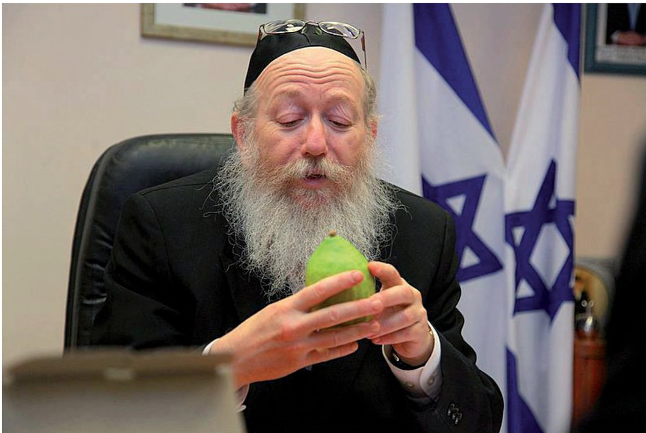
חבר הכנסת יעקב ליצמן בוחן אתרוג בלשכתו, לקראת חג הסוכות