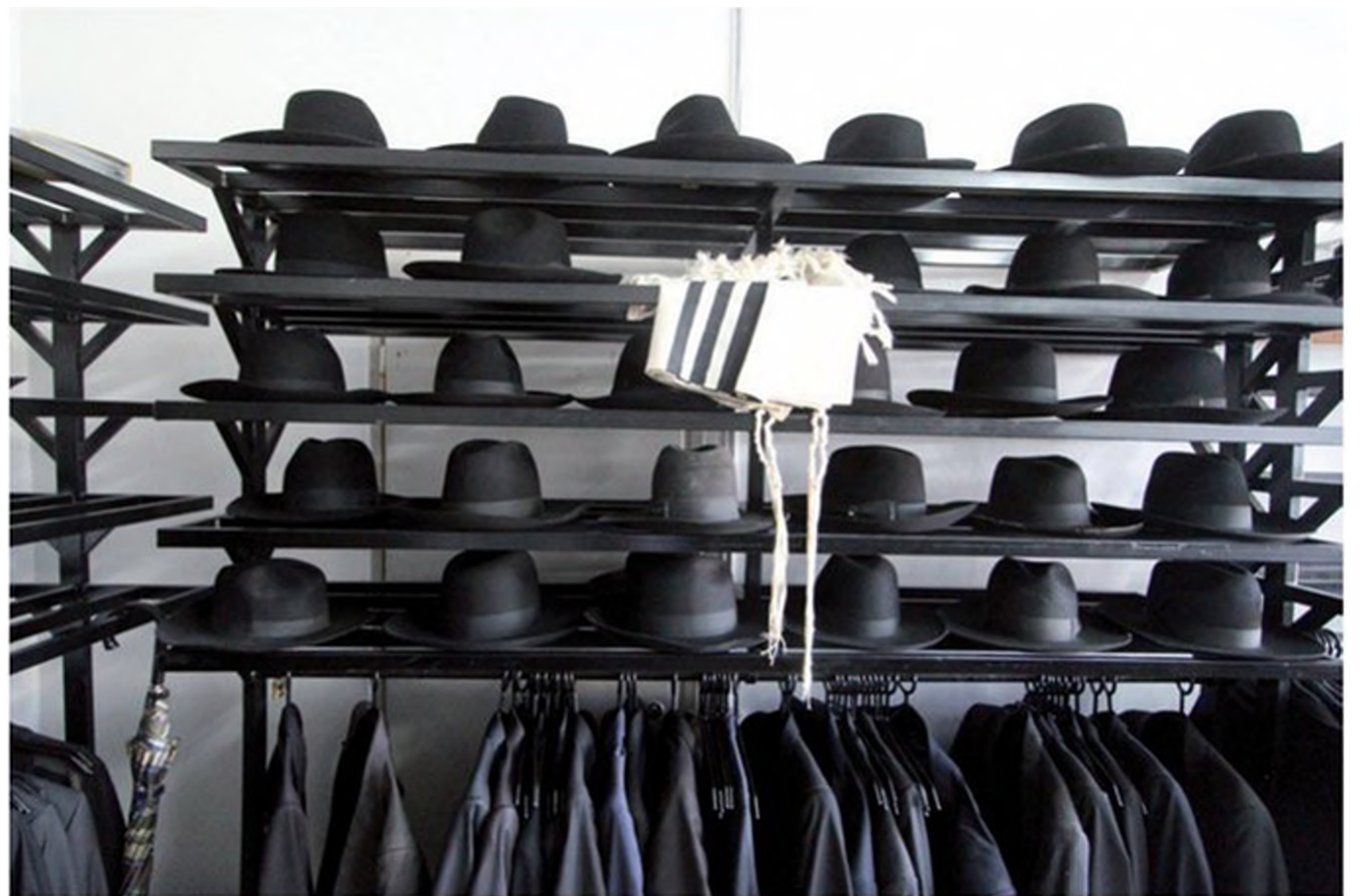
מגבעות וחליפות תלויות בישיבה ליטאית. כל אחד מהבחורים לומד עם הזמן לזהות את שלו