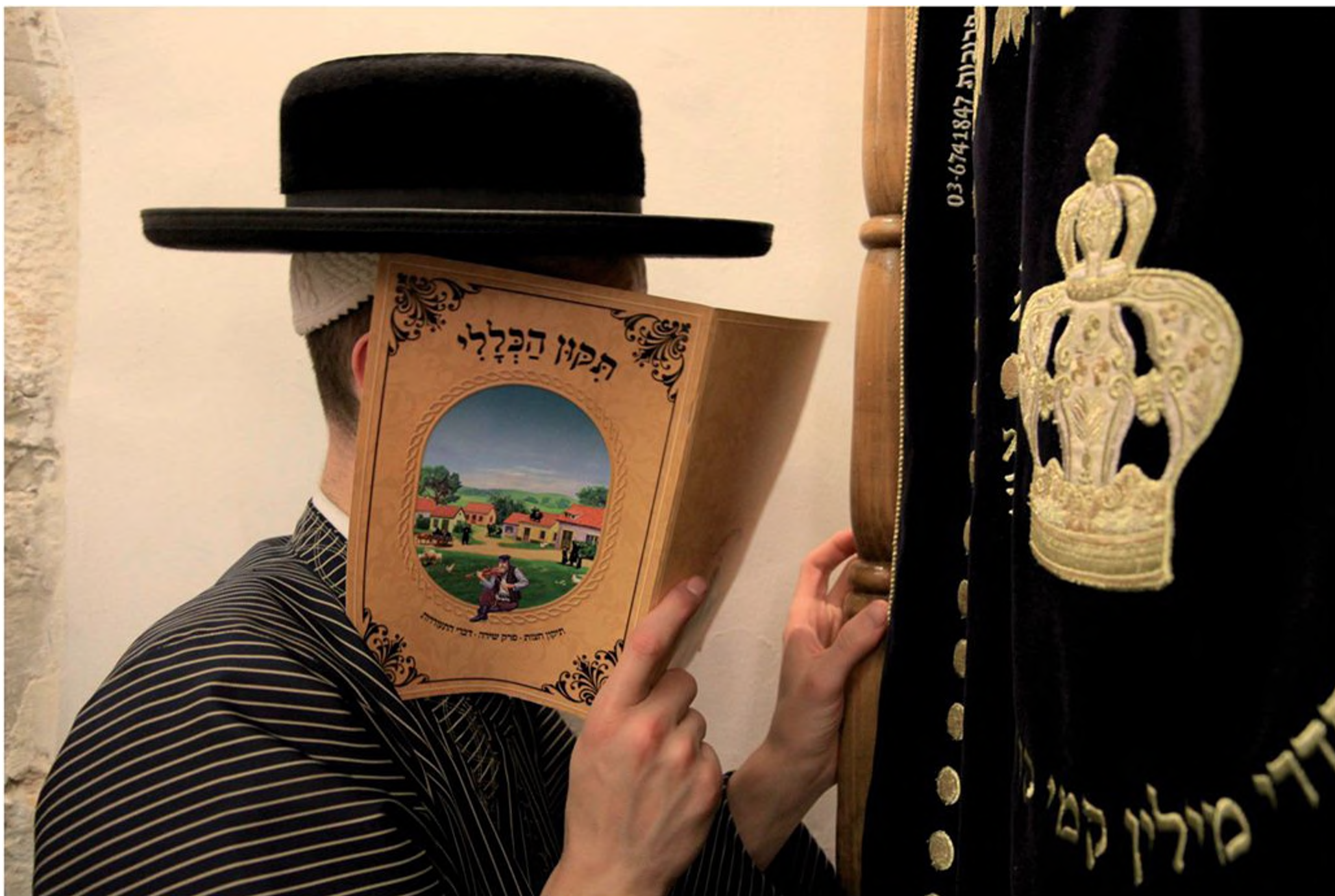
חסיד קורא את ה"תיקון הכללי" על יד ארון הקודש