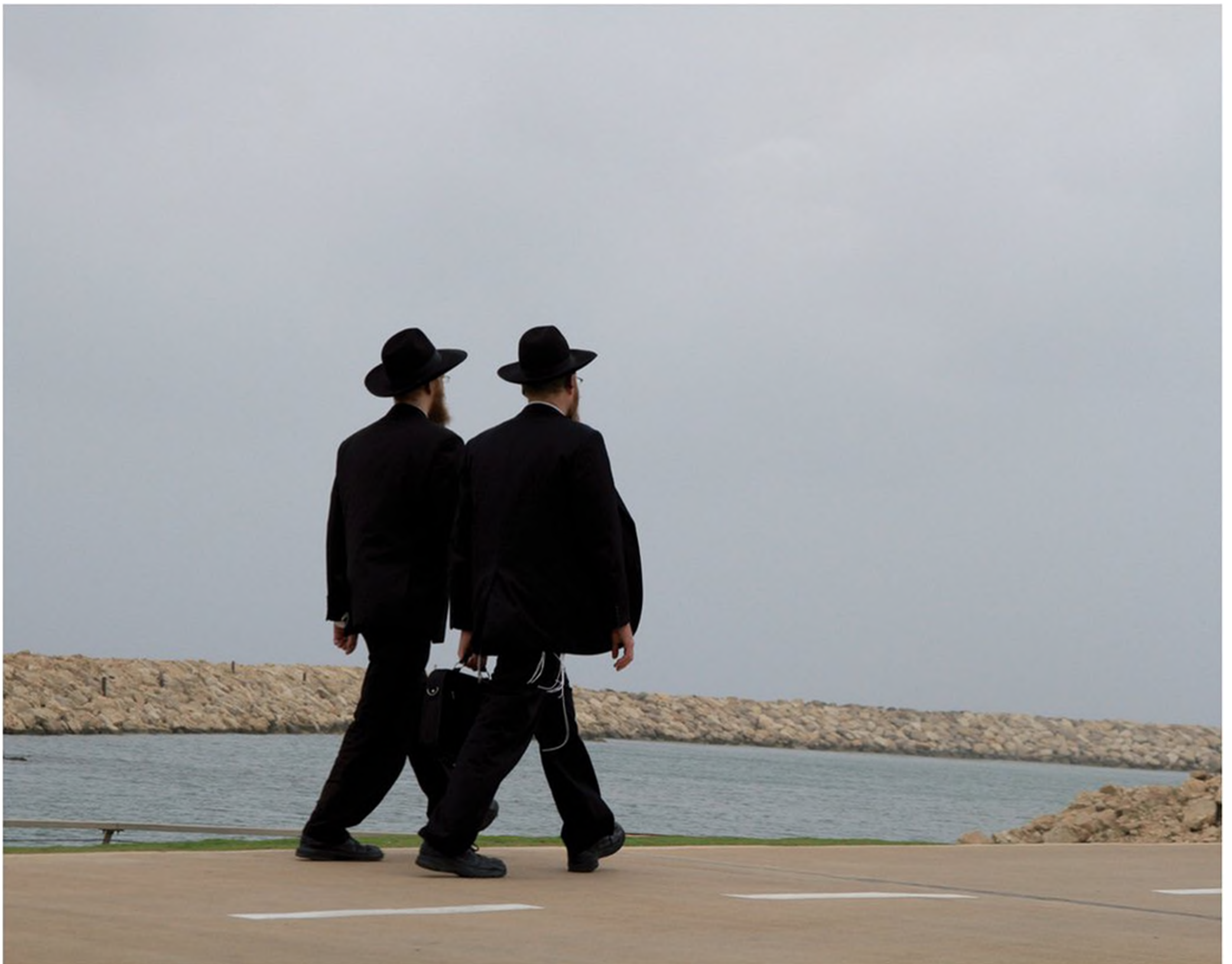
אברכים בלבוש ליטאי