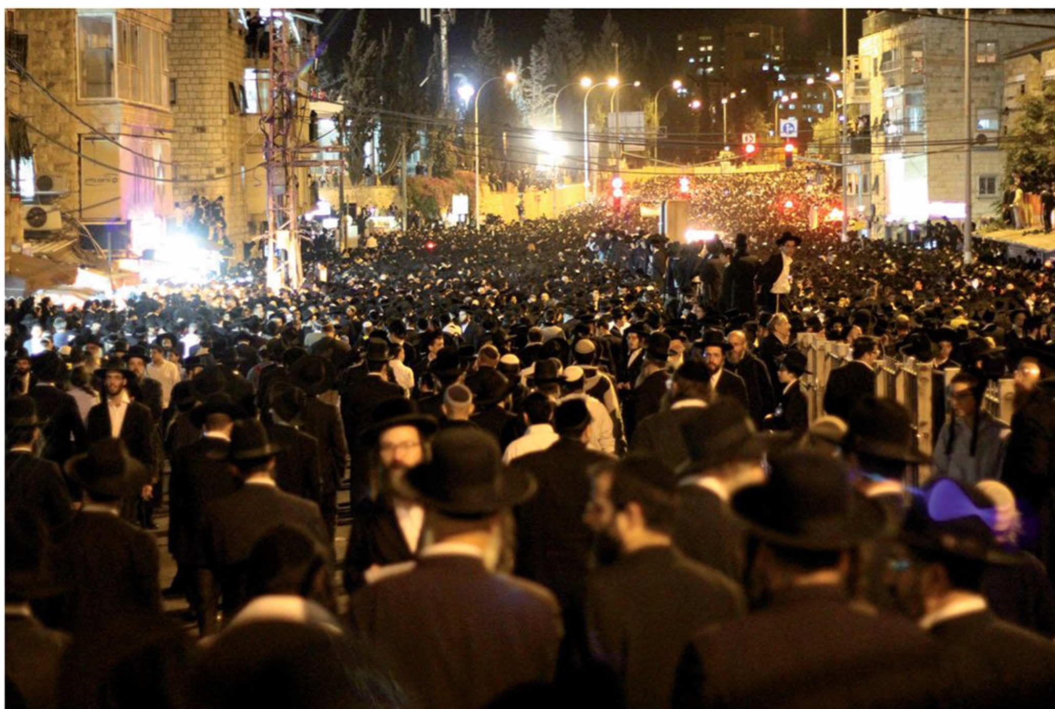
הלוויית הרב עובדיה יוסף, ירושלים, 2013