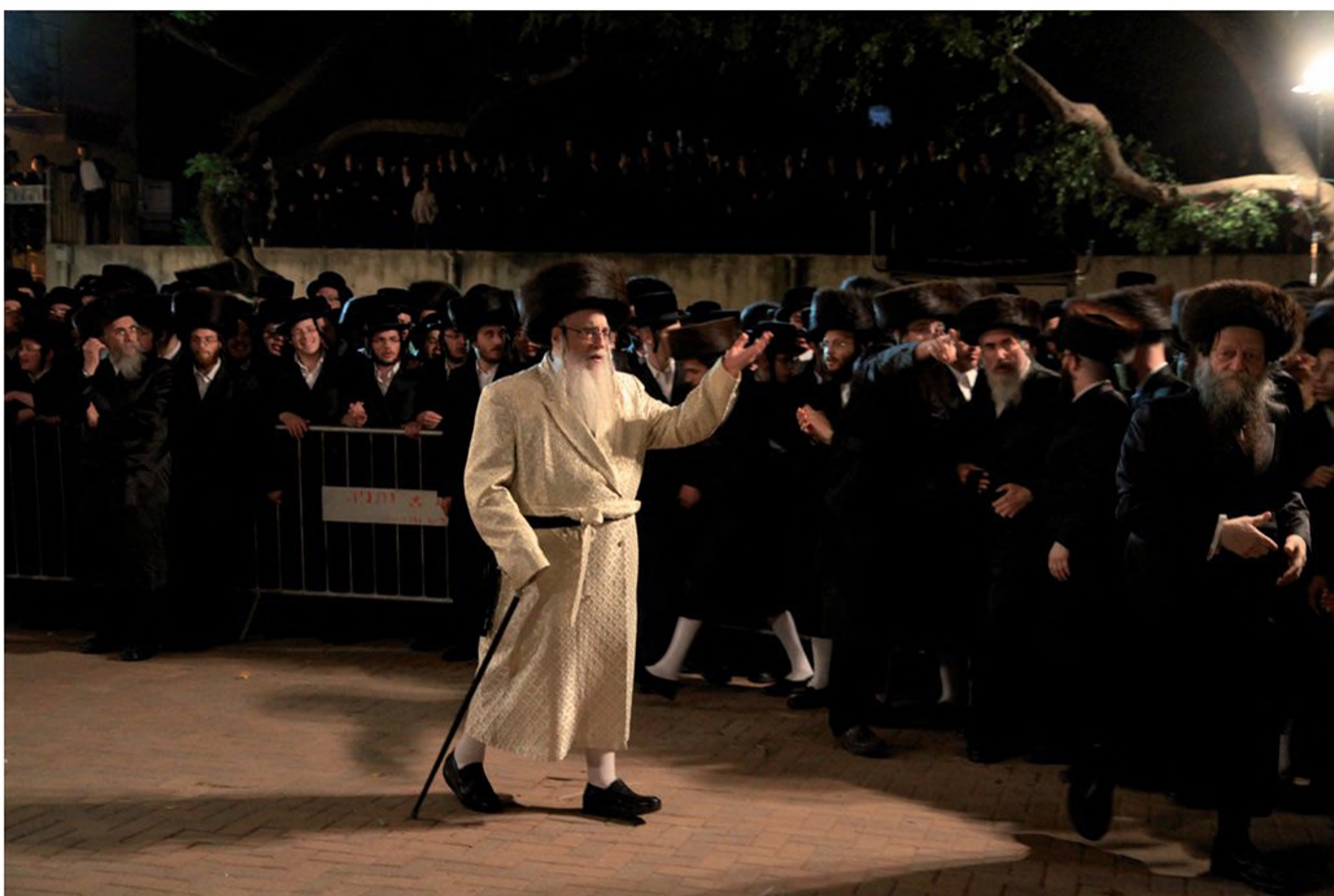
הרבי מצאנז לבוש בהידור בחגיגת הכנסת ספר תורה