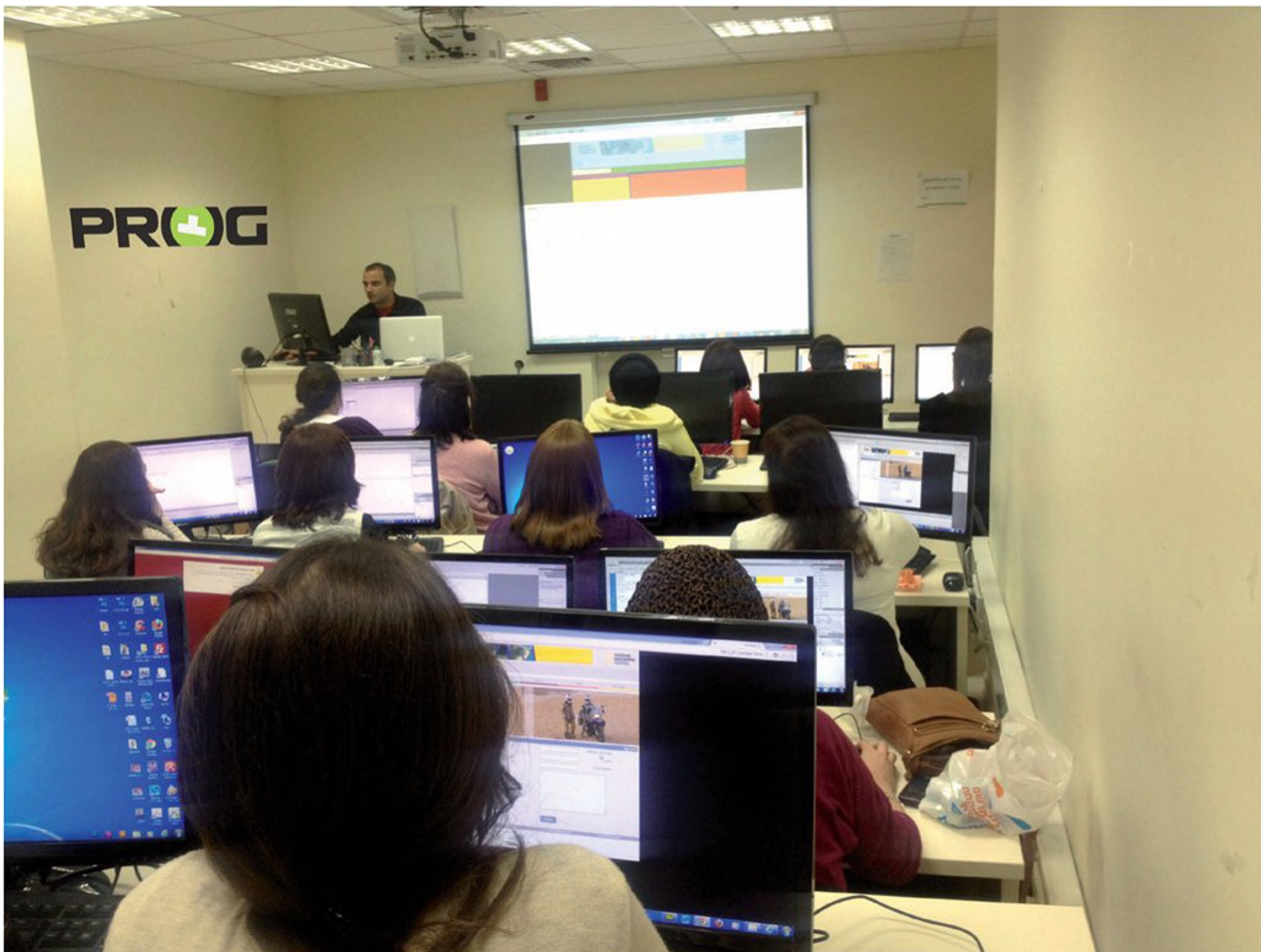
בנות חרדיות מתמקצעות בבניית אתרי אינטרנט