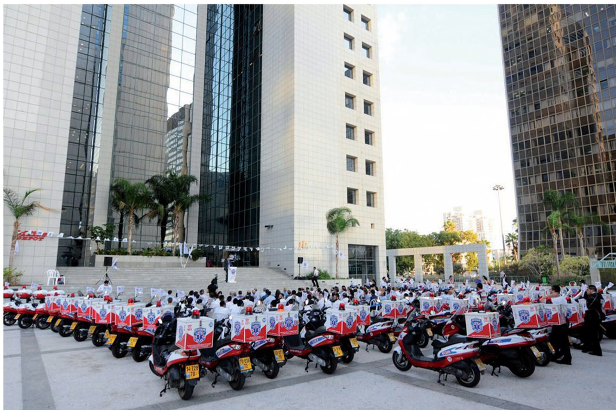
כנס של מתנדבי "איחוד הצלה"