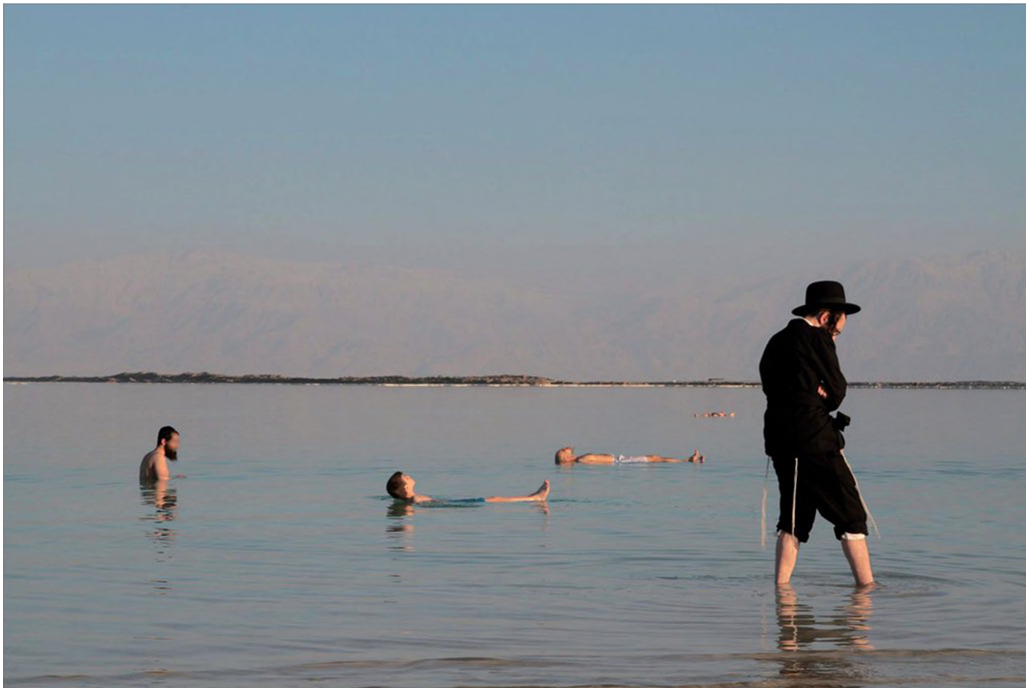
חסיד נופש בים המלח. ההקפדה על הלבוש החסידי נותרת גם ברגעי הנופש