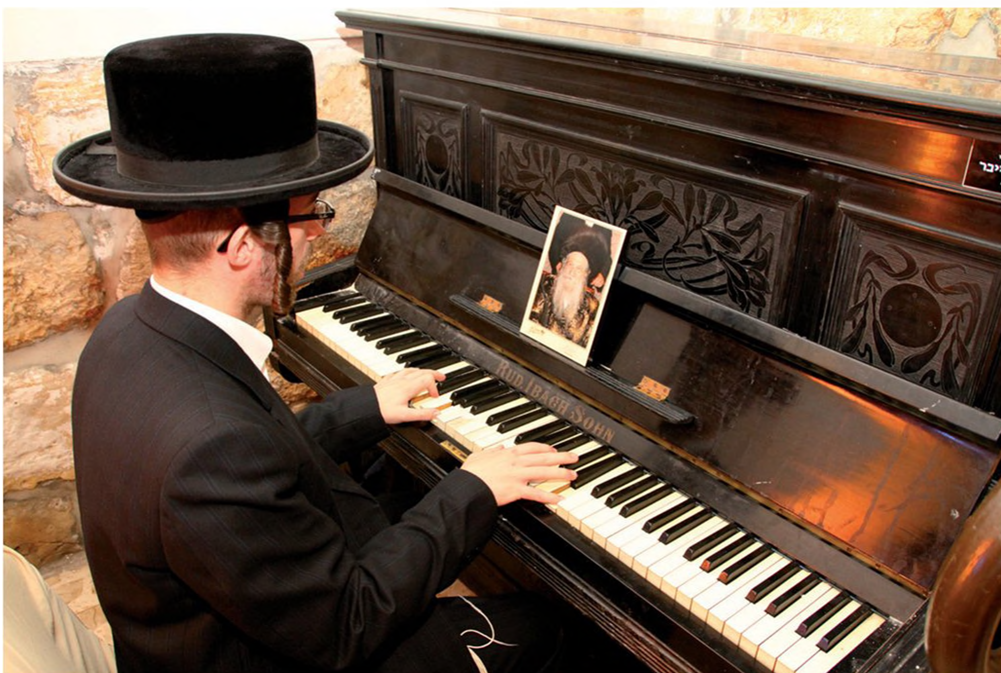
בחור חסידי ברגע של פנאי. ברקע תמונת הרבי מנדבורנא