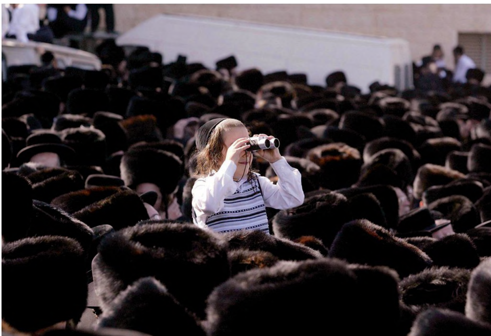
מבט אל החופה מקהל האלפים