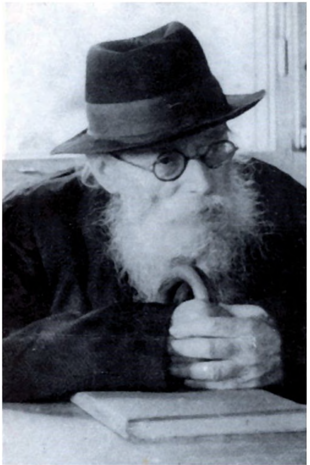
הרב אברהם ישעיהו קרליץ, החזון איש

חברי הכנסת של דגל התורה בהתייעצות עם הרב שך