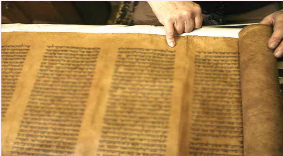
ספר תורה עתיק, מלפני יותר משבע מאות שנה

על פרשיות פתוחות וסתומות שבתורה, ומה הכוונה כאן של פרשה 'סתומה'? האם אכן יש כאן שתי פרשיות אלא שמטעמים שונים לא נכתב כך בספר תורה, או שהיה מקום לעשותה כעין שתי פרשיות, אך היא פרשה אחת? וגם, האם פרשת ויצא אף היא סתומה?