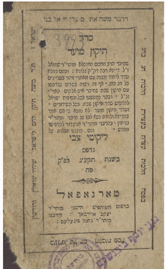
ספר תיקון מועד

זעען מיר באשיינפערליך אז ברסלב מיט סאטמער זענען בכלל נישט קיין סתירה חס ושלום, אדרבה, ווי מיר זעען האבן די הייליגע רבי'ס און צדיקים פון די סאטמערע גזע גאר מעריץ געווען און צוגעשטיפט צו זאגן דעם תיקון הכללי, און זיי