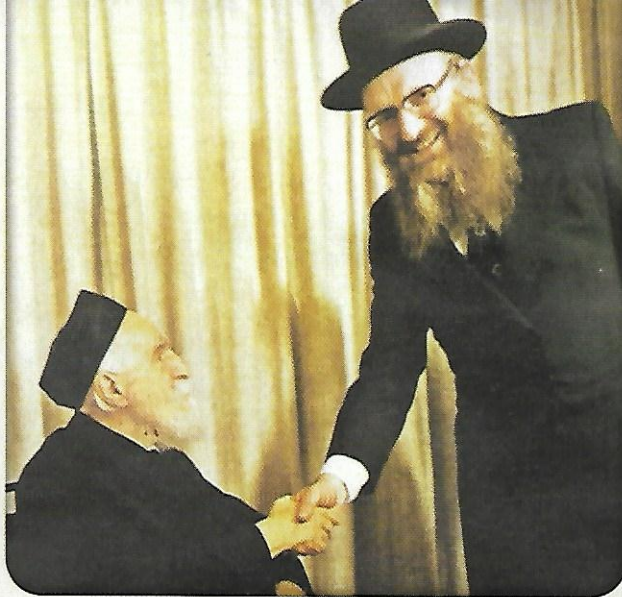
עם מרן הגר"ם פינשטיין זצוק"ל

ש"אם ידאו אותנו יוצאים יחד, מיד תתפשט שמועה בכל העיר שרבי מתתיהו מונה למשגיח בפנינו..." לאחר שבא לליקווד, וגילו את כוחו העצום כשיחותיו המעוררות שהיו בנריות לתפארה בהתבוננות עמוקה בדברי חז"ל ודיוק לשונותיהם, שאלוהו מתי יש לו זמן להכין את כל זה בתוך סדר יומו העמוס, והוא השיב שהוא כבר מכין שלושים שנה... (כשכוונתו לשלושים שנה ששימש כמשגיח בגייטסהעד).