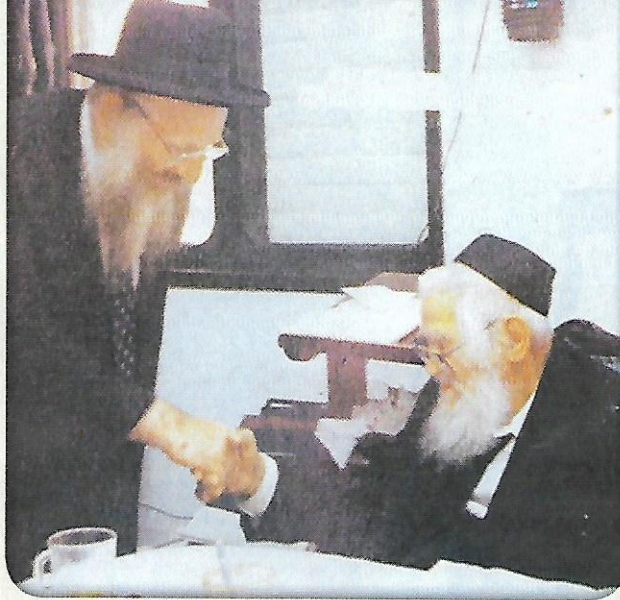
בבית רבנו הגדול מרן הגרא"מ שך וצוק"ל

הערת המערכת: בשל קוצר הזמן והמקום, נגענו בשבוע זה רק ברמותו התורנית והמוסרית של המשגיח זצוק"ל. יריעה מיוחדת על אודות שלל פעליו למען כלל ישראל, קרובים ורחוקים, תופיע בס"ד לקראת השלשים לפטירתו. ת.ג.צ.ב.ה.