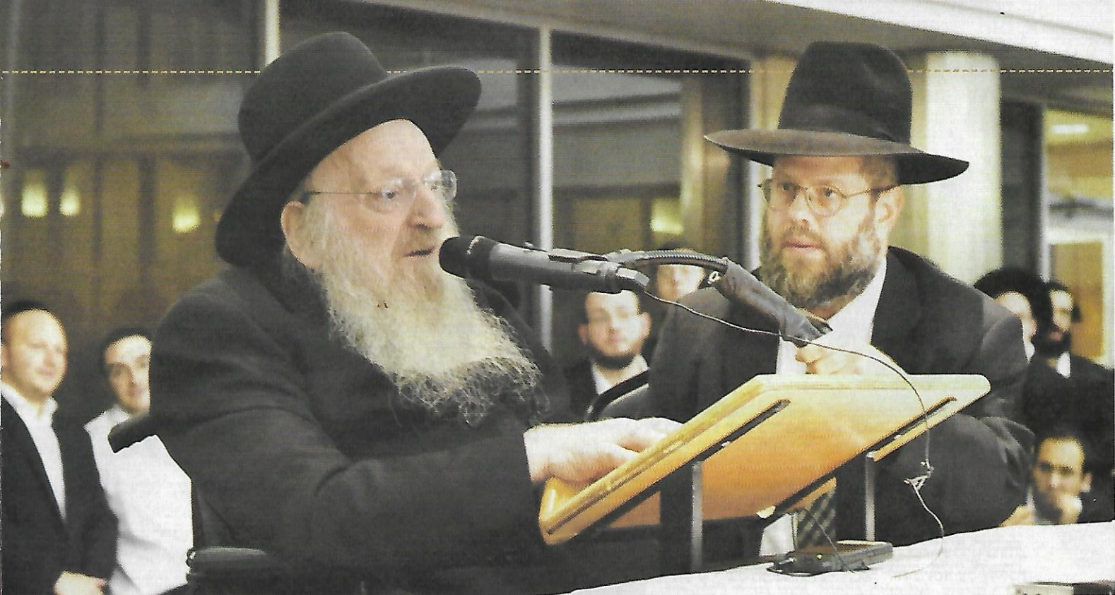
מוסר שיחה בישיבת לייקווד, בשנותיו האחרונות

המשגיח שמע על זה וכל השבת הוא בכה. ומהשבוש שלאחר מכן, הוא החליט לדבר בין קבלת שבת למעריב על הנושא של שבת, קבלת שבת, וזמירות שבת. ובמשך כמה שנים הוא דיבר על זה, והכל בעקבות "האסון הנורא" - מה שקרה באותה שבת שאוטובוס הגיע אחרי כניסת שבת. הוא הנחיל לנו שישבת זה לא סתם יום. ובאמת בעקבות אותן שיחות כל התפילות של שבת השתנו, וכל האווירה בישיבה בשבת וכל קדושת השבת בלייקווד - הכל השתנה.