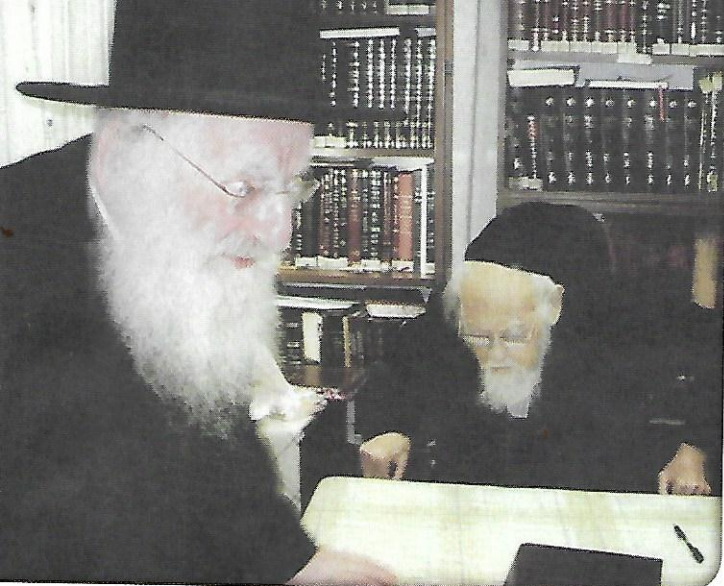
בביתו אצל רשכבה"ג מרן הגר"ש אלישיב זצוק"ל. בתמונה נראה מרן זצוק"ל מתאמץ לקום ממקומו לכבוד המשגיח זצוק"ל

ודיבר איתו הרבה זמן עד שעזר לו, ובסוף אותו אדם בעצמו הצטרף לועד. כך היתה עבודתו לדומם כל אחד ולחזקו.