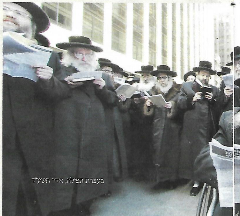
בעצרת תפילה, אדר תשע"ד

והנה סיפור נורא שהתרחש עמו באחד מביקוריו בארץ. הוא עמד לנסוע לקברי צדיקים בצפון, ובטרם החלו בנסיעה עמד לומר תפילת הדרך, והציע לנהג - שלא היה שומתומ"צ - שאולי יאמר גם הוא, אך הנהג טען שהיום לא זקוקים להתפלל כי לא מצוי חיות רעות וכל כיו"ב.