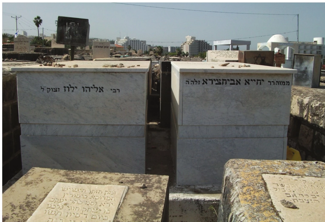
מצ"ק רבי יחיא אביחצירא בסמיכות למצ"ק רבי אליהו ילזו

שנת תרצ"ח יום כ"א לחודש אייר רבי יחיא אביחצירא יוצא מביתו לקנות לחם 58 ערבי תושב צפת שהיה מוכר תורמוסים קפץ על הרב ודקרו בסכין. בעודו פצוע הצליח להגיע לביתו ומשם הובהל לביה"ח שם שהה עד שנשבש"מ כיומיים לאחר מכן ביום כ"ד לחודש. כל אותו העת ששהה בביה"ח שהה עמו חתנו יצחק (חאקי) בטאן.