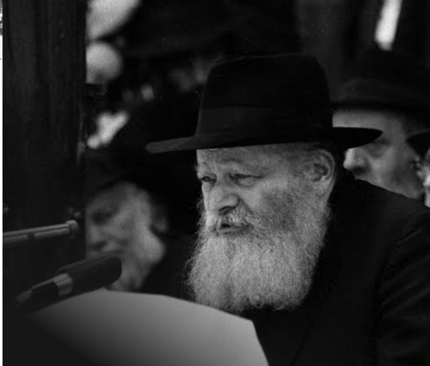
נשואב צועקים. כ"ק אדמו"ר מליובאוויטש ז"ע במשא קודשו בבית מדרשו

"חוסר האמונה בדרכנו הוליד את גישת ההתגוננות והרתיעה מלהצטייר כתוקפנים, ובגלל גישה זו המערבת צידוקים מדיניים נשפך כמים דם יהודי, כאשר ההיסטוריה חוזרת על עצמה בדיוק מצמרר. לאחר מלחמת יום הכיפורים דיבר הרבי רבות על כך שימים ספורים קודם המלחמה הגיעו ידיעות שהצד השני (מצרים וסוריה) עורך גיוס כללי, ולמרות זאת לא אישרו בארץ לגייס את הכוחות שאמורים להגן על ארץ ישראל, עד כדי כך שבערב יום הכיפורים הייתה ידיעה ברורה שאם לא ירתיעו אותם – המלחמה תחל ביום הכיפורים. מומחי הביטחון הביעו את דעתם בפירוש שאם רוצים למנוע מלחמה ולחסוך בקרבנות, הדרך היחידה היא לגייס את הכוחות מיד ולפעול להגנת ישראל, אך המדינאים סירבו לעשות זאת כדי שלא להצטייר כתוקפנים. ההיסטוריה חוזרת על עצמה רח"ל, כאשר אנחנו מגיבים ומתגוננים לאחר מעשה ולא פועלים לכתחילה כדי להגן ולמנוע שפיכות דמים".