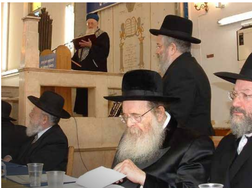
למען ציון לא אחשה. כנס ועד הרבנים 'פיקוח נפש'. שני מימין: האדמו"ר מסדיגורא זצ"ל. נואם: הגאון הרב מרדכי אליהו זצ"ל