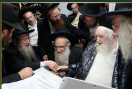
הגאון רבי יצחק סורוצקין חבר מועצג"ת בארה"ב ודיש מתיבתא דליוקווד