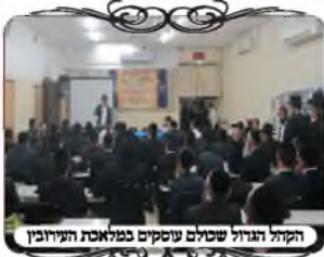
הקהל הגדול שכולם עוסקים במלאכת העירובין

הגאון רבי ישראל דז'מיטובסקי שליט"א, בעל מח"ס מחנה ישראל על עירובין ותחומין, הרחיב בענין שילוב מחלקת התחומין והעירובין, במיוחד בעיר ירושלים. דבריו יובאו א"ה בגליון הבא. אחריו הגאון רבי משה ברלין שליט"א, נשא דברים בדין תחום שבת, בדברי החזו"א, ובהוראה שמרן הגר"ש אלישיב זצ"ל הורה לו בנוגע לירושלים. עוד דיבר בשבח המהפך והשינוי שהתחולל בשנים האחרונות בזכות הפעילות של מוקד העירובין, שפעם העוסקים בעירובים היו אנשים בעלי מלאכה, והיום הם בעלי הלכה. פעם לא היה לעוסקים בשטח את הידיעה בהלכה, אלא מה שהאחראי היה צריך זה דים טובות לעשות ולתקן מה שצריך. והיום העוסקים בקיאים ממש בעירובין, מי שאחראי בעירובים השכונתיים זה אברכים שמשקיעים בלימוד ההלכות ומוסיפים עוד הידורים בעירובים, זה מהפך גדול. ואכן שמתאספים יחד ללמוד עוד הלכות, ועוד פתרונות, זה מוסיף עוד בכשרות אם כן שיהיה לכולם סייעתא דשמיא, ושכל אחד ימצא עוד מקום שיוכל לתקן אותו ולהכשיר אותו, ויהיה זכות הרבים לכל אחד ואחד.