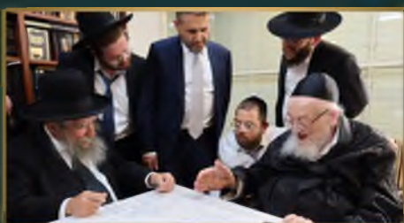
מרן הגר"א פילץ ר"י תפרח