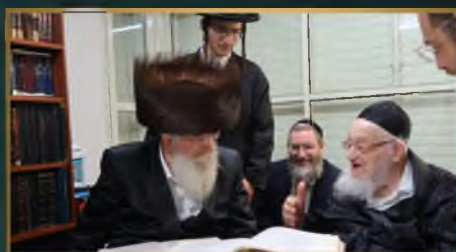
הגאב"ד הגאון הגדול רש"א שטרן שליט"א