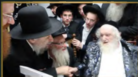
הגאון רבי יצחק קולדצקי