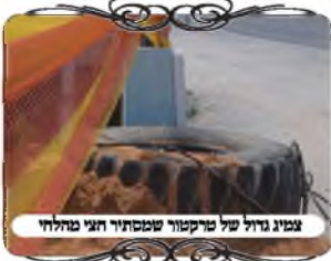
צמיג גדול של טרקטור שנסחף חצי מהלחי

והנה דבר ראשון אם זה דבר ארעי, אינו פוסל כלל, אלא הוא כמו חפץ שמונח בפתח, שגם אם הוא גדול אינו פוסל. אבל כיון שמדובר בגלגל הרוס שיכול להישאר במקום עוד כמה חודשים, יש אומרים שנחשב קבוע ויכול לעשות בעיה לכשרות העירובין. דבר שני, יש לבאר מאיזה סיבה הוא יכול לפסול, ויש בזה שני נושאים. א. משום מחיצה תחת הצוה"פ. וזה לא היה במקרה זה, כי גובה הגלגל השוכב הוא פחות מ"ט טפחים. ב. משום שאין קרקע ד' טפחים לפני הלחי, כי הרווח שבין הלחי לגלגל היה רק כעשרה ס"מ. והנה שורש הבעיה שאין ד' לפני הלחי, [במקרה זה שיש שטח ד' פנוי מעל הגלגל, והלחי מתחיל מהקרקע