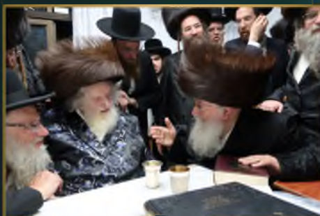
הגאון רבי שמואל אליעזר שטרן גאב"ד שערי הוראה