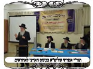
הגר"י אפרתי שליט"א בכינוס הארצי לאחראים

במעמד השתתף רבינו הגאון רבי יוסף אפרתי שליט"א, ועוד כמה צריכים לחזק את העירובים השכונתיים, כי לולא זה בערים הגדולות אין חיינו חיים, לא היו חיינו חיים, במי שמוציא דבר בשבת וגולל את ההסטוריה עם מרן הגר"ש אלישיב זצ"ל, מה הוא אחז על העירוב הכללי, כשהיו שואלים את מרן על הענין האם אפשר לסמוך על עירוב, שכמובן נסמך על השיטות שצריך שישים ריבוא, אבל בזה עוד יש על מה לסמוך כמו שכתב המשנ"ב (סי' שמ"ה ס"ק כ"ג). הדבר שמרן היה חוזר עליו, שהבעיה היום היא השכירות, מכיון שיש בעיר גוים ואנשים שאינם שומרי שבת, בשנת תש"ח חתמו שכירות משר הביטחון הראשון, אבל אחר כך שהשתנו החוקים (משנת תשנ"א), היה אומר שהשכירות הזו אינה יכולה להתיר. וכאשר ניסו לשאול אותו על שעת הדחק, הדבר היחיד שמצא אולי לגבי נשים, זה שיטת הגינת ורדים המובא בבית מאיר (סי' שפ"ב), וגם זה מרן לא רצה להתיר. זה הדבר הראשון שכאב לו בענין העירוב בזמנינו.