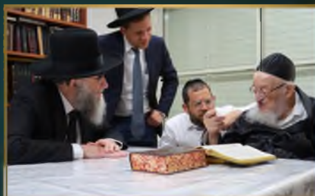
הגאון הגדול רב"מ אטינגר שליט"א ר"י כנסת יחזקאל