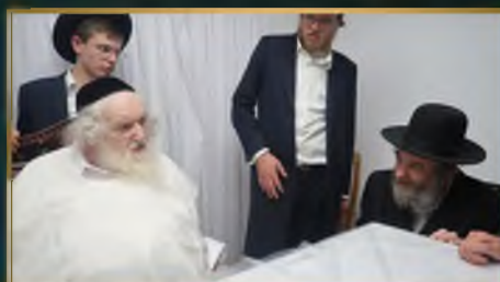
הגאון רבי משה מרדכי קארפ