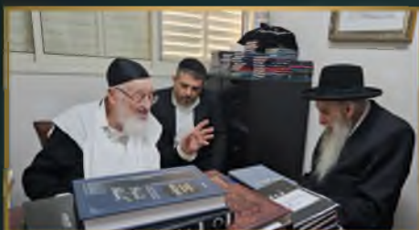
מרן הגר"א פלדמן שליט"א