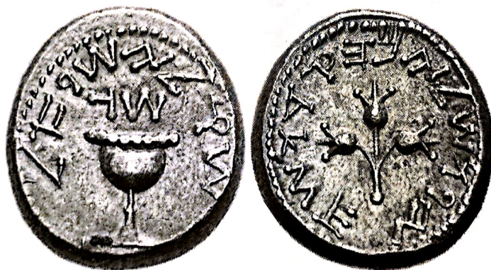
חצי שקל ממרד הגדול, שנה ג', "ירושלים הקדושה"

נירון קיסר נזכר כאחד מהראוותנים, המטורפים והאכזריים ששלטו ברומא מעולם. הוא הרג את אמו, את אשתו הראשונה, ויש אומרים גם את השנייה. נירון הודח בידי הסנאט בשנת ג'תתכ"ח - שנתיים לפני חורבן הבית. שנה לאחר מכן נקראת 'שנת ארבעת הקיסרים', על שם שמלכו באותה שנה ארבעה קיסרים: בתחילה מלך גלבה, שנהרג לאחר כמה חדשים, לאחריו מלך אדם בשם אותו, שהפסיד בקרב לויטליוס ואיבד את עצמו לדעת, לאחר מכן מלך ויטליוס, אך הוא הובס על ידי אספסיאנוס ונהרג, ואספסיאנוס הומלך. חז"ל מספרים (גיטין נו: איכ"ר א לא), כי אספסיאנוס הומלך בהיותו בארץ ישראל, אמנם עברו עוד מספר חדשים עד שניצח את ויטליוס והוכר למלך על ידי כולם.