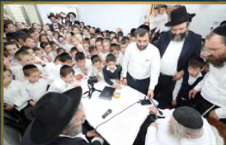
ת"ת דרכי אבותינו במודיעין עלית