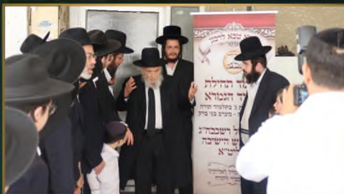
תלמידי ת"ת 'עטרת שלמה' במעונו של מרן רבינו ראש הישיבה הגרמ"ה הירש שבידכם להצלחה בלימוד וסייעתא דשמיא עם תחילת הקיץ