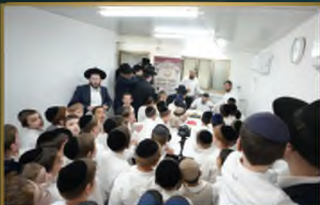
ת"ת עטרת שלמה מערב בני ברק