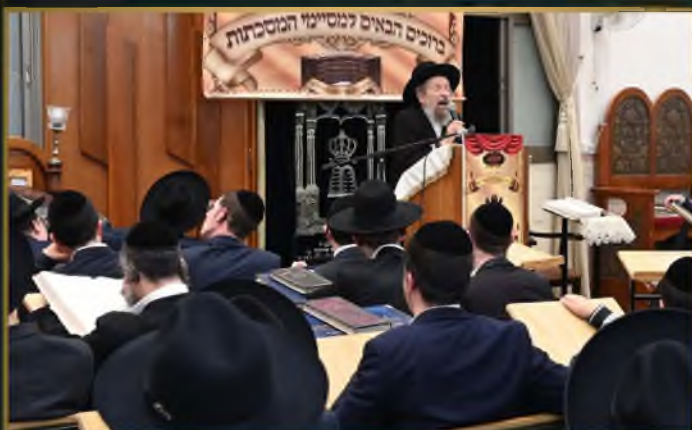
מעמד הסיומים ישיבת הר"ן ביתר עלית בין הזמנים נסן תשפ"ד