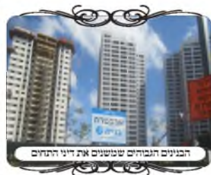
הבנינים החדשים שמשנים את דיני התחום

אך פתאום היום נזכר שיש בזה איסור תחומין, כיון שהכלים של האדם הם כרגליו, דהיינו שגבול התחום שלהם הוא כפי מה שמותר לבעלים שלהם, וכאן שהמבקר עשה עירוב תחומין להגיע אל בית החולים [או שביה"ח נמצא בתוך גבול התחום של