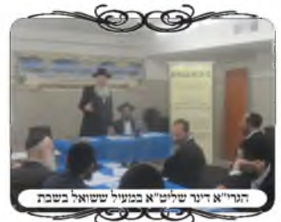
הגאון דינר שליט"א במעיל ששואל בשבת

הפעם אל תפספס! עכשיו ההצטרפות לשיעורים על עשיית העירובים בזמנים