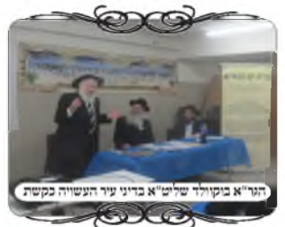
הגאון בוקולד שליט"א בדיון עירוב העשויה בקשת