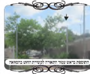
התפתח דאש עמוד התאורה לקשירת החוט בחסוואר