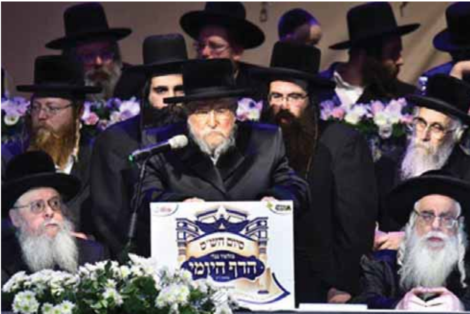
רבינו נואם במעמד סיום הש"ס שני אנגרות ישראל בעיה"ק ירושלים

בתפילת נשמת: 'ומבלעדיך אין לנו מלך עוזר ומושיע פודה ומציל מפרנס ועונה בכל עת צרה וצוקה אין לנו מלך אלא אתה'. ופירש אא"ז זיע"א שאין הכוונה שיש זמנים כאלה של צרה וצוקה שאז פודה אותנו השי"ת מכל צרה, אלא באמת הוא 'בכל עת צרה וצוקה', תמיד בכל יום ובכל רגע הוא עת צרה וצוקה ועומדים עלינו אויבנו לכולתנו, רק שהקב"ה מצילנו מידם. ע"כ. והנה גם זה צריך