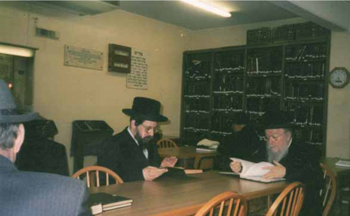
כ"ק מרן אדמו"ר מבאיאן שליט"א משתתף בשיעור משנה ברורה אותו מסר הרבי זיע"א בכל יום בין מנחה למעריב בתור רב הקהילה

אכן "לא נגעה מלכות בחברתה", כפשוט ממש... היות והסדר היה, שבהיותו במקום מגוריו בלוגאנו, לא נהג ברבים ב'רעבישע גינונים', ולא היה מוקף בגבאים, וכדומה. בסעודה שלישית היה שולח שיריים ו'לחיים', ובמיוחד לאורחים, ואז היינו טועמים קצת מהרעבישקייט... והאמת שבדברים הנוגעים בינו לבין עצמו היה נוהג בגינוני קודש, כדרכם של צדיקי קמאי. היו תקופות שהרב זצ"ל היה היהודי היחיד