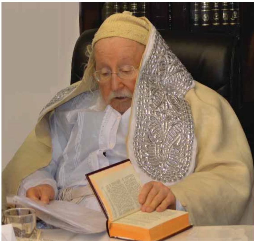
מאימת הדין בחלה נפשי. רבינו בערב יום הקדוש

הרבי זצוק"ל הוכתר לרבי בשלהי חודש שבט, ובחודש סיון התקיימה שמחת נישואי בנו הרה"צ רבי דוד מאניש שליט"א, מרן הגרי"ש מאוד רצה להשתתף בשמחה, אך מפאת שקשתה