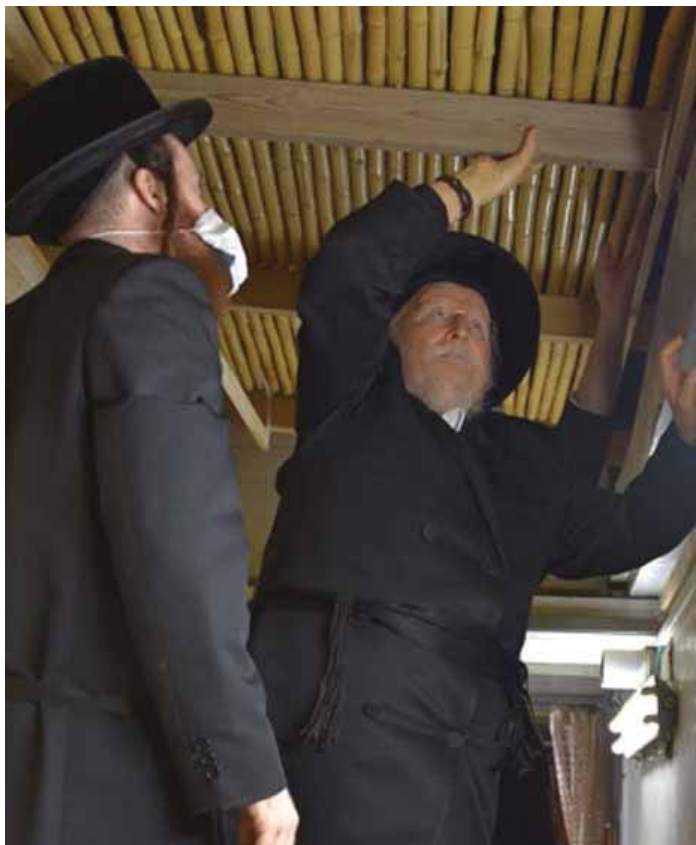
עבודת עבודה. רבינו מסבך את הסוכה