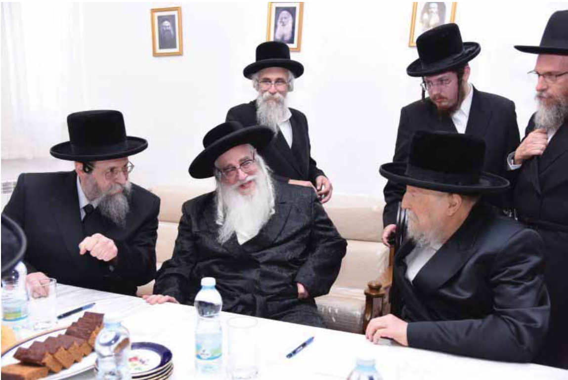
עם כ"ק מרנן האדמו"ר'ם מצאנז ובאיאן שליט"א בכינוס מועצת גדולי התורה שהתקיים בביתו סיון תשע"ט

העומדים עלינו לכלותינו בכל עת, וכפי שבארנו. ובעת כזאת מי שאינו עוזר את ישראל, ואומר שלום עלי נפשי מה לי בטורח הציבור וכו', אינו אלא טועה, ורח"ל מתקלל ומנודה בארבע מאות שופרי רח"ל, דהלא התורה הקדושה היא נצחית ומה שהיה בעבר הוא לנצח נצחים, וכדוגמת המועדים שלנו, וכן הוא בזה העניין. ומובן ממילא כי מרובה מידה טובה כמה שכר טוב זוכים בעת שבאים לעזרת ה' בגבורים, ומסייעים בידי העוסקים במלאכה, ועושים כל אשר ביכולתם לטובת הציבור, ולהעמדת הדת על תילה.