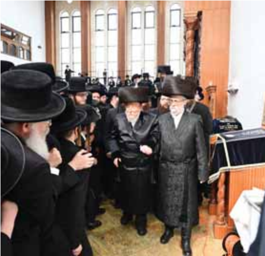
עם להבחה"ח כ"ק מרן אדמו"ר מסערט ויוניץ שליט"א

"פעם, אמרתי לפני זקני את הדברים האלו שאמר בשם חותנו הנ"ל, והוספתי לומר שאכן אנשים מדברים על זה שהוא לומד כל הזמן ואין להם חשק להפריעו בשעת הלימוד. אבל תשובתו היתה: 'הרי יש לי זמנים מיוחדים לקבלת קהל'... כלומר, אכן הוא לומד כל היום ומפריע לו שאנשים מגיעים באמצע לימודו להפסיקו בדברים שונים, ולכן באמת הקדיש זמנים מיוחדים