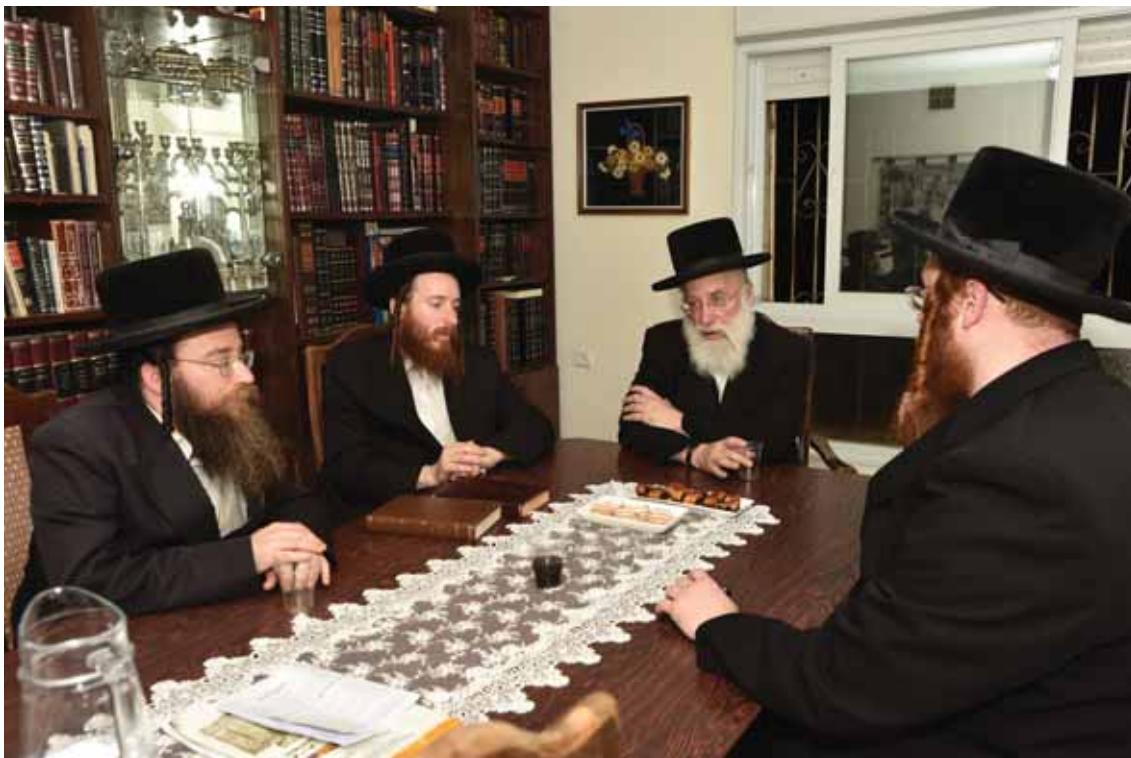
ברב שיח המיוחד בבית חדב"נ הגאון רבי אברהם יצחק ווייס שליט"א

תודש מלא כבר חלף ועבר ביעף. אכן היינו כחולמים והדבר נראה כבלתי ייאמן, אבל אנו עומדים בערבו של יום ה'שלושים' מהסתלקות האי רעיא מהימנא, מגדולי המנהיגים שעמדו לישראל בדורנו, עמוד האש אשר הלך לפני המחנה להאיר לילות כימים את עולמנו השפל באור תורתו ובזיו קדושתו, כ"ק מרן אדמו"ר בעל 'מבשר טוב' וצוק"ל מביאלא, שהסתלק מאיתנו לדאבון לב ולמגינת נפש ביום המר והנמהר, יום ששי ב' אייר תשפ"ד. ויבכו אותו כל עדת בית ישראל כי ניטלה מהם דמות מופת יחידה תמה וגניקה, שהיתה שייכת במקורה לדורות קדומים ביותר, וניתנה במתנה מן השמים לשמש עבור דור עני זה לאספקלריה המאירה ולאורים ותומים בכל הדבר הקשה של הכלל והפרט, לשמו ולזכרו תאוות כל נפשות חסידי ומעריציו, הממאנים להינחם אחרי רועם הנאמן שהנהיג את עדת חבלו למעלה מ-40 שנה, כרחם אב על בנים וכאשר יישא האומן את היונק.