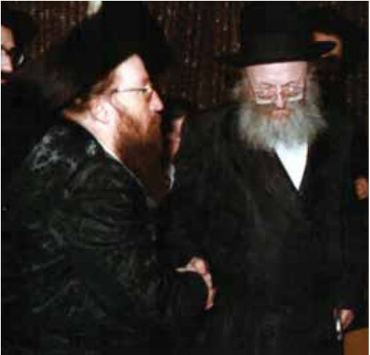
עם כ"ק מרן אדמו"ר ה"אמרי מנחם" מא"כסנדר זצ"ל

דין שם בלוגאנו, היה לוקח עמו עוד שניים מתלמידי החכמים של הקהילה, באמרו שזה בית דין חשוב לכל דבר.