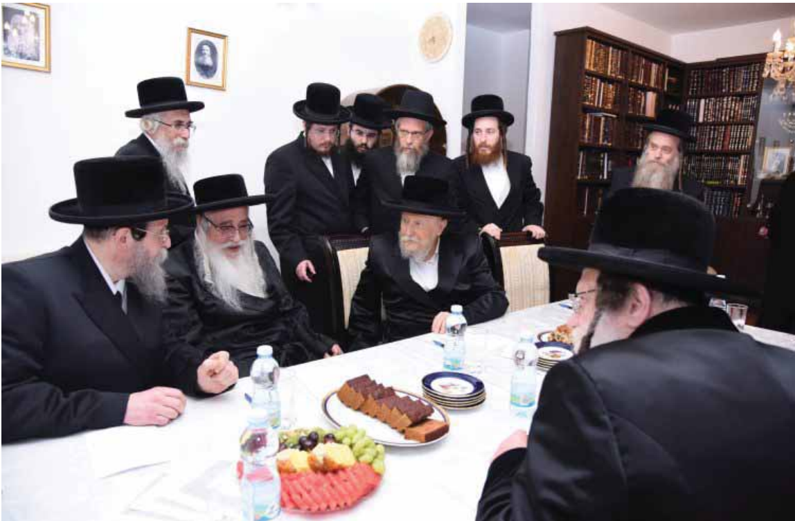
בכינוס מועצת גדולי התורה שהתקיים בביתו סיון תשע"ט עם כ"ק מרנן האדמו"ר'ם מצאנז, באיאן, מודיין שליט"א

"...כבר הורנו חז"ל כי גדול המחטיאנו יותר מן ההורגו, ולצערנו אלו רשעי בני ישראל היהודים החילונים האפיקורסים, עומדים עלינו גם כעת עתה לכלותינו, ולהשכיח דת תורתנו הקדושה וקיום מצוותיה מבני ישראל..."