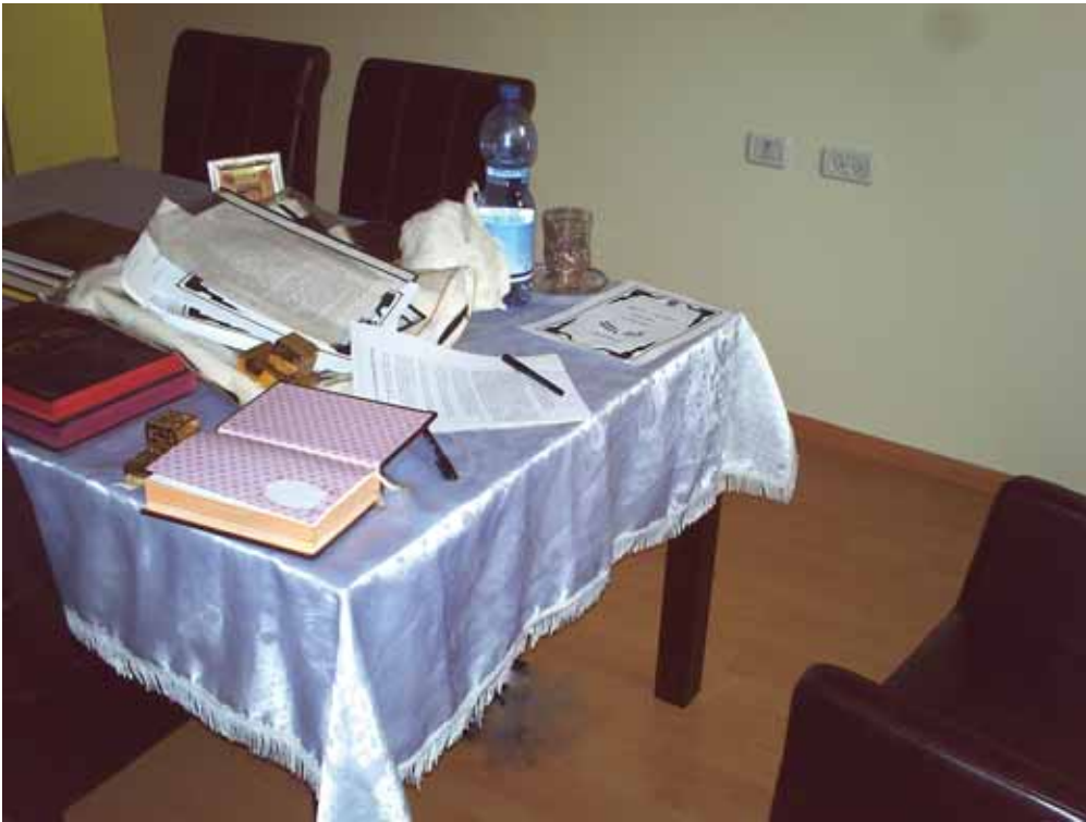
תמונה מלאה נענועים. כך היה נראה הדרו בעת שיצא לתפילה, העט מוכן והרפים עליהם כתב חידושי תורתו עומדים מוכנים

כוח כתיבתו נתגלה כבר בימי בחרותו בישיבת פוניבז' שם היה כותב את השיעורים של מרן הרב מפוניבז' זצוק"ל. והרב מפוניבז' עבר על מה שהוא כתב, והוסיף הערות, וכך נותרה