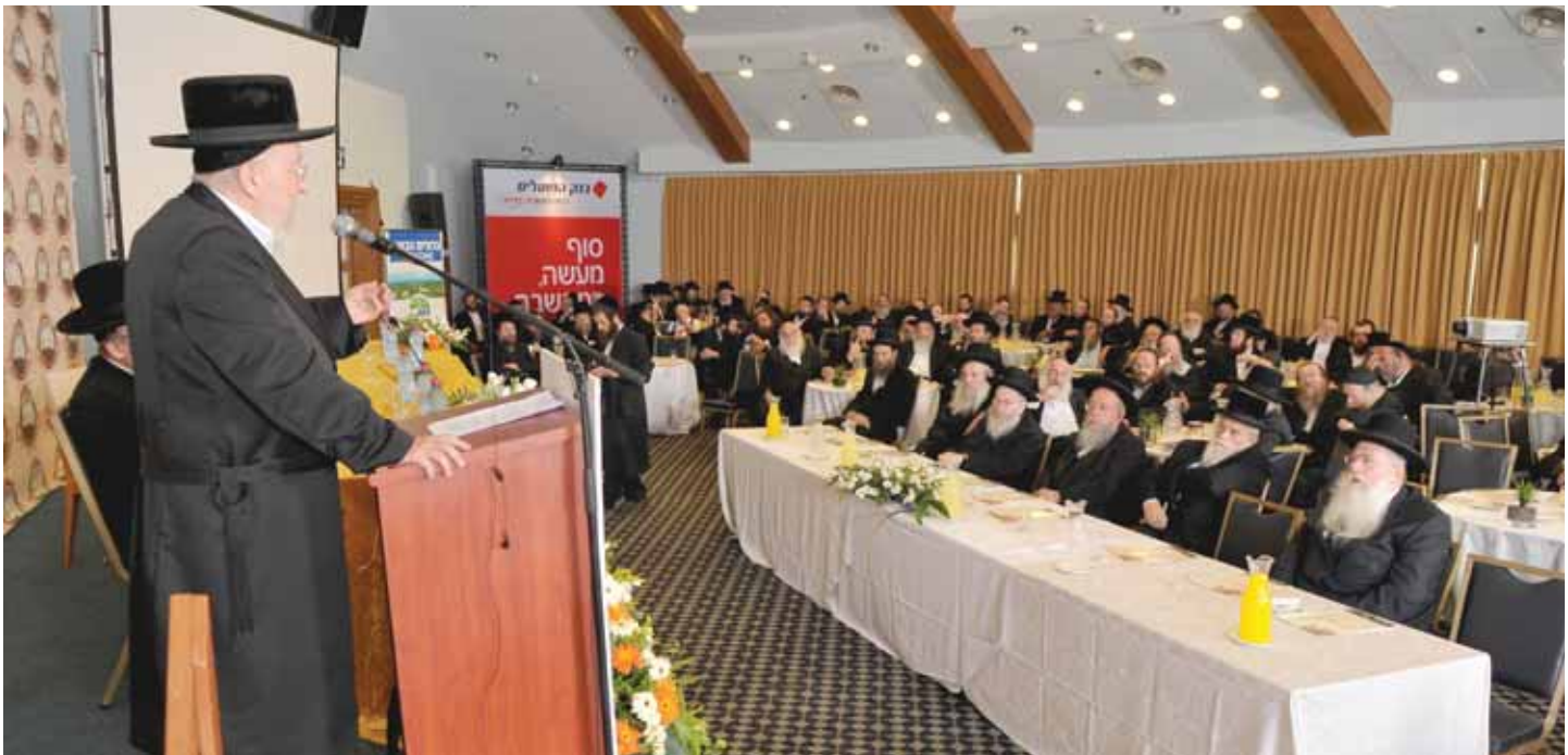
דרכיה דרכי נועם. רבינו משמיע מדברות קדשו לעסקני אגודת ישראל

"הדברים דומים לאותם המבקשים לחזק את שרירי גופם להוסיף גבורה על גבורתם, עיקר