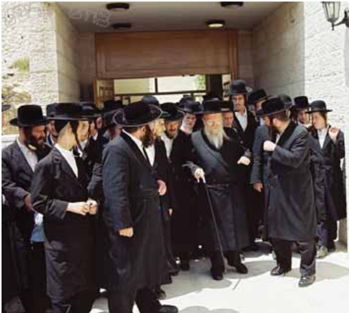
מוקף בתלמידים וחסידים שמתפללים אחרי השיעור