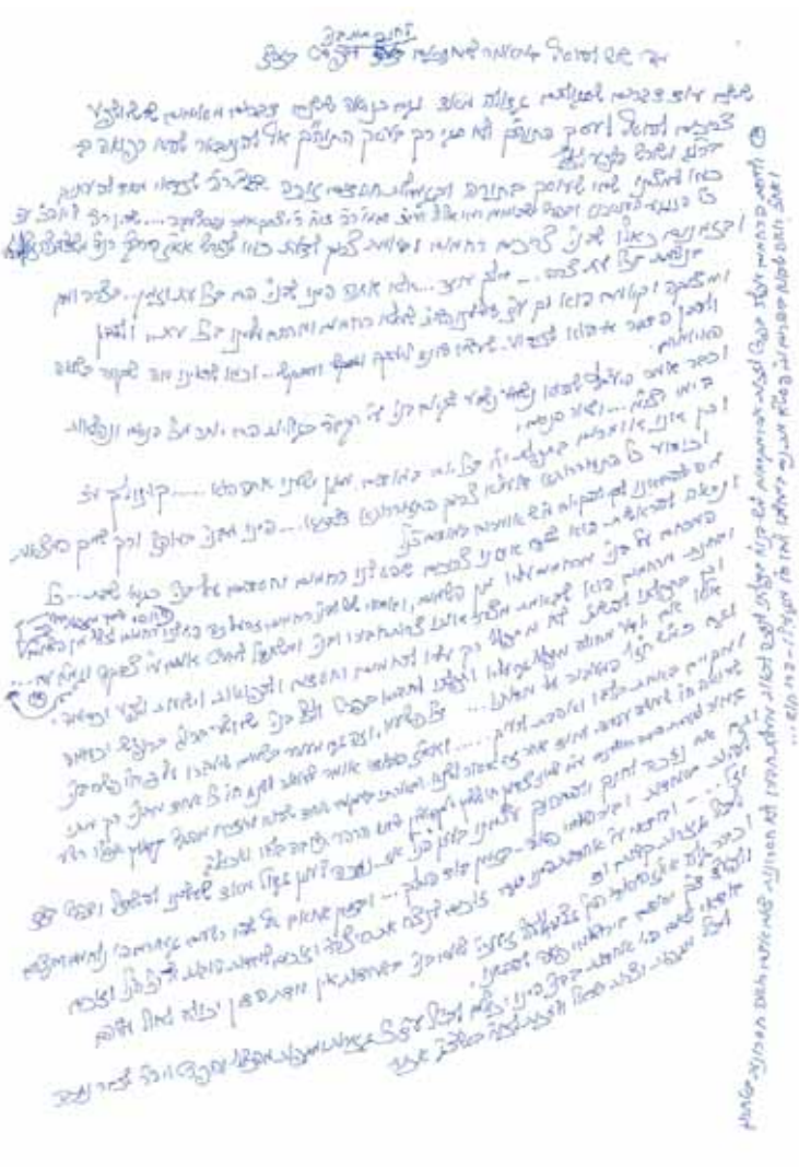
הוספה למאמר 'מחנכים

זכור לי שפעם, כאשר יצא מביתו שבשכונת סורוצקין ליד בית המדרש, לכיוון בית המדרש, נעמד לפתע ואמר, כמו מדבר לעצמו: "אוי שכחתה!" ואז חך בדעתו ואמר: "אין לזה טעם, יש כאן אנשים...". לאחר הרהור קל הוא פנה כמה פסיעות לצד הדרך, הוציא מכיסו עט ונייר וכתב כמה מילים. התברר שהוא "שכח" לכתוב חידוש שעלה בדעתו, וחשש שלא יישכח ממנו, אך מצד