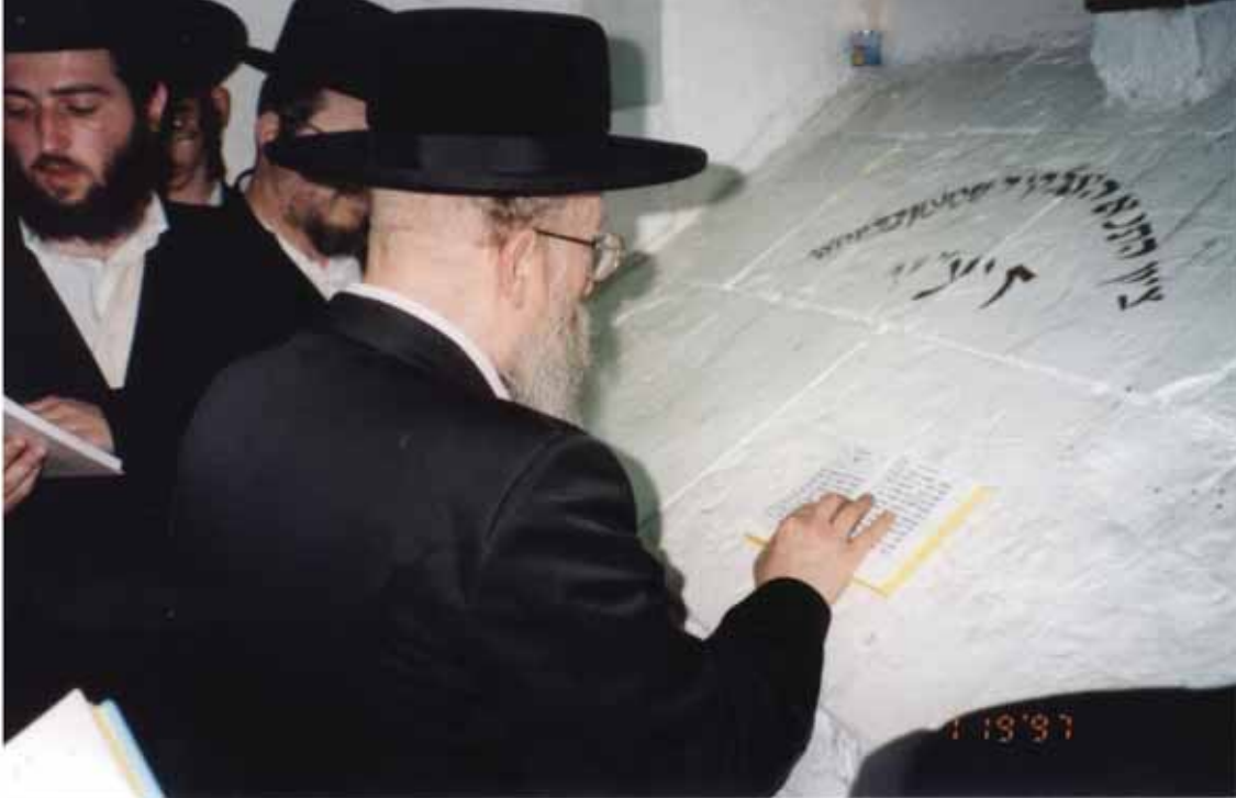
בציון התנא האלוקי רבי שמעון בר יוחאי

שיח נרגש עם הרה"ח ר' יחיאל אסתריון שליט"א - משמש בקודש מקדמת דנא אצל כ"ק האדמו"ר זצוק"ל