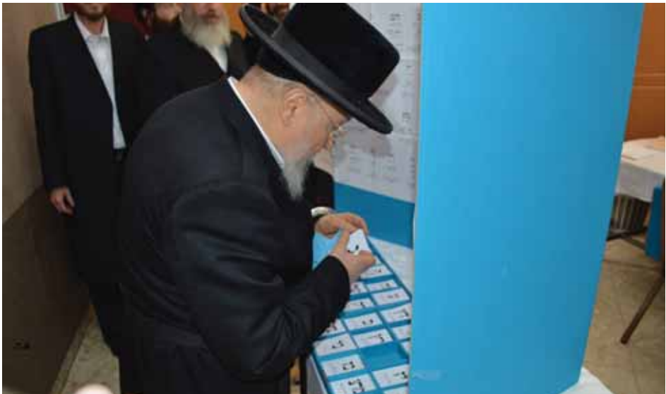
משתתף בהצבעה בבחירות

אך כפי שהקדמנו בראש דברינו, בכל מצב ועניין יש לנו להביט בתורה הקדושה לדעת המעשה והחובה אשר מוטל עלינו בעת כזאת. וגם בזה הורונו חז"ל דברים מפורשים, במסכת קידושין (מ ע"ב) נאמר: 'תנו רבנן, לעולם יראה אדם עצמו, כאלו חציו חייב וחציו זכאי, עשה מצוה אחת - אשרי, שהכריע עצמו לכף זכות. עבר עברה אחת - אוי לו, שהכריע את עצמו לכף חובה, שנאמר, (קהלת ט) 'וחוטא אחד יאבד טובה הרבה', בשביל חטא יחידי שחטא, אבד ממנו טובות הרבה. רבי אלעזר ברבי שמעון אומר, לפי שהעולם נדון אחר