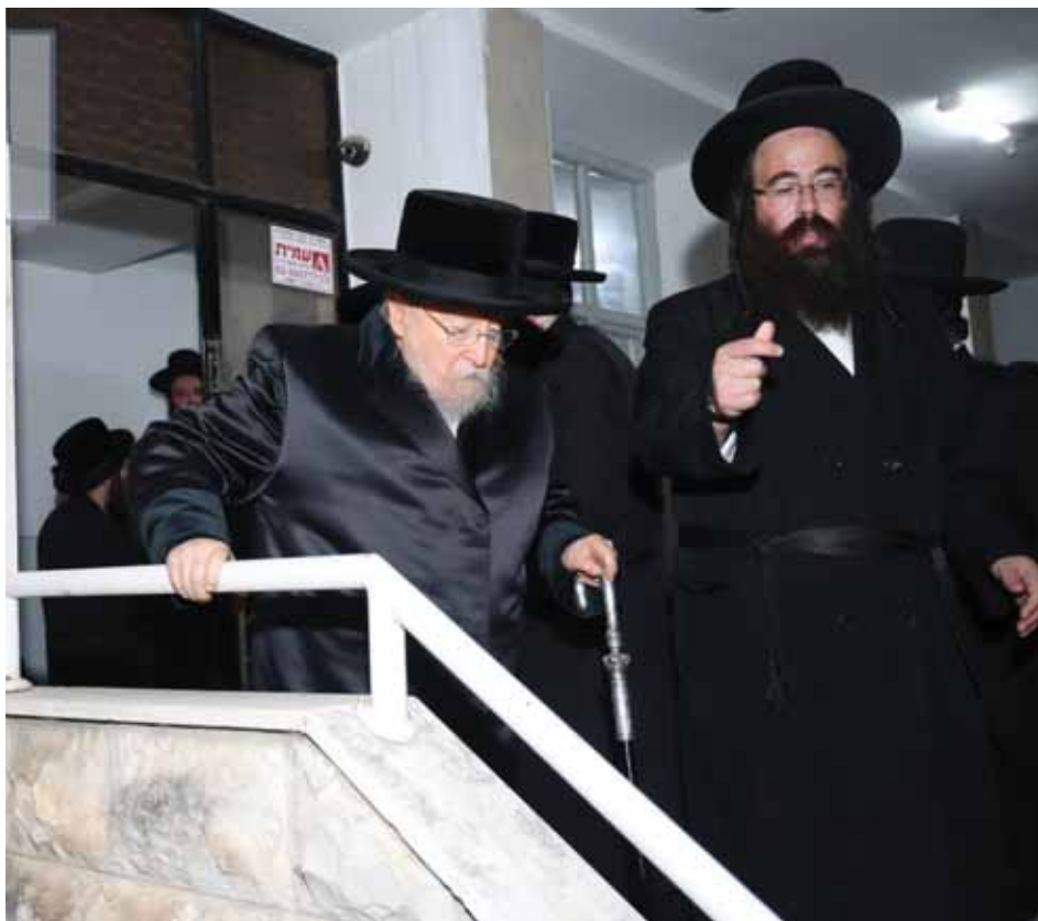
יוצא מכינוס מועצת גדולי התורה בפ"א תשפ"ג