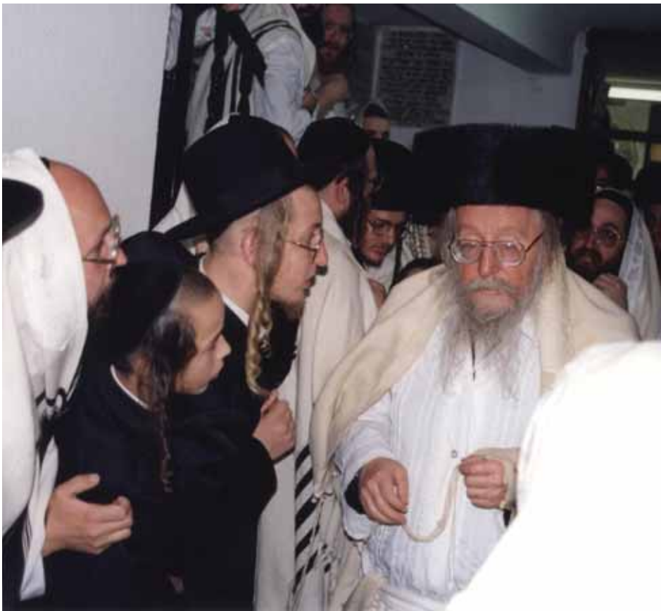
בצאתו מן הקודש. רבינו לביש קיטל

יש לנו לכל אחד ואחד את היכולת לזכות ולרשת את הכוחות של "כל חמודות שבעולם" כל הנקודות הנ"ל, להתאמץ שיהיו לנו קניינים. - "מתי יגיעו" בבחינת 'נגיעה' למעשיו של הצדיק, ונזכה במהרה לגאולת גואל צדק ולתחיית המתים במהרה בימינו אמן.