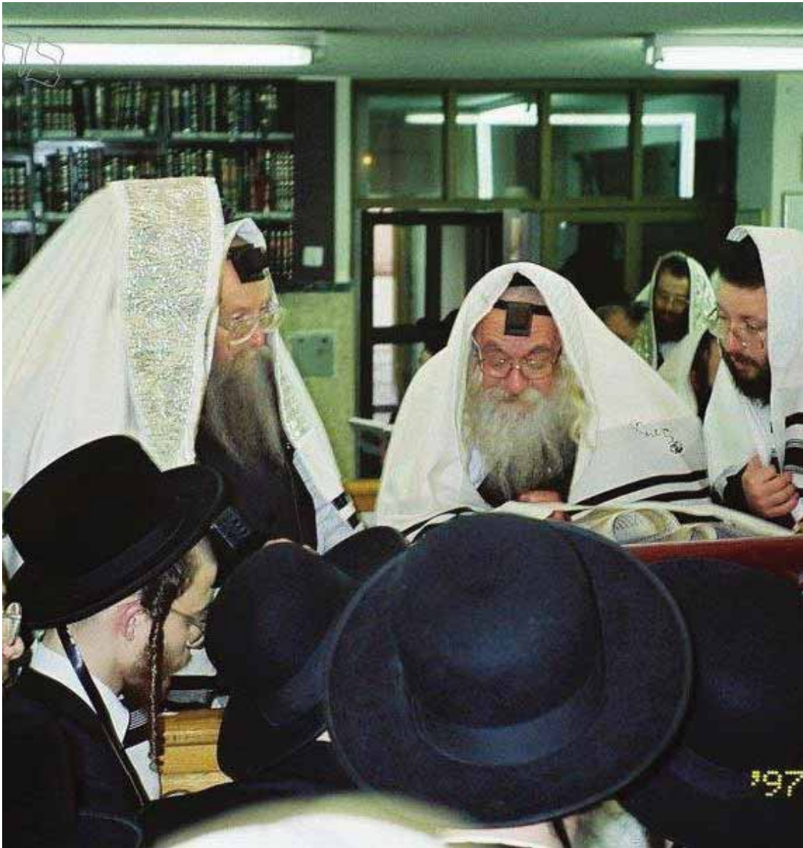
מדבר המלך ודתי. רבינו בקריאת מגילה