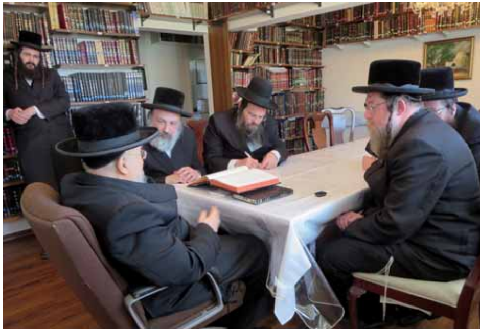
מבשר טוב לעמו. רבינו בשיח קודש ל"המבשר תורני

אם לא נכביד עליהם ביותר בבת אחת לדרוש מהם דברים שלמעלה מכוחותיהם, כך הם יצליחו ביותר ואף לאורך ימיהם ושנותיהם. אולם אם נדרוש מהם דברים שלמעלה מכוחותיהם, עלול הדבר רק להזיק ח"ו להתקדמותם ולבריאות נפשם הצעירה".