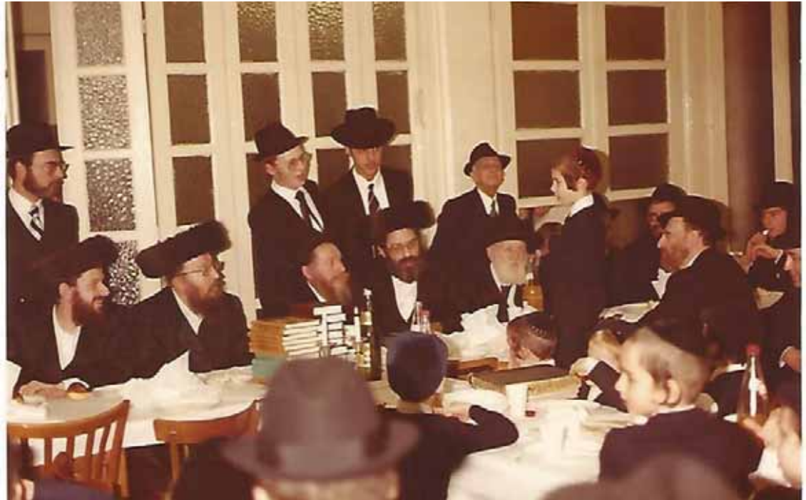
מבחן פומבי בלוגאנא הנובה תשמ"ג 1 - נראים רבים מתושבי העיר

זצ"ל על כך, נענה ואמר, שבעצם יש לו הרבה יותר לומר ממה שאומר בסעודה שלישית, אך היות ואינו רוצה לעכב את הציבור, הרי הוא מקצר בדבריו, ומשלימם אח"כ בטלפון... ענין מיוחד בפני עצמו היו ה"דרשות", בשבת הגדול ובשבת שובה. הרבי זצ"ל היה מחלק אותם לשלושה חלקים, את חלק ההלכה והדרוש היה נוהג לדרוש בשבת קודש