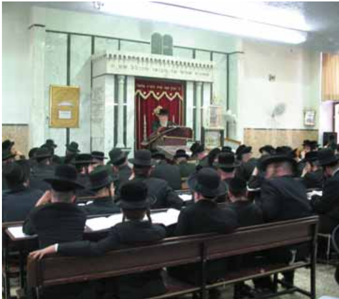
בישעור בישיבת בין הזמנים

עם הבחורים בבין הזמנים הוא רוצה שהכל יהיה רק ברוחניות".