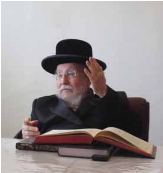
ארחות חיים. רבינו בשיחה להמבשר