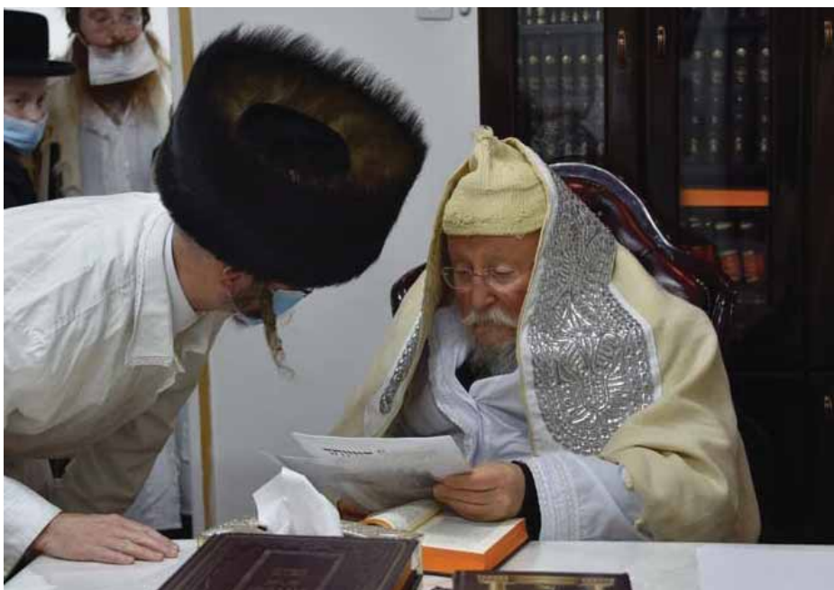
רבנו מעיין בקוויט"ש התורמים לקופת הצדקה של רבינו

"הרי כבר מראשית ימי הנהגתו בקודש של רבנו, היה מחלק בעצמו סכומי כסף נכבדים למשפחות מאנ"ש אשר היו זקוקים