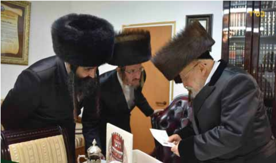
רבינו נותן צדקה לקופת הצדקה

"זכורני כשסיפרנו לפניו על פרויקט 'מזון ומחיה' שנותן מוצרי חלב בסיסיים למשפחות ברוכות ילדים, גברה שמחתו עד מאד, אבל בד בבד אמר שאין זה מספיק ומה יהיה עם בשר ודגים למשפחות אלו? כיום אכן הוספנו לתת גם בשר ודגים ב"ה, אבל רבנו כבר אז בתחילת הדרך ראה את הנולד ודרש לבצע גם זאת".