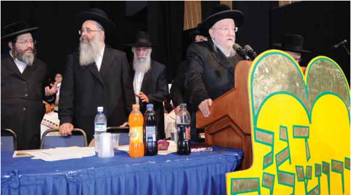
נושא דגל התורה. רבינו נושא דברים בכינוס' דגל ירושלים'

"מה שאין כן אם לא יתארגנו לכך מצד ההנהלה, יש צד גדול שיעשו את הדברים ללא השגחה רוחנית ראויה כל כך והדבר עלול להביא למכשולות ולפרצות חמורות ח"ו. וכמובן שכל זאת צריך לראות לעשות זאת במידה ובמשורה ובמשקל הראוי כפי הבנת ראשי הישיבה וההנהלה הרוחנית שבכל ישיבה עליהם ניתן וראוי לסמוך בדבר.