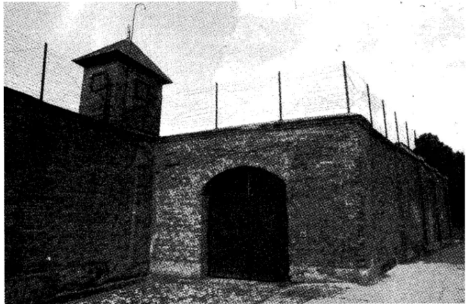
הפורט התשיעי - מבצר האימים בו עונו ונעקדו עק"ש יהודי "קובנא" ובהם מרן הגר"א וסרמן זצוק"ל הי"ד.

רציתי לסיים את מכתבי בפסקה נופת, שכתבתם על מרן בעל הדבר אברהם 'זצוק' שכאשר הנאצים, אנשי הגסטפו, דרשו ממנו להקים את היודען