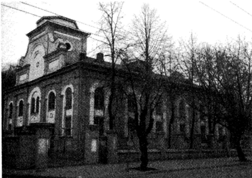
בית הכנסת המרכזי בקובנא

וכאן התעוררה בעיה קשה. בשנה הראשונה של הגיטו היה רעב איום ונורא. אם עבדו בעבודות אחרות