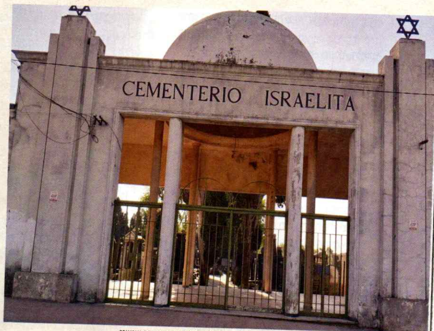
בסוף העולם. בית הקברות של הקהילה היהודית במונטווידאו בו קבור שושני