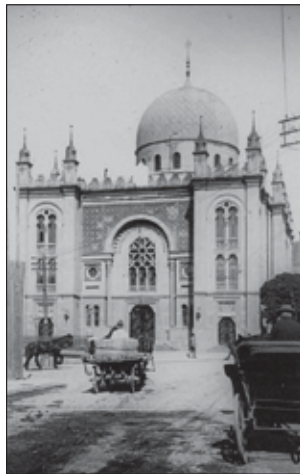
בית הכנסת בטשרנוביץ