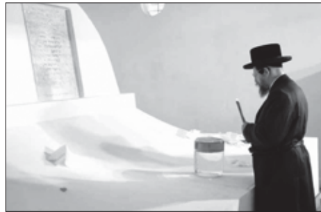
ציונו של הרה"ק מרוז'ין זי"ע כפי שהוא נראה היום

בטון בעזרתו יצרו כיפת בטון ענקית שכיסתה על ציון הרבי ובני משפחתו. כיפה זו נותרה חסינה ומנעה מהרוסים להמשיך ולהתנכל למקום. עד היום הכיפה הזו מכסה את הציון, כפי שאפשר לראות בברור בתמונות.