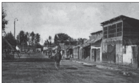
רחוב טיפוזי בג'לאבאד - העוני בולט לעין

לתת אותם למי שיאות ללמד את ילדיה. עבור הבחורים, שהתמודדו עם מצוקת רעב תמידית, היו תלושים אלו משמעותיים מאוד. לבסוף, נשאו מאמציה פרי, ומספר