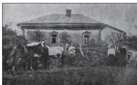
צריפי מגורים בקולחוז

אחותה של סבתא ניסתה לשכנע אותה שבמקום כזה אפשר לחיות חיים יהודים כמעט רגילים. בקולחוז המדובר התקיים מניין קבוע, והחברים הדתיים נמנעו מלעבוד בשבת,