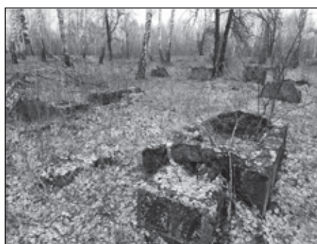
בית העלמין בצ'יפוביץ

ביום ראשון אספה את עצמה והלכה לבית הקברות היהודי, שם עלתה על קבריהם של הוריה. היא מצאה שם קבר אחים של