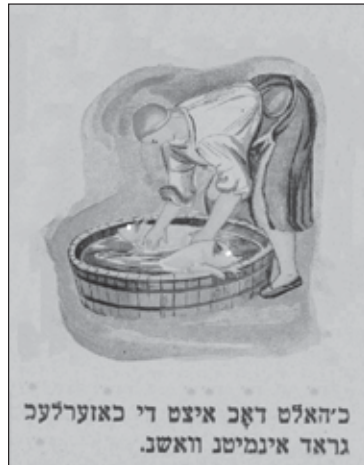
תמונה מזעזעת מתוך חוברת הכתובה באידיש ובה הדרכה לגידול "דבר אחר" בקולחוז יהודי

חוברת הדרכה לגידול "דבר - אחר". בחוברת מופיעה תמונה מזעזעת ודוחה של נערה הרוחצת "דבר - אחר" וההוראות המצורפות אליה כתובות ב- אידיש! (מטרת החוברת היתה כמובן 'לחנך' ולעצב מחדש את יהודי הקולחוז וילדיהם)