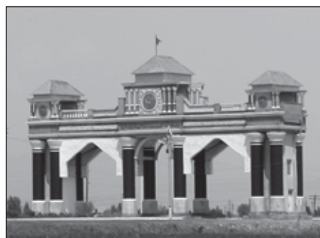
שער העיר ג'לאלאבאד

מדובר היה בקבוצת בחורי ישיבות בוגרי ראדין וישיבות נוספות; ביניהם היה גם הסופר הידוע ר' דוד זריצקי, ועוד רבנים ליטאים גדולים ומפורסמים. היו אלה פליטים שברחו מפולין, לאחר שזו נכבשה ע"י הגרמנים בשנת התרצ"ט (1939). כשהגיעו הפליטים לרוסיה, ניתנה להם האפשרות לבחור באזרחות סובייטית. אלו שסירבו, נשלחו לסיביר, כמו כל אזרחי החוץ.