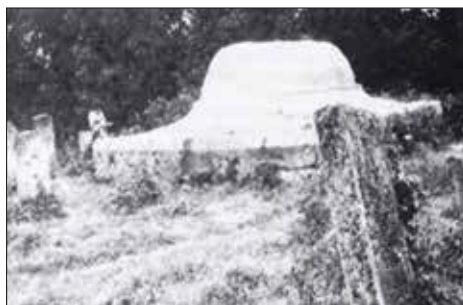
ציונו של הרה"ק מרוז'ין לאחר יציקת הבטון

המלווים, שהדדעזעו למראה עיניהם, ביקשו לכבד את ציון הרבי וניסו מספר פעמים לבנות אהל על הציון. אך הרוסים התנכלו אליו והרסו אותו פעם אחרי פעם.