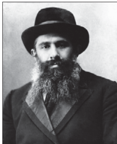
ר' חיים יצחק מלויב טשרנוביל זצוק"ל במיטב שנותיו