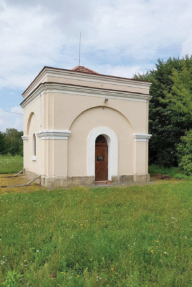
אוהל ציון הקדוש של רבינו הרה"ק ה'בית אהרן' מקארלין זי"ע