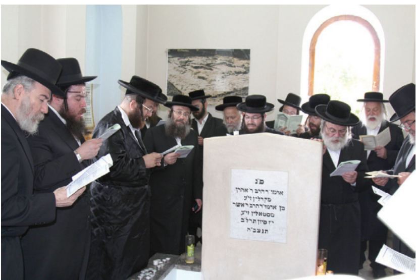
מקום ישועות. חסידים ואנשי מעשה בתפילה על יד ציונו הקדוש של הרה"ק 'יבית אהרן' מקארלין זי"ע בעיירת מלינוב

■ מתפרסמת לראשונה בקובץ הנודע 'בית אהרן וישראל' לקראת יום ההילולא טו"ב סיון