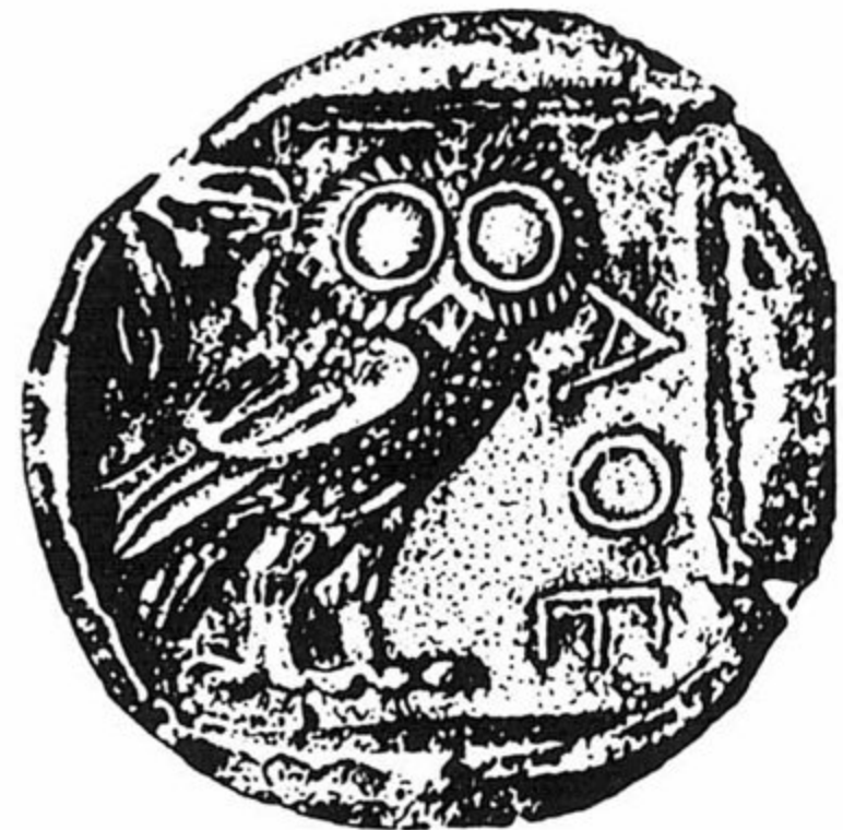
מטבע-כסף אתונאית משנת 470 לפני סה"נ בערך מצד אחד: דמות ינשוף, סמלה של אתיני בתוספת האותיות AΘE כקיצור שם העיר; מצד שני: ראש אלת העיר אתיני.

האימפריה האתונאית היתה אימפריה של הדימוקראטיה האתונאית. תועלת כלכלית ויתרון פוליטי צמחו ממנה בעיר לאותן השכבות, שעליהן נשענה הדימוקראטיה האתונאית. השכבות, שנהנו טובת-הנאה עיקרית מן הרווחה הכלכלית, היו הסוחרים, בעלי-המלאכה, ספני הצי המסחרי, בוני-האוניות ועובדי-הנמל למיניהם. שכבות אלו, שעליהן נשענה הדימוקראטיה האתונאית, נתבססו ונתחזקו מבהינה כלכלית, בכוחה של האימפריה, ותמכו בהרחבתה וחזוקה של ה'ארכי'. ולא רק טובת-הנאה עקיפה, אלא אף ריווח ישיר, באו לה למדינה האתונאית — ובראש וראשונה לשכבות העממיות — מן האימפריה הימית. הפור-