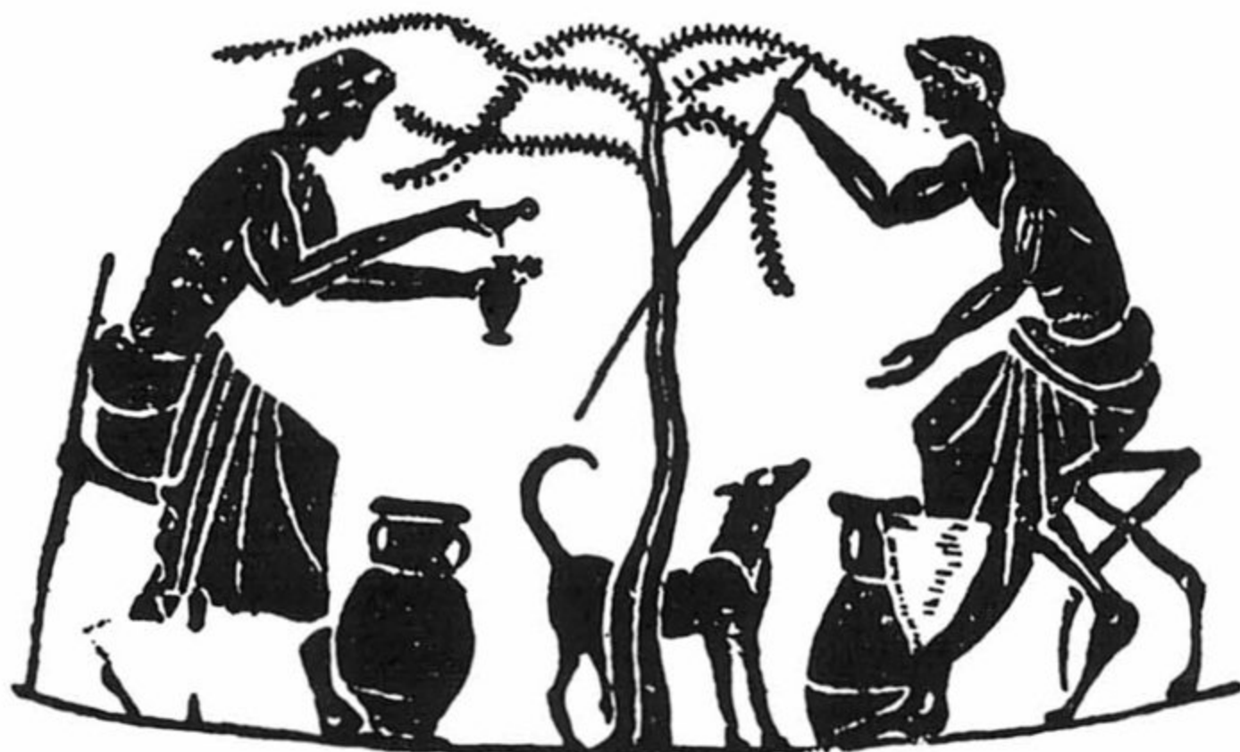
פמכר שמן בתוך כרם-זיתים. לפי ציור על-גבי כד-חרס מן המאה השישית לפני סה"נ (אתונה).

האוהלים והשולחנות, היה מחולק אזורים אזורים; כאן מכרו כלי-בית, וכאן – בדים; בפינה אחת נצטופפו מוכרי ספרים, ובפינה אחרת – מוכרי בשמים ותמרוקים. החלק המיועד לצורכי-אוכל היה החשוב ביותר בשוק, ואף הוא מחולק אזורים אזורים; בחלקו האחד מכרו בשר, באוהלים מיוחדים מכרו לחם וקמח; על פני איזור שלם השתרע שוק הדגים, ובאיזור אחר מכרו יינות ושמן-זית. אף אצל שערי-העיר וברחובותיה נמצאו רוכלים ורוכלות למיניהם, שמכרו מרכולתם לעוברים ושבים, פקדו בתים פרטיים וחיזרו על פני כפרי אטיקה. אף רוכלי 'כול-בו' היו באתונה, אבל בדרך כלל היתה ה'ספציאליזאציה' רבה. אנו מיצאים במקורות לא פחות משמונים סוגים שונים של קמעונאים, החל במוכר מחטים, מוכר נקניקיות, מוכר פרחים, וגמור בסוחר בגדים משומשים 8 .