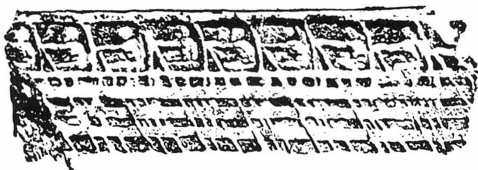
חותרים באוניית מלחמה. לפי תבליט מן המאה החמישית לפני סה"נ (אתונה)

ההליספּונט שבצפון. לאחר מכן העבירו היוונים את המלחמה לאדמת האויב. בשנת 468 זכה צי הברית בפיקודו של האתונאי קימון בניצחון גדול על הפרסים: בקרב ימי ויבשתי בשפך הנהר אורִימדון, שבחוף הדרומי של אסיה הקטנה. הושמדו 200 ויותר מאוניות האויב והוסבו אבידות לצבא היבשה הפרסי; שוח־רו אחרוני היוונים המשועבדים לפרס, ואף כמה עממים לא־יווניים שבחוף אסיה הקטנה הצטרפו לברית המנצחת.