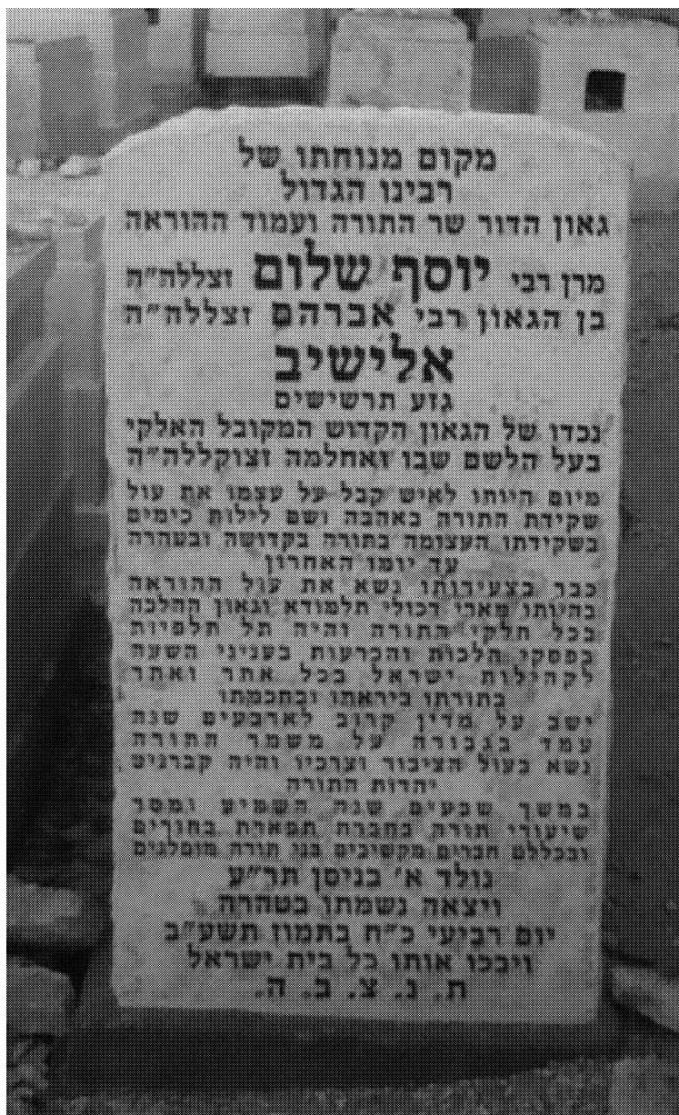
מצבת קבורת רבינו בהר המנוחות