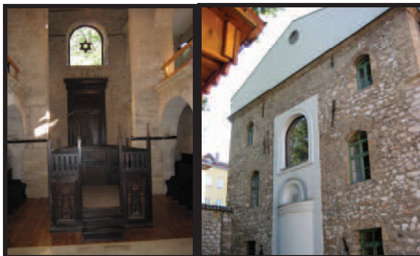
ביהכנ"ס הישן בשאראי בו כיהן רבינו

השלם כמהר"ר צבי אשכנזי נר"ו איננו פה העירה" ותשובתו היתה להתיר החרם אם יתנהג מן היום והלאה כראוי.