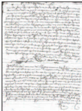
העתק חכ"י מאוצר הכתבי יד של הג"ר דוד אופנהיים

דוד הק' אופנהיים בא"א המנוח המפורסם מהר"ר אברהם אופנהיים ז"ל החונה בק"ק פראג יע"א