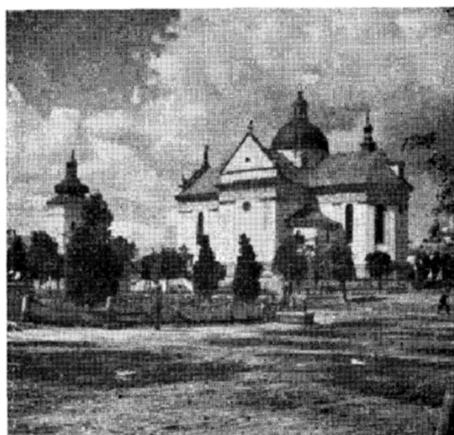
הכנסיה הקטולית "פארא" שבה נמצא קבר המשפחה של מייסד-העיר הטמן סטאניסלאב ז'ולקיאווסקי