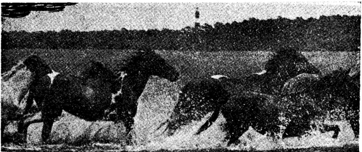
סוסי פרא אמריקנים הם צאצאי סוסים מבויתים שיצאו ל"תרבות רעה" ואיבדו כל רסן בחיים חופשיים בחיק הטבע.

הסוסים באים — לאמריקה עד שהמתישבים הראשונים באו לאמריקה, לא ידעה יבשת זו סוסים — לא פראים ולא מבוית-