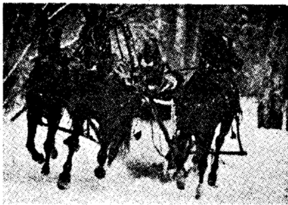
„טרוויקה“ (עגלה עם שלושה סוסים רתומים) בפארק מוסקוואי. פעם זה היה סמל האריסטוקרטיה הרוסית.

בימינו אלה משערים, כי גותרו עדיין כ-17 אלף סוסי פרא, החיים במקומות נידחים באמריקה המערבית. בשנת 1971 חוקקה ממשלת ארה"ב, לאחר סחבת ממושכת, חוק המגן על סוסי הפרא מפני התנכלות והשמדה.