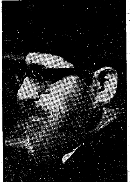
"אני נוהג לבקר אסירים בבתי-כלא, ולעזור אותם לתפילה"

שאלה: האם נוטה כבודו בדרכי-כלל לפסוק לקולא? הרב יוסף: אקרא לאדוני קטע מהסכמה שכתב הרב יצחק ניסים להוועדת ספרי, "ביע אמר": (מאצט) "בכל שאלה הוא חוזר בדברי ראשונים ואחרונים בבקשות עצומה, וכוונתו גדול להכריע הלכה למעשה, ואף כי בכמה שאלות ראיתי שהוא מוכרח לקולא, ומאד רציתי להשתעשע בדבריו, ולהעיד לו על כך, אך מרוב טירדות נבצר ממני להפיק רצוני זה, ותנני מברכך שיזכה להכרעות חיילים בתורה וייקיים בו, נוצח תאנה יאכל פריה".