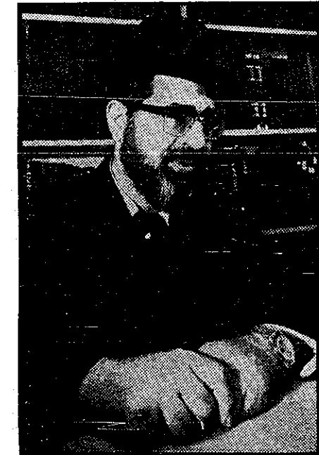
"הייתי רוצה ללכת בעקבות הראשון לציון עזריאל זצ"ל"

הרב יוסף: בשנת 1955, אחרי שהרב ניסים נבחר לראשון לציון, כנסתי לברך אותו, ואז הוא התבטא: "אני יודע שאתה תמליך אחתי ותשב על כסאוי (מייד ביקש ממני להשיב על כמה קושיות בדברי תורה, והראה לי ערימת מיכתבים עם שאלות שקיבל